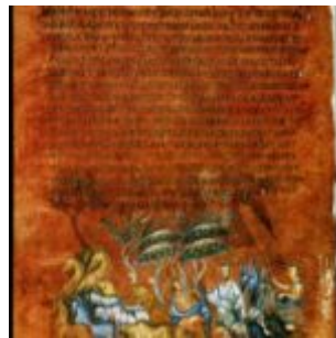
Иаков выбирает стадо в качестве подарка для Исава