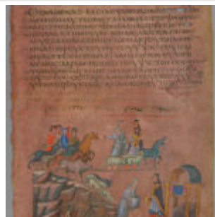
f4r, Авраам и Бера из Содомы, Авраама и Мелхиседека