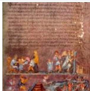
Венская Отъезд Иосифа