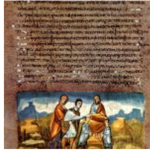
Благословение Ефраима и Манассии