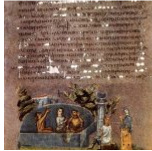
Joseph In Prison