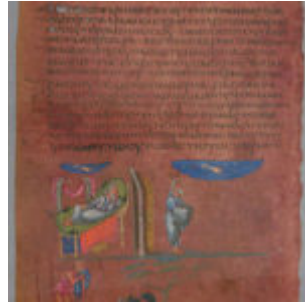
F4v, Обещание потомков Аврааму

https://www.onb.ac.at/forschung/forschungsblog/artikel/news/vienna-genesis/