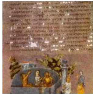
Венская Иосиф в тюрьме