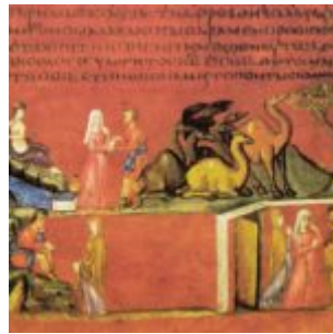
Венская Сцены из жизни Иакова