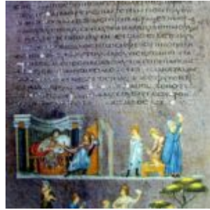
Венская Иосиф и жена Потифара