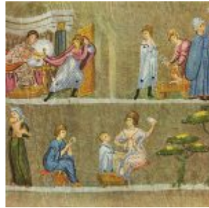
Иосиф и жена Потифара, фрагмент