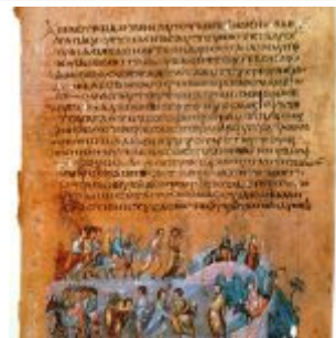
Венская Книга Бытия, фрагмент