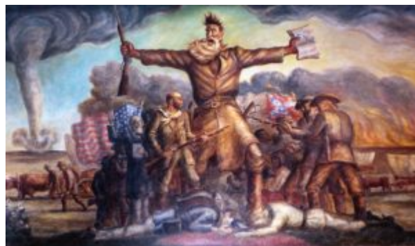
«Трагическая прелюдия», изображающая аболициониста Джона Брауна в здании Капитолия штата Канзас, Джона Стюарта Карри (1930)

Нью-Йорке. В фойе были заказаны два изображения, авторы которых — Джон Стюарт Карри и Диего Ривера. Владельцы здания, семья Рокфеллеров, обнаружили, что Ривера, коммунист, поместил образ Ленина в толпу на картине и уничтожили его. Картина была заменена произведением другого испанского художника, Хосе Марии Серт.