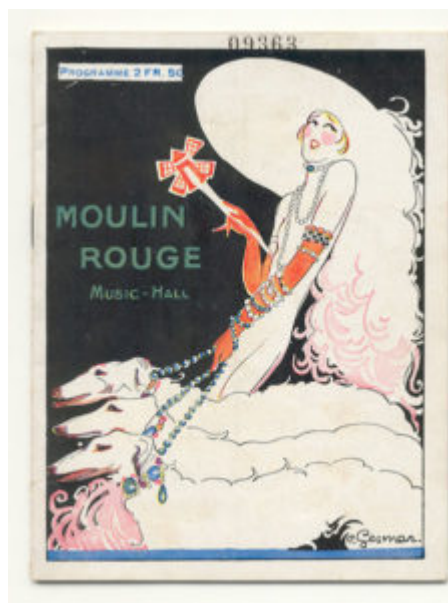
Плакат Мулен Руж Шарль Гесмар (1925)

Выставка Декоративного искусства, продемонстрировав победу конструктивизма, попутно дала жизнь движению Ар деко, ставшему экзотическим смешением кубизма и стиля модерн, иначе говоря, линейной стилизации и изысканным орнаментом. Мода на тюрбаны и деяния, стилизованные под «Египет» и «Китай», причудливо перемешалась с ритмами геометрической планиметрии.