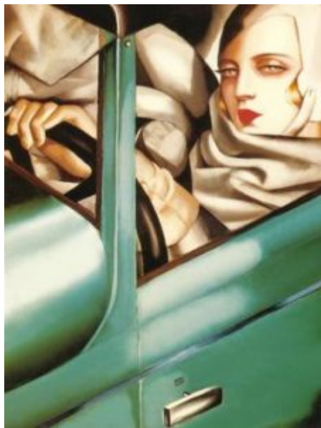
Т. Лемпицка. Автопортрет, Тамара в зеленом Бугатти (1929)