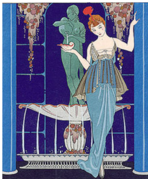
Иллюстрация Жоржа Барбьера из платья Пакуина (1914). Стилизованные цветочные узоры и яркие цвета были особенностью раннего арт-деко

Парижские универмаги и дизайнеры моды сыграли важную роль в подъеме Art Déco. Учрежденные фирмы, в том числе производитель сумок Louis Vuitton, фирма серебра Christofle, дизайнер стекла Рене Лалик и ювелиры Louis Cartier и Boucheron, которые начали разрабатывать продукты в более современных стилях. Начиная с 1900 года универмаги нанимают декораторов для работы в своих дизайн-студиях. Украшение 1912 Salon d'Automne было поручено универмагу Printemps. В том же году Printemps создал собственный семинар под названием «Primavera». К 1920 году Primavera заняла более трехсот художников. Стили варьировались от обновленных версий Louis XIV, Louis XVI и особенно мебели Louis Philippe, сделанных Louis Süe и мастерской Primavera до более современных форм из мастерской универмага Au Louvre. Другие дизайнеры, в том числе Эмиль Жак Рульманн и Пол Фолио, отказались использовать массовое производство и настаивали на том, чтобы каждая деталь была сделана индивидуально вручную. В стиле раннего арт-деко были представлены роскошные и экзотические материалы, такие как эбеновое дерево, слоновая кость и шелк, очень яркие цвета и стилизованные мотивы, особенно корзины и букеты цветов всех цветов, придающие модернистский вид.