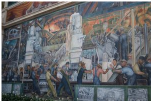
Часть росписи «Детройт Индустрия» Диего Ривера в Детройтском институте искусств (1932-33)