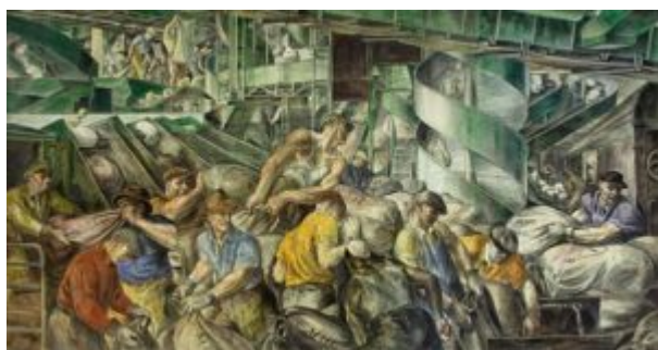
Реджинальд Марш, 1936, Рабочие сортируют почту, роспись в таможне США в Нью-Йорке

Мероприятие, обозначившее зенит стиля и назвавшее его, было Международной выставкой современного декоративного и промышленного искусства, которая проходила в Париже с апреля по октябрь в 1925 году. Официально она была организована правительством Франции и охватывала в Париже площадь 55 акров, идущий от Гран-Пале на правом берегу до Инвалидов на левом берегу и вдоль берегов Сены. Большой Пале, самый большой зал в городе, был наполнен экспонатами декоративного искусства из стран-участниц. Было представлено 15 000 экспонентов из двадцати разных стран, включая Англию, Италию, Испанию, Польшу, Чехословакию, Бельгию, Японию и новый Советский Союз; Германия не была приглашена из-за напряженности после войны, а Соединенные Штаты, не понимая цель выставки, отказались от участия. За семь месяцев выставку посетили шестнадцать миллионов человек. По правилам выставки требовалось, чтобы вся работа была современной; исторические стили не допускались. Основной целью выставки было продвижение французских производителей роскошной мебели, фарфора, стекла, металлических изделий, текстиля и других декоративных изделий. Для дальнейшего продвижения продуктов все основные парижские универмаги и крупные дизайнеры имели свои собственные павильоны. Экспозиция имела второстепенную цель в продвижении продуктов из французских колоний в Африке и