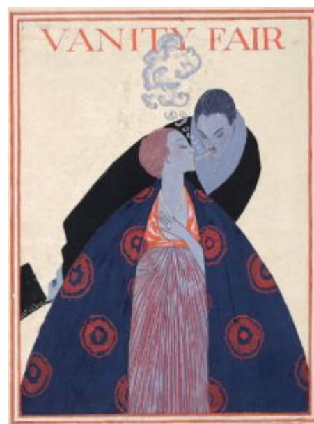
Обложка Vanity Fair, Жорж

Во время модерна плакаты обычно рекламировали театральные товары или кабаре. В 1920-х годах плакаты