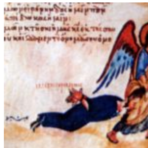
Ангел тащит иконоборца за волосы