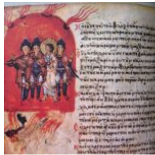
The song of the three youths