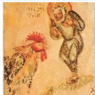
Апостол Петр и петух