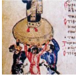
Roman custom of proclamation of emperor on the shield. King Hezekiah