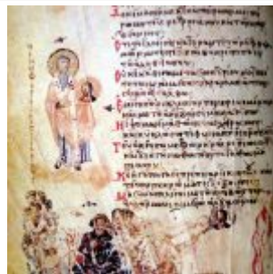
Admittedly — iconoclast council of 815, with emperor Lev and patriarch Theodot I