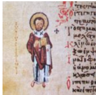
John Chrysostom ad marginem