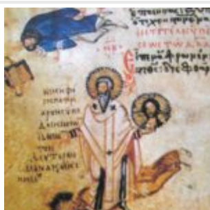
Nikephoros I of Constantinople trample on John VII of Constantinople, who is laying on the ground with coins