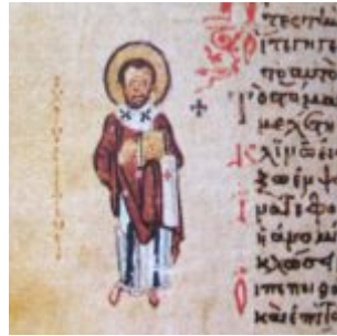
John Chrysostom ad marginem