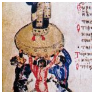
Roman custom of proclamation of emperor on the shield. King Hezekiah