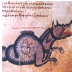
Иона во чреве кита