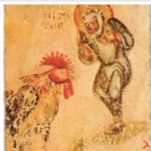
Апостол Петр и петух