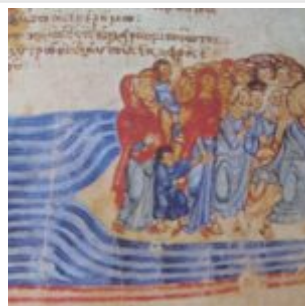
Crossing of Red Sea