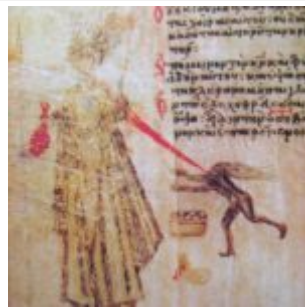
A sinner, John VII of Constantinople, with purses and devil

Интересны и чисто народные черты рукописи, которые дают о себе знать в стиле её миниатюр: большие, тяжелые головы, приземистые выразительные фигуры, угловатые, резкие, полные живости движения, своеобразная манера перегружать поля страницы крупными изображениями, наивная обстоятельность рассказа, нередко избыточное реалистическими деталями, грубоватый юмор — все эти элементы восходят к народным источникам. «Никогда больше константинопольское искусство не говорило на таком языке. Поддавшись на несколько десятилетий натиску народного искусства, оно перешло вскоре в ответное наступление, решительно обратившись к эллинистической традиции, которая способствовала растворению в неоклассическом стиле конца IX века столь опасных для его самобытности влияний. Этот перелом произошел уже в эпоху Македонской династии, чья художественная культура составляет одну из самых блестящих страниц в истории византийского искусства» (Лазарев В. Н. История византийской живописи).