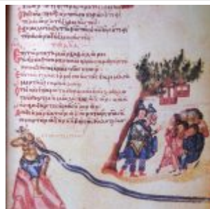
Psalm By the rivers of Babylon