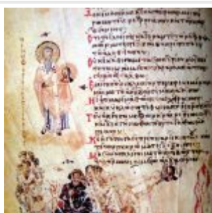
Admittedly — iconoclast council of 815, with emperor Lev and patriarch Theodot I