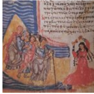
Crossing Red Sea and Miriam dancing