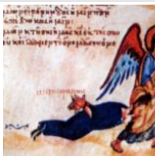
Ангел тащит иконоборца за волосы