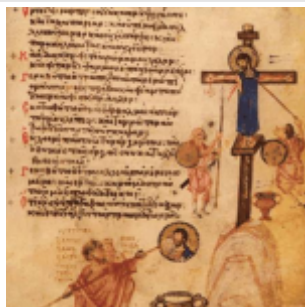
Распятие с иконоборцами