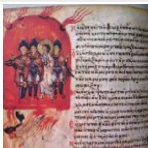
The song of the three youths