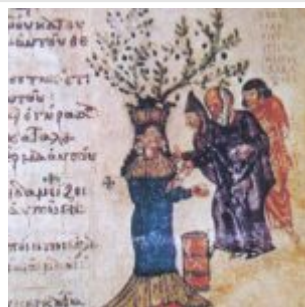
Allegory of charity