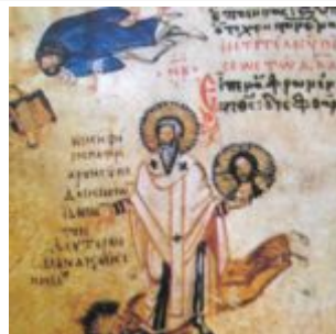
Nikephoros I of Constantinople trample on John VII of Constantinople, who is laying on the ground with coins