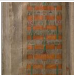
289v. Небесный Град