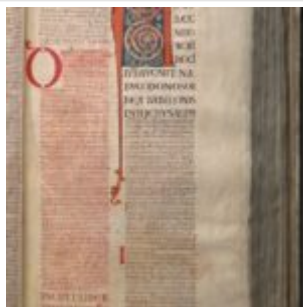
52r. Заставка Книги пророка Даниила