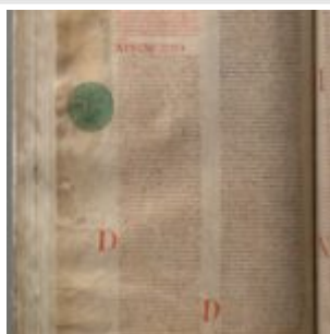
118v. Небо и Земля в начале «Иудейских древностей»