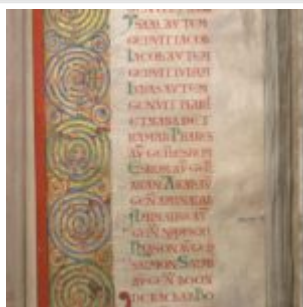
254r. Инициал Евангелия от Матфея