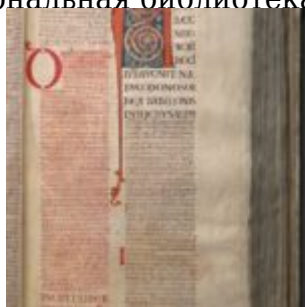
52r. Заставка Книги пророка Даниила