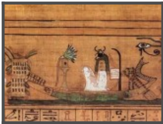
Фрагмент главы 17. Ани молится солнечной ладье, "плывающей" на знаке неба. В ней сидит Хепри - утреннее солнце (фигура со скарабеем вместо головы).