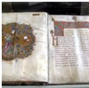
Мстиславово Евангелие. До 1117 года 35,3 × 28,6 см Государственный Исторический музей