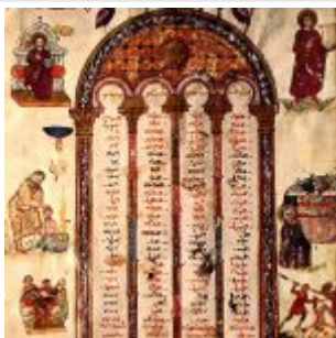
Rabula Gospels Folio 04v Canon Table