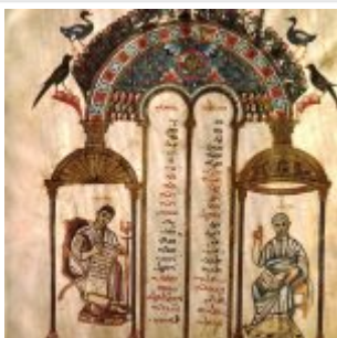
Rabula Gospels Folio09v Matthew John