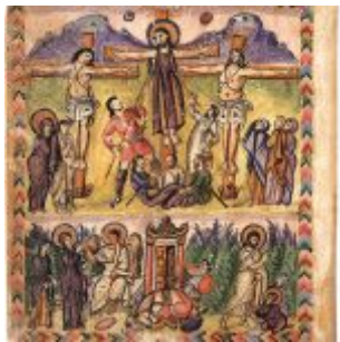
the Crucifixion and Resurrection of Jesus Christ