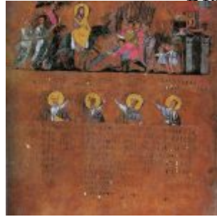
De intocht van Christus in Jeruzalem, een miniatuur van eind 6de eeuw na Christus