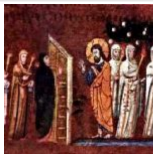
Wise Fool Virgins