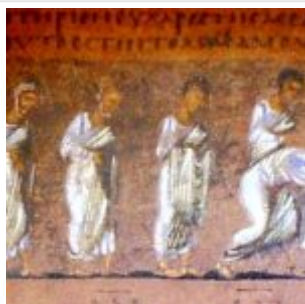
Procession Of Apostles