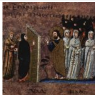
Meister des Evangeliers von Rossano 002-cropped