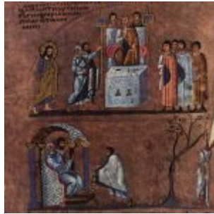
Meister des Evangeliars von Rossano 001