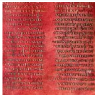
the beginning of the Gospel of Mark