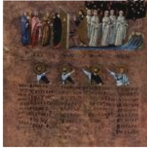
Meister des Evangeliars von Rossano 002