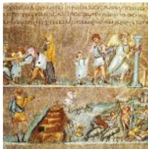
Een miniatuur uit de 6de eeuw over Jozef en zijn broeders