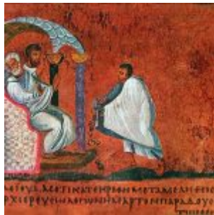
Judas rendant les trente deniers