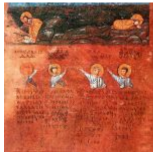
Agony in the garden

Но миниатюры Евангелия Россано были созданы не константинопольским живописцем. Над оформлением рукописи работал мастер, принадлежавший к школе восточных провинций империи, это можно предположить по типу коротких большеголовых фигур и особенно по их лицам с круглыми глазами, зрачки которых сдвинуты в сторону. По своему характеру они выдают определенное сходство с персонажами, составляющими повествовательные сцены в Церкви св. Аполлинария Нового.