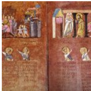
Der Einzug nach Jerusalem