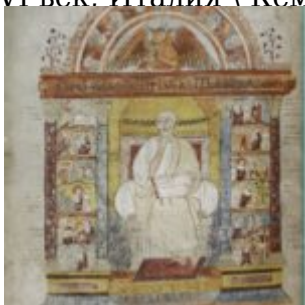
129v. Евангелист Лука