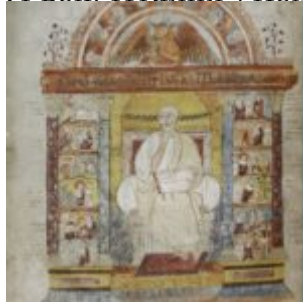
129v. Евангелист Лука