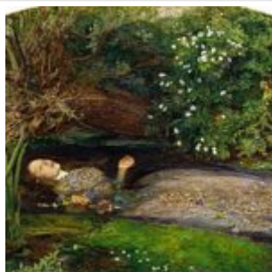
«Офелия», Д. Э. Милле, одна из самых известных картин прерафаэлитов