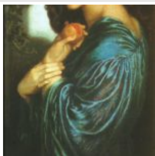
«Прозерпина», Д. Г. Россетти 1874 год, галерея Тейт, Лондон