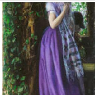
«Апрельская любовь», Артур Хьюз 1855-1856, Тейт, Лондон