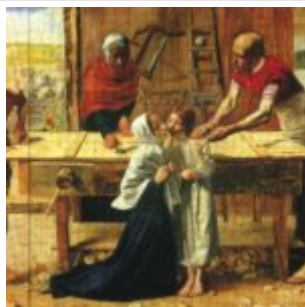
«Христос в родительском доме», Д. Э. Миллес 1850 год, галерея Тейт, Лондон