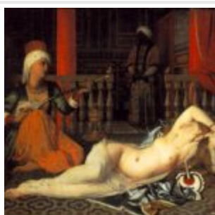
одалиска с рабыней