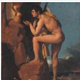
эдип и сфинкс