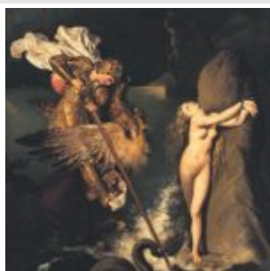
руджьеро и анжелика