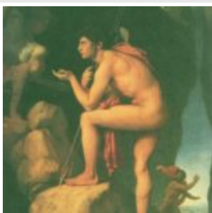
эдип и сфинкс