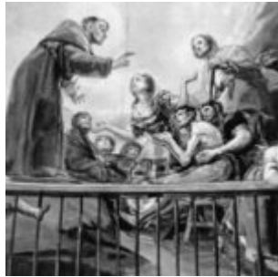
чудо св антония падуанского