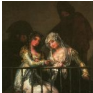
махи на балконе