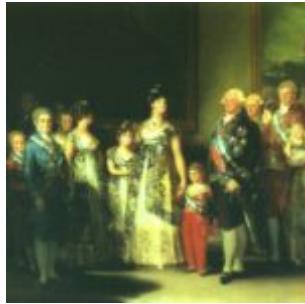
семья Карлоса IV