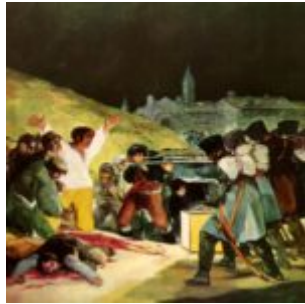
расстрел повстанцев в ночь на 3 мая 1808_1814