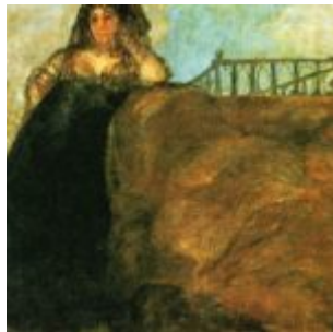
леокадия_росписи дома глухого