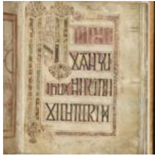
St Chad Gospels, page 143