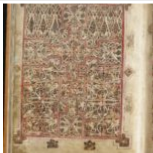
St Chad Gospels, page 220