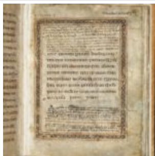
St Chad Gospels, page 141