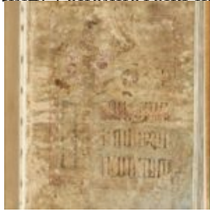
St Chad Gospels, page 1