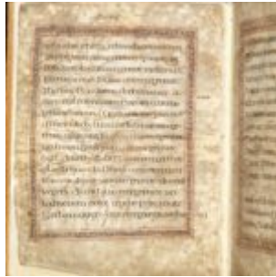
St Chad Gospels, page 2