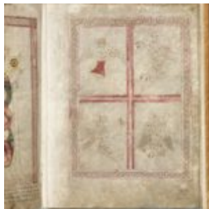
St Chad Gospels, page 219