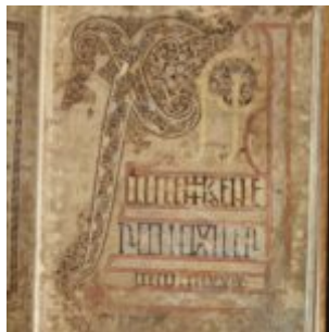
St Chad Gospels, page 5