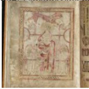
St Chad Gospels, page 142