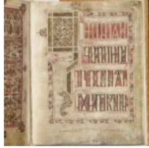
St Chad Gospels, page 221

Евангелие из Личфилда (Евангелие св. Чада, Каэдда) 730, Личфилл. \ библиотека кафедрального собора Личфилда | 6