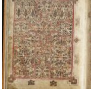
St Chad Gospels, page 220

Евангелие из Личфилда (Евангелие св. Чада, Каэдда) 730, Личфилд. \ библиотека кафедрального собора Личфилда | 6