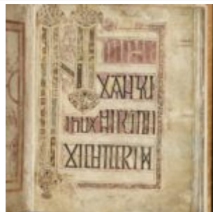
St Chad Gospels, page 143