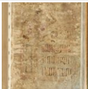
St Chad Gospels, page 1

Вторая маргинальная надпись представляет определенный интерес, так как содержит уникальный пример ранней Валлийской прозы, в которой зафиксированы детали разрешения земельного спора. Первые две надписи были датированы серединой девятого века. Третья — восемь надписей, датируются девятым и десятым веками.