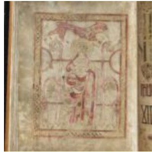
St Chad Gospels, page 142