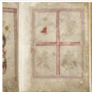
St Chad Gospels, page 219