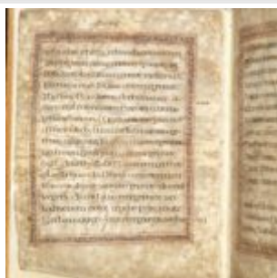
St Chad Gospels, page 2