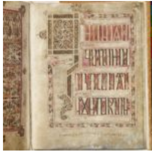
St Chad Gospels, page 221

https://lichfield.ou.edu/st-chad-gospels/features