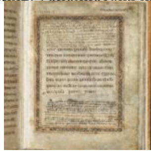
St Chad Gospels, page 141