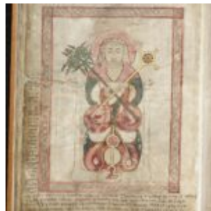
St Chad Gospels, page 218