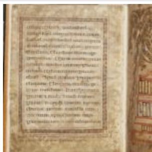
St Chad Gospels, page 4