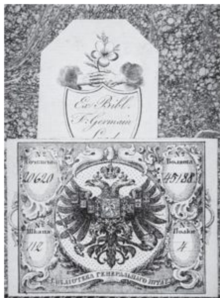
Ил. 9. Два экслибриса. Фламандский часослов. Брюгге. Третья четверть XV в. Москва. РГБ. Ф. 68, № 438