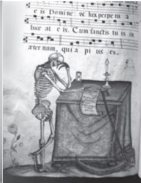
Ил. 3. Смерть у алтаря. Миниатюра из градуала. Германия. Ок. 1725 г. Москва. РГБ. Ф. 270, 16, № 4, с. XXXVI

Уникальное место в работе любого каталогизатора западноевропейских латинских рукописей занимают часословы, настоящие бестселлеры Позднего Средневековья с почти трехсотлетней историей. Наиболее популярны они были во Франции. Не случайно на парижской выставке 1993 года из 240 рукописей часословов было почти 100 (для сравнения: в московских собраниях 26 французских часословов, и это половина всех французских рукописей). Часословы лучше всего сохранились, они легче поддаются локализации. Историю французской живописи XIV–XVI веков вполне можно было бы написать только по часословам. Эта история не станет исчерпывающе полной, но в ней будут отражены все ее основные этапы, особенности местных школ, лицо той или иной мастерской, эволюция индивидуальных манер миниатюристов и многое другое. Важность часословов как опоры во многих аспектах исследования рукописей осознали давно и везде. За последние десятилетия они становились много раз объектами отдельных самостоятельных публикаций. На новом этапе принципиально изменилась работа с текстами часословов. Сегодня в распоряжении составителя каталога есть целый ряд справочных изданий, с помощью которых максимально точно можно локализовать все части текста часослова. Это относится к календарям (где для локализации равно важны все три списка – золотой, красный и синий), суточному циклу служб, заупокойной службе (здесь пригодился справочник датчанина Кнута