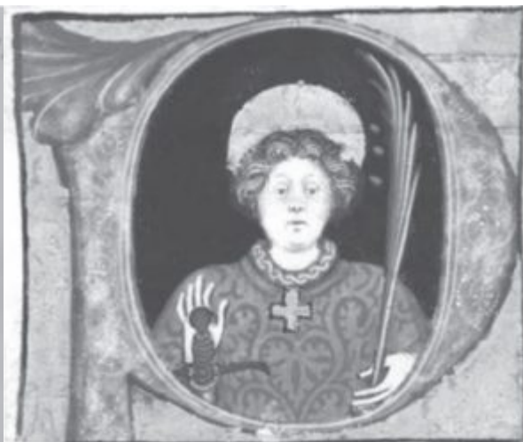
Ил. 8. Неизвестный святой. Историзованный инициал из хоровой книги. Ломбардия. Середина XV в. Филадельфия (США). Публичная библиотека. Lewis E M 29:4