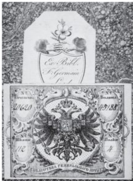
Ил. 9. Два экслибриса. Фламандский часослов. Брюгге. Третья четверть XV в. Москва. РГБ. Ф. 68, № 438