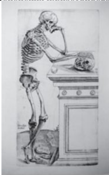
Ил. 4. Ян Стефан ван Калькар. Иллюстрация к «Анатомии» Андрея Везалия. Базель. 1543. С. 164

миниатюриста, и его опора на хорошо известную или малоизвестную гравюру, фреску или картину – одна из составляющих характеристики творческой индивидуальности мастера, его роли и места в художественном контексте эпохи. Подобные цитаты помогают датировать и особенно локализовать рукопись, расшифровать тот или иной сюжет и образ. Наконец, если говорить о гравюре, то ценность подобных цитат в рукописях с фиксированными датами изготовления еще и в том, что они служат своеобразным terminus post quem при датировке ранних гравированных образцов, которые не имеют дат в принципе. В подобном случае исследователь книжной миниатюры вносит вклад в изучение и ранней гравюры тоже.