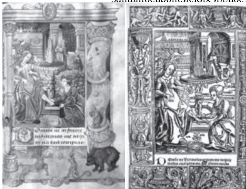
Ил. 1. Давид и Вирсавия. Миниатюра из часослова. Бургундия. Начало XVI в. Москва. РГБ. Ф. 183, № 1911, f. 74 Ил. 2. Давид и Вирсавия. Гравюра из печатного часослова Пьера Реньо. Руан. Начало XVI в.

среди прочих наклеены семь историзованных инициалов неизвестного монограммиста CZ, работавшего в конце XVI века. Ориентация на гравированные источники в его сюжетных композициях была очевидна с первого взгляда. Часть их также удалось найти: так, сцену борьбы архангела Михаила с сатаной монограммист скопировал с гравюры нюрнбергского мастера начала XVI века Ханса Шпрингинклее, «Богоматерь с Младенцем» – с гравюры Луки Лейденского 6 .