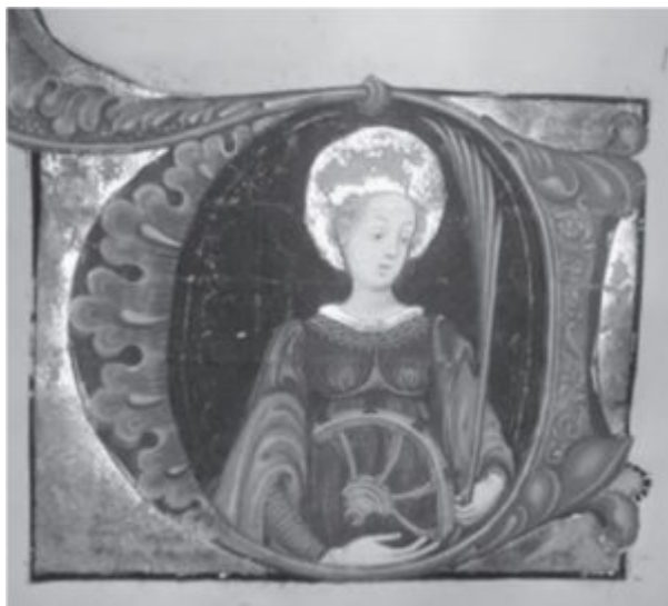
Ил. 7. Св. Екатерина.

сыщешь, каждый из нас в меру своих возможностей сам осваивает эту премудрость - и на помощь приходят профессиональные сайты и базы данных. Благодаря этим сайтам удалось уточнить или