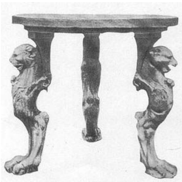
Круглый мраморный стол на трёх

Традиционная кровать ( lectus cubicularis, lectus genialis ), обычно деревянная, богато драпировалась и имела мягкую обивку. Четыре выточенные ножки несли четырехугольную деревянную раму с низким — косым или изогнутым — изголовьем. Профилированные поперечины, интарсия и бронзовые украшения на раме придавали этой мебели очень эффектный вид. На базе этой мебельной формы возникли носилки, которыми пользовались знатные римляне для передвижения по городу. Эти кресла-носилки в зависимости от состоятельности их владельца были более или менее роскошными.