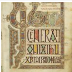
Евангелие из Линдисфарна, Лист 27r, с инципитом Евангелия от Матфея