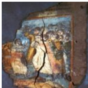
Коттоновский генезис, Дом Лота. Фрагмент 4v