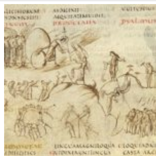
Утрехтская Псалтирь, псалм 11

http://www.uky.edu/~kiernan/Bib03/ajp-pms.htm