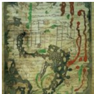
Карта мира, сделано в Англии около 1000 (Cotton Тиберия V, фолио 56)