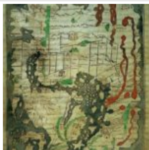
Карта мира, сделано в Англии около 1000 (Cotton Тиберия V, фолио 56)