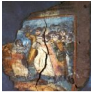
Коттоновский генезис, Дом Лота. Фрагмент 4v