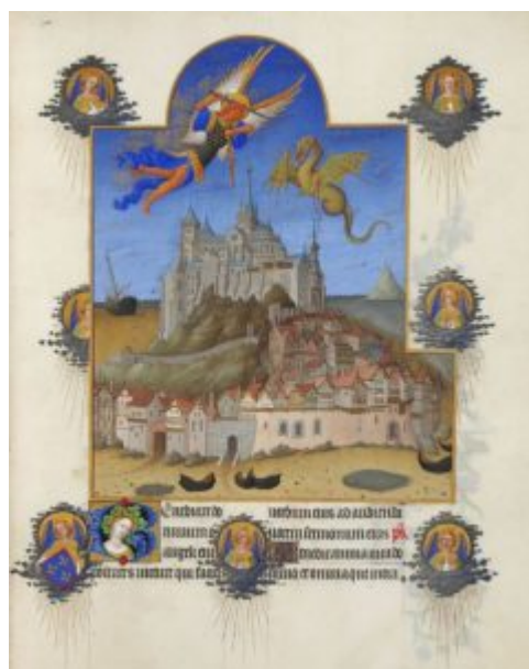
Битва архангела Михаила с драконом, Роскошный часослов, Лимбурги

Первые ростки светского собирательства проявились во 2-й половине XIV века при Карле V. Этот период стал временем затишья в Столетней войне. Для демонстрации усиления королевской власти Карл V развернул работу по реконструкции резиденции, уделяя внимание внутреннему убранству.