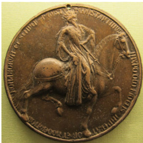
Копия медали с Константином на коне, принадлежавшей Ж.Беррийскому

Жан Французский, герцог Беррийский (1340—1416) был личностью далеко не заурядной. Дипломат, полководец, государственный деятель, меценат, он играл заметную роль в истории Франции той эпохи: все 76 лет его жизни приходится на годы Столетней войны с Англией (1337—1453). Сражения и заговоры, дипломатические миссии, годы плена, проведенные Жаном Беррийским в Англии (в качестве заложника за своего отца Иоанна Доброго), кровавая распря между двумя ветвями королевской семьи — Орлеанской и Бургундской (война Арманьяков и Бургиньонов), во время которой герцог потерял много близких и его собственная жизнь не раз висела на волоске, а многие его владения были разграблены и сожжены, частые эпидемии чумы, опустошавшие Европу, — все это воссоздает картину, далекую от мирного благоденствия, отнюдь не благоприятствующую увлечению искусством. Но действенная потребность прекрасного навсегда оставила имя Жана Беррийского в памяти человечества.