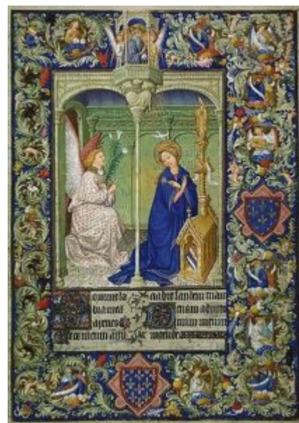
Прекрасный часослов герцога Беррийского. н. XV в. Les Belles Heures Лист 30 Благовещение. Лимбурги. Метрополитен