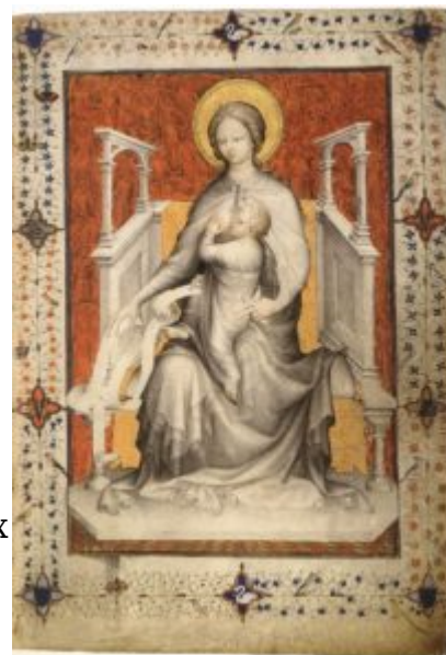
Жакмар де Эсден. Прекраснейший Часослов герцога Беррийского. Tres Bells Heures ок. 1402 Королевская библиотека в Брюсселе