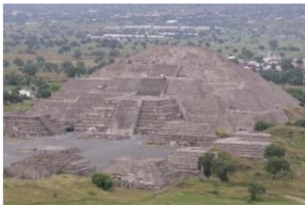
Пирамида Луны (Теотиуакан, Мексика)

приносились прежде в виде маиса и единственного домашнего животного — собаки. О более разработанной религии перуанцев и мексиканцев. Каннибализм, замеченный во многих местах, везде имел религиозные основы. Место жрецов заступают особые колдуны, которые в то же время и врачи. Погребальные церемонии, одинаковые в общем у всех И., сопровождаются воем, вырыванием волос, разрушением хижины, где произошла смерть; труп хоронят в сидячем положении, что достигается особым обвязыванием покойника. В древнем Перу была употребительна особая мумификация трупов, завертывавшихся в массу различных одеяний.