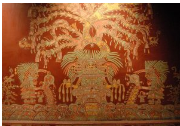
Великая богиня Теотцуакана (настенная роспись)

Религии индейцев разнообразны, но, не представляя следов монотеизма, сильно затрудняли миссионерам перевод христианского понятия «бог». Это, впрочем, не относится к инкам, поклонение которых Виракоче постепенно приобретало монотеистические черты. Идея божества у индейцев не успела определиться и принять точное значение; трудно определить также, каковы их идеи о сотворении мира. Во многих случаях мы имеем дело с обожанием светил, солнца и луны, на которых смотрят как на мужа и жену; иногда главы племен обязаны приносить им жертвы. Явления природы вызвали также олицетворения — воды, грозы, грома и молнии: сохранился перуанский гимн к грому. Число четыре у многих племен имеет магическое значение; признаются также многочисленные приматы. Космогонических и других мифологических рассказов собрано большое количество среди индейцев; все они представляют громадное сходство с полинезийскими. Есть у них и своё сказание о потопе.