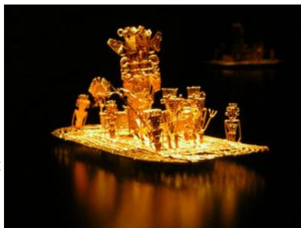
Золотой плот чибча из Эльдорадо, Золотой музей, Богота

В этот момент наследника раздевали донага, намазывали клейкой землей и осыпали