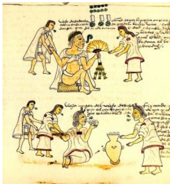
Рисунок из Кодекса Мендосы, изображающий принятие опьяняющих веществ пожилым ацтеком, Мексика, около 1553 г. н. э.

Ацтекский пантеон складывался под сильным влиянием многих соседних и поко ренных ими народов. Согласно ацтекским мифам, вселенная была создана Тескатлипокой и Кецалькоатлем и прошла четыре этапа (или эры) развития. Первая эра («Четыре ягуар»), в которой верховным божеством в образе солнца был Тескатлипока закончилась истреблением ягуарами племени гигантов, населявших тогда землю. Во второй эре («Четыре ветер»), «солнцем» стал Кецалькоатль у и она завершилась ураганами и превращением людей в обезьян. Третьим «солнцем» стал Тлалок, и его эра («Четыре дождь») закончилась всемирным пожаром. В четвертой эре («Четыре вода») «солнцем» была богиня вод Чальчиуиталикуэ; этот период завершился потопом, во время которого люди превратились в рыб. Современная пятая эра («Четыре земле трясение») с богом солнца Тонатлиу должна закончиться страшными катаклизмами. Каждые 52 года вселенная, как полагали, подвергалась опасности быть уничтоженной, по этому окончание такого цикла и начало нового сопровождалось особо торжественными обрядами.