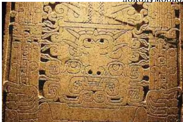
Так называемая Стела Раймонди, Анкаш, Перу

Одной из распространённых тем в чавинской культуре было изображение антропоморфных фигур с кошачьими чертами. Выявлено несколько божеств чавинской религии, которые часто встречаются в местных изображениях. Основное божество имело длинные клыки и длинные волосы, состоящие из змей. Этот бог, как предполагается, отвечал за равновесие противоборствующих сил. Среди других выявленных богов были: бог, отвечавший за пищу, изображавшийся в виде летучего каймана; бог подземного мира в виде анаконды; бог сверхъестественного мира, обычно в виде ягуара. Указанные божества представлены на керамике, металлических предметах, тканях и в скульптурах.