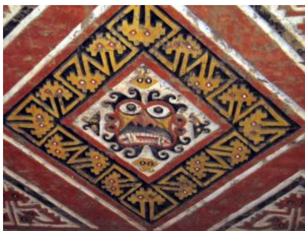
Храм Луны(настенная роспись Отсекающий голову)

У мочика существовали кровавые ритуалы. После изучения многих скелетов учёные пришли к выводу, что они были принесены в жертву богам, по-видимому, чтобы просить их о дождях, которые в этом регионе крайне редки. Также есть доказательства, что в культуре мочика высокие позиции занимали женщины. К примеру, на сохранившихся изображениях чаши с кровью жертв правителю подают именно они. Вопрос, кем были жертвы, является предметом споров среди ученых. По одной версии, они были проигравшими в ритуальных поединках среди элиты, по другой — пленными в вооруженных конфликтах с соседними племенами и городами-государствами.