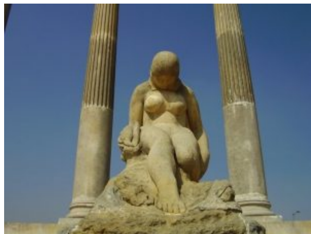
Статуя богини воды Суэ, отождествляется с Vachué. Высеченными в камне Bogotan скульптор Мария Тереса Зерде

Индейцы Гуатавиты имели обычай устраивать в честь великих богов состязания по бегу вокруг озера Гуатавита, особенно среди девушек-девушечек. На состязание, как на праздник, стекались жители всех окрестных сел и деревень. Холмистые берега большого озера становились своеобразными трибунами этого природного «стадиона». Толпы празднично одетых индейцев наблюдали за стремительным бегом абсолютно обнаженных 130 лучших спортсменов »-бегуний, неистовыми криками поддерживая своих избранниц. Обежавшая озеро первой считалась победительницей. Ее, распростершуюся ниц у ног правителя, поднимал сам царь» и, прикрыв наготу разгоряченной и запыхавшейся бегуни великолепным плащом, возлагал на ее голову золотую корону, напоминавшую полумесяц с высоко поднятыми краями. По обычаю, эта девушка становилась одной из многочисленных служительниц- «весталок» в главном храме бога солнца...»