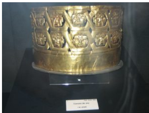
Золотая корона из Кунтур-Уаси

В чавинской религии имелись ритуалы изменения сознания с использованием галлюциногенов. Было обнаружено множество скульптур, изображающих превращение человеческой головы в голову ягуара. Также имеется несколько вырезанных изображений с подобным сюжетом. Использование психотропных наркотиков для религиозных целей косвенно подтверждают археологические источники. В данной местности произрастают кактусы Сан-Педро, обладающие психоделическим эффектом. Эти кактусы также часто изображаются в иконографии Чавинской культуры, в частности, один из богов держит кактус как жезл. Ещё одним косвенным свидетельством