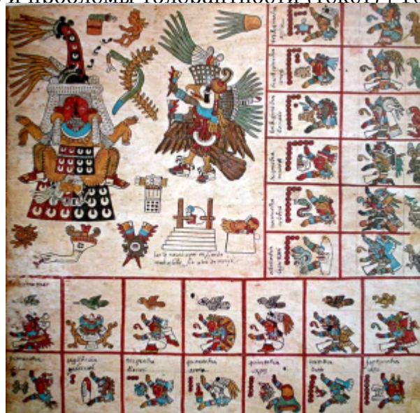
Ацтекский рисунок, Бурбонский кодекс

В основе ацтекской мифологии лежат представления о вечной борьбе двух начал (света и мрака» солнца и влаги» жизни и смерти и т. д.)» о развитии вселенной по определенным этапам или циклам» зависимости человека от воли божеств» олицетворявших силы природы, необходимости постоянно питать богов (некоторых даже ежедневно) человеческой кровью, без которой они погибнут. Смерть богов означала бы мировую катастрофу. Именно поэтому у ацтеков широкое