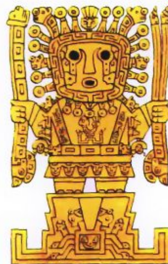
Ви́ракоча ( ), цивилизация Тиуанако

Важное место в религии инков занимал культ предков. С ним был связан обычай