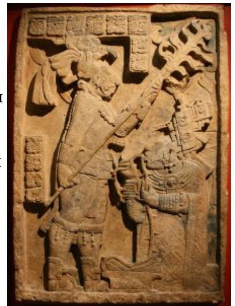
Майанская королева совершает религиозный обряд самоистязания — пропускает канат через верхнюю губу

Важное значение в пантеоне майя занимал бог кукурузы, изображавшийся в виде юноши в головном уборе, напоминающем початок кукурузы. Среди небесных божеств главным был владыка мира Ицамна — старик с беззубым ртом и морщинистым лицом. Он считался творцом мира, основателем жречества, изобретателем письменности. Большую роль среди майяских божеств играл бог огня, имевший облик старика с огромным