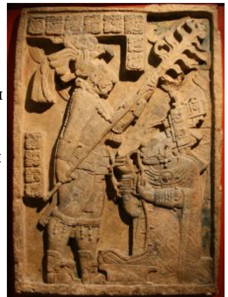
Майанская королева совершает религиозный обряд самоистязания — пропускает канат через верхнюю губу

Важное значение в пантеоне майя занимал бог кукурузы, изображавшийся в виде юноши в головном уборе, напоминающем початок кукурузы. Среди небесных божеств главным был владыка мира Ицамна — старик с беззубым ртом и морщинистым лицом. Он считался творцом мира, основателем жречества, изобретателем письменности. Большую роль среди майяских божеств играл бог огня, имевший облик старика с огромным