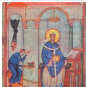
Чудо св. Григория. Миниатюра из Кодекса св. Григория, ок. 983-985 гг.Трир, Городская библиотека