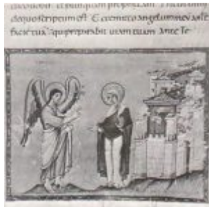
Благовещение. Миниатюра Кодекса Эгберта, ок. 985 г. Трир, Городская библиотека