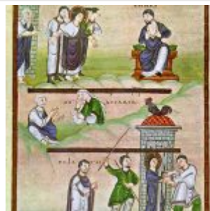
Иисус и Пилат; отречение Петра; бичевание