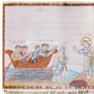
Иисус открывается ученикам