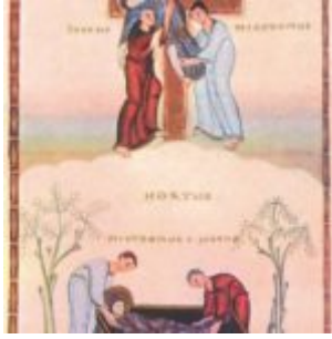
Снятие со креста и Положение во гроб. Миниатюра из Кодекса Эгберта, ок. 985 г. Трир, Городская библиотека