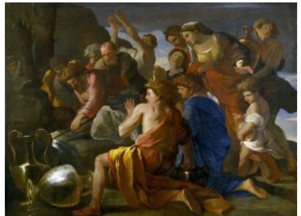
Моисей, очищающий воды Мерры, 1629-1630

заказ: парижский иезуитский колледж поручил Пуссену и другим художникам написать шесть больших картин на сюжеты из жития святого Игнатия Лойолы и святого Франциска Ксаверия. Картины, исполненные в технике à la détrempe , не сохранились. Творчество Пуссена привлекло внимание проживавшего во Франции, по приглашению Марии Медичи, итальянского поэта и кавалера Марино; 1569—1625).