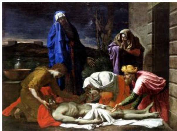
Оплакивание Христа, 1657-1658, Дублин

элементов восходит к античным рельефам, посвященным мифу о Селене и Эндимионе 19 . По одной из версий этого мифа, богиня Селена усыпляет прекрасного Эндимиона, чтобы целовать спящего юношу. В этой ситуации нетрудно усмотреть аналог сюжета, заимствованному Пуссенем из поэмы Тассо.