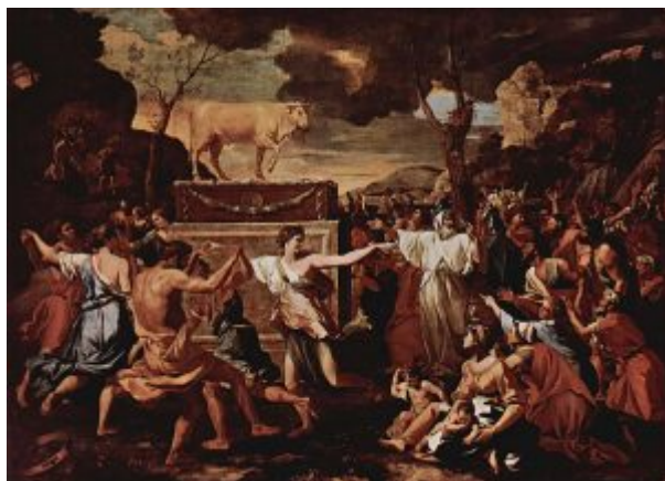
Поклонение золотому тельцу, 1634, Лондон

«Поклонение золотому тельцу», вместе с парной к ней картиной «Переход через Красное море», которая сейчас находится в Мельбурне, были написаны около 1634 г. Оба произведения иллюстрируют различные эпизоды из книги Исход Ветхого Завета. Это вторая книга Пятикнижия Моисея, повествующая об исходе евреев из Египта, сорокалетнем скитании по пустыне, и наконец, обретении Земли Обетованной. Эпизод с золотым тельцом относится к 32 главе Исхода.