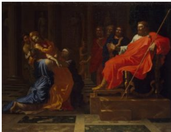
Эсфирь перед Артаксерксом. Конец 1650-х г.

«Эсфирь перед Артаксерксом» делится на две части: справа изображены Артаксеркс и его советники, слева Эсфирь и ее служанки. Торжественное чередование колонн и ниш со статуями на втором плане задает ритм всей сцене, но этот строгий порядок нарушается группой служанок, поддерживающих Эсфирь, которая от волнения теряет сознание. Одежды Артаксеркса лишены подобающих царю украшений, но благодаря насыщенному красному цвету плаща кажутся роскошным нарядом.