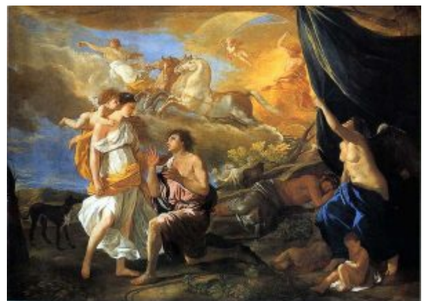
Селена (Диана) и Эндимион, 1630, Детройт

Выделение этих линий художественной ориентации Пуссена в ранний римский период, давно утвердившееся в искусствоведческой литературе, вряд ли может быть всерьез оспорено. Однако в основе столь разнообразной направленности исканий мастера лежит закономерность общего порядка, имеющая фундаментальное значение для понимания искусства Пуссена в целом.