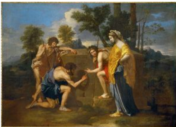
Аркадские пастухи (Et in Arcadia ego v2) 1638-1639, Лувр

Сюжет не имеет конкретного литературного источника. Мотив саркофага в Аркадии встречается в пятой эклоге Вергилия, где поэт рассказывает о друзьях Дафниса, прекрасного пастуха, сына Гермеса и нимфы, погибшего от несчастной любви. Они оплакивают его смерть и пишут эпитафию на его саркофаге.