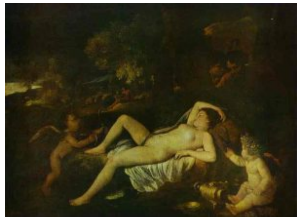
«Спящая Венера» (ок. 1630, Дрезден, Картинная галерея)