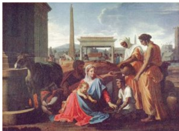
«Отдых на пути в Египет», 1658, Эрмитаж

пространства, он не должен отвлекать глаз зрителя от ювелирно точного рисунка и гармонично организованной композиции. В результате рождался образ идеального мира, устроенного согласно высшим законам разума.