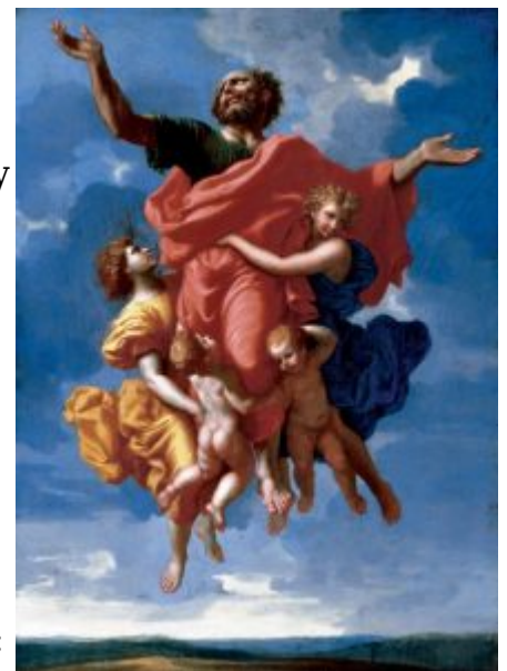
Экстаз св. Павла, 1643, Флорида

Конец 1640-х — начало 1650-х — один из плодотворных периодов в творчестве Пуссена: он написал картины «Элиазар и Ревекка», « Пейзаж с Диогеном », «Пейзаж с большой дорогой», «Суд Соломона», «Аркадские пастухи», второй автопортрет. Темами его картин этого периода были