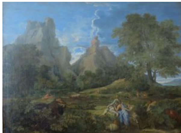
«Пейзаж с Полифемом», 1649, Эрмитаж

с литературными, мифологическими сюжетами: «Пейзаж с Полифемом» (Москва, ГМИИ им. А. С. Пушкина). Но их фигуры мифических героев малы и почти незаметны среди огромных гор, облаков и деревьев. Персонажи античной мифологии выступают здесь как символ одухотворённости мира. Ту же идею выражает и композиция пейзажа — простая, логичная, упорядоченная. В картинах чётко отделены пространственные планы: первый план — равнина, второй — гигантские деревья, третий — горы, небо или морская гладь. Разделение на планы подчёркивалось и цветом. Так появилась система, названная позднее «пейзажной трёхцветкой»: в живописи первого плана преобладают жёлтый и коричневый цвета, на втором — тёплые и зелёный, на третьем — холодные, и прежде всего голубой. Но художник был убеждён, что цвет — это лишь средство для создания объёма и глубокого