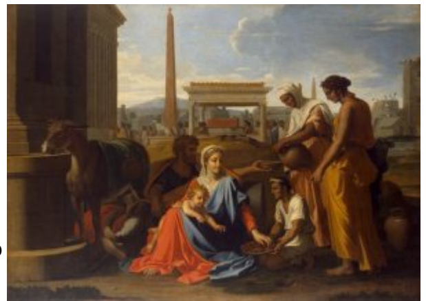
Святое Семейство в Египте. 1655-1657 гг. Холст, масло

В псевдоевангелии Матфея говорится о чудесном утолении жажды и насыщении Святого семейства на пути в Египет. Обычно Святое семейство изображалось в окружении ангелов, приносящих плоды и цветы. Пуссен перенес место действия на площадь египетского города, а вместо ангелов изобразил простых египтян: юношу и