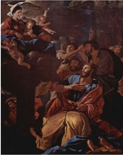
Мадонна, являющаяся св. Иакову Старшему, 1629, Лувр

После нескольких неудачных попыток Пуссен сумел наконец добраться до Италии. На некоторое время он задержался в Венеции. Затем, обогащенный художественными идеями венецианцев, прибыл в Рим.