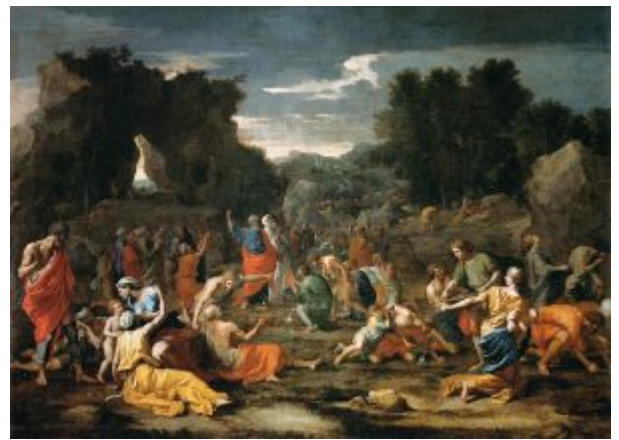
Манна небесная, 1638, Лувр

Шамбре (1606—1676), которым поручает всячески способствовать возвращению Никола Пуссена из Италии в Париж. Для Флеара де Шантлу художник исполняет картину «Манна небесная» , которую впоследствии (1661) приобретёт король для своей коллекции.