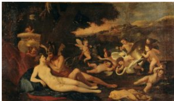
Марс и Венера, 1624-1625, Лувр

Наши музеи обладают прекрасными образцами этого первого и особенно привлекательного периода творчества великого мастера («Танкред и Эрминия» «Ринальдо и Армида»). В своих картинах Пуссен стремился к уравновешенности и разумности композиции, выверял расположение фигур на холсте, подобно тому, как геометр рассчитывает чертежи. Но его произведения не превращались в рассудочные схемы благодаря радостным, светлым краскам, четкости и изяществу рисунка, богатству мыслей и чувств.