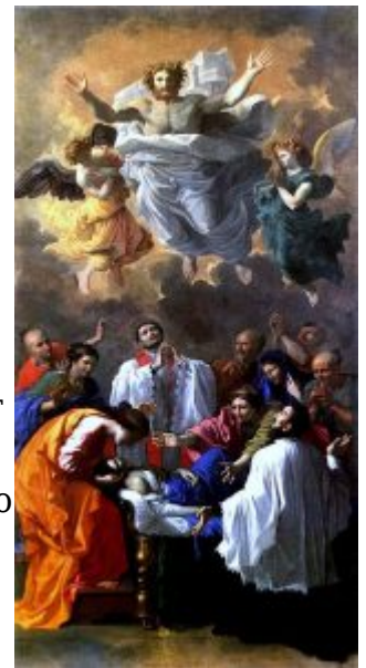
«Чудо св. Франциска Ксаверия» 1641, Лувр

В Париже Пуссен имел много заказов, но у него образовалась партия противников, в лице художников Вуэ, Брекьера и Филиппа Мерсье, ранее его трудившихся над украшением Лувра. Особенно сильно интриговала против него пользовавшаяся покровительством королевы школа Вуэ.