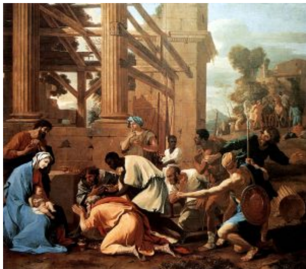
Поклонение волхвов, 1633, Дрезден

Идеей Порядка проникнуто все творчество французского мастера. Теоретические положения, выдвинутые зрелым мастером, объективно соответствуют его художественной практике ранних лет и в значительной мере являются ее обобщением.