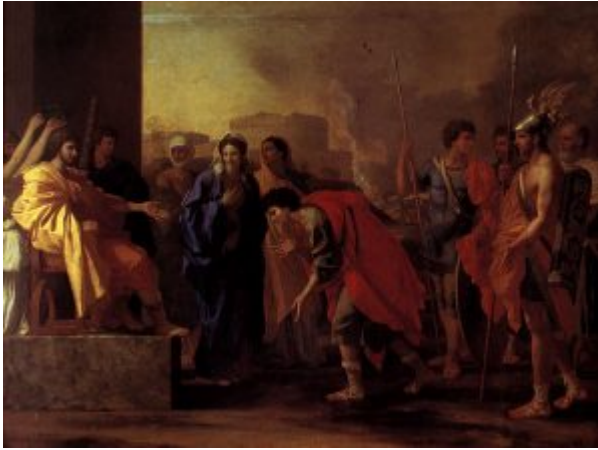
«Великодушие Сципиона» (ГМИИ)

В сентябре 1642 года Пуссен уезжает из Парижа, удаляясь от интриг королевского двора, с обещанием вернуться. Но смерть кардинала Ришельё (4 декабря 1642) и последовавшая кончина Людовика XIII (14 мая 1643) позволили живописцу остаться в Риме навсегда.