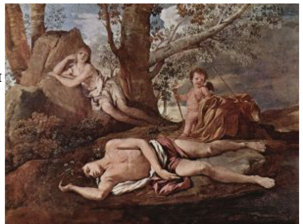
«Нарцисс и Эхо» (ок. 1629, Париж, Лувр

мужеству и сохранению достоинства перед лицом смерти. Размышления о смерти занимали важное место в его творчестве. Мысль о бренности человека и проблемы жизни и смерти легли в основу раннего варианта картины «Аркадские пастухи» , около 1629—1630, (собрание герцога Девонширского, Чатсуорт), к которой он вернулся в 50-е (1650, Париж, Лувр). По сюжету картины, жители Аркадии, где царят радость и покой, обнаруживают надгробие с надписью: «И я в Аркадии». Это сама Смерть обращается к героям и разрушает их безмятежное настроение, заставляя задуматься о неизбежных грядущих страданиях. Одна из женщин кладёт руку на плечо своего соседа, она словно пытается помочь ему примириться с мыслью о