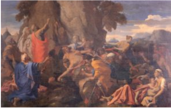
Моисей, иссекающий воду из скалы. 1649г. Холст, масло

Пуссен не ограничился изображением свершившегося чуда, но одновременно попытался представить трагедию, пережитую беглецами в пустыне. Он делит композицию на три части, выделяя наиболее существенные для повествования моменты. Справа показаны люди, гибнущие от жажды в отчаянии и муках; здесь женщины, дети, старики, то есть те, кому труднее всего перенести обрушившиеся на них невзгоды. В центре мужи и воины; воспрянув духом, они стремительно бросаются к источнику, черпая воду чашами, кувшинами и даже шлемами. Здесь напряжение достигает кульминации. Наконец, в левой части картины мы видим Моисея и израильских старейшин, воздающих Богу хвалу за ниспосланное им чудесное избавление от гибели.