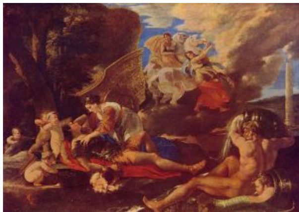
Ринальдо и Армида, 1625-1627, ГМИИ