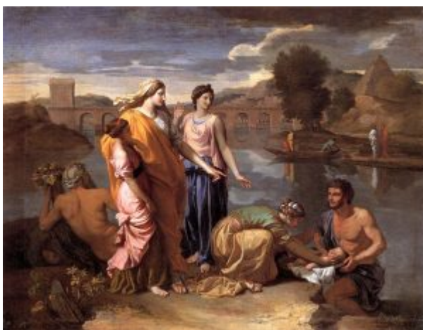
Спасение Моисея, 1638, Лувр

ранний период творчества. (Это обстоятельство, как правило, мало учитывается пуссеноведами.) Наконец, под непосредственным руководством Марино молодой Пуссен занимается «переводом» поэтических образов на язык визуального искусства, иллюстрируя «Метаморфозы» Овидия.