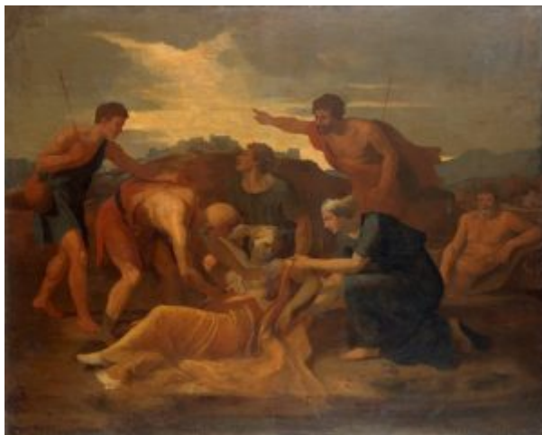
Спасение Зенобии. 1640-е г. Картина не закончена. Холст, масло