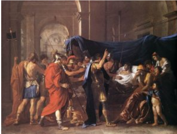
Смерть Германика, 1626-1628, Миннеаполис

В 1627 году Пуссен написал картину «Смерть Германика» по сюжету древнеримского историка Тацита, которая считается программным произведением классицизма; в ней показывается прощание легионеров с умирающим полководцем. Гибель героя воспринимается как трагедия общественного значения. Тема интерпретирована в духе спокойной и суровой героики античного повествования. Идея картины — служение долгу. Художник расположил фигуры и предметы в неглубоком пространстве, расчленив его на ряд планов. В этом произведении выявились основные черты классицизма: ясность действия, архитектурность, стройность композиции, противопоставление группировок. Идеал красоты в глазах Пуссена состоял в соразмерности частей целого, во внешней упорядоченности, гармонии, ясности композиции, что станет характерными чертами зрелого стиля мастера. Одной из особенностей творческого метода Пуссена был рационализм, сказывавшийся не только в сюжетах, но и в продуманности композиции. В это время Пуссен создаёт станковые картины главным образом среднего размера, но высокого гражданского звучания,