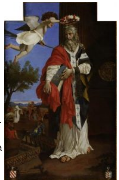
Св. Дени Ареопаг 1620-1621

К этой схематичной характеристике творческой личности следует добавить очевидное равнодушие к почестям и