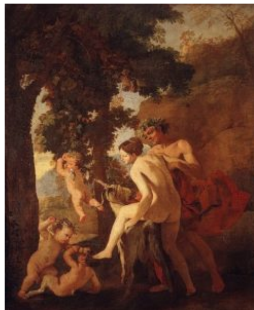
Венера, Фавн и путти. Нач. 1630-х г. Холст, масло