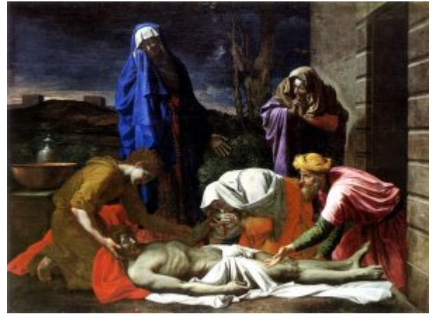
Оплакивание Христа, 1657-1658, Дублин

Высшие достижения классицизма в живописи связаны с творчеством Никола Пуссена. Именно он, показав возможности этого стиля в своих совершенных произведениях, обеспечил его торжество в дальнейшем развитии живописи и господство Франции среди других европейских школ в последующие периоды.