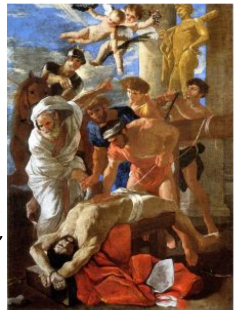
Мучения св. Эразма,

В 1628—1629 годах живописец трудится для главного храма католической церкви — собора Святого Петра; ему