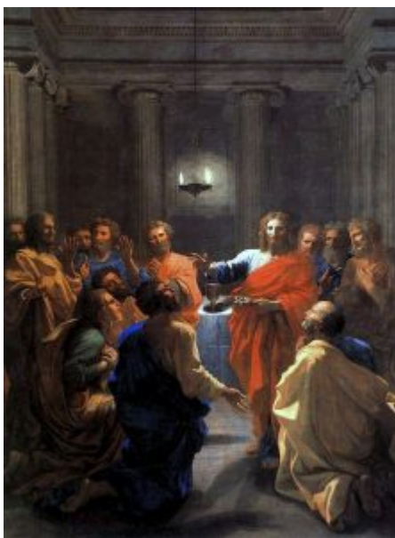
«Евхаристия» для алтаря

Через несколько месяцев Пуссен всё же принял королевское предложение — « nolens volens », и приехал в Париж в декабре 1640 года. Пуссен получил статус первого королевского художника и, соответственно, общее руководство возведением королевских строений, — к сильному неудовольствию придворного живописца Симона Вуэ.