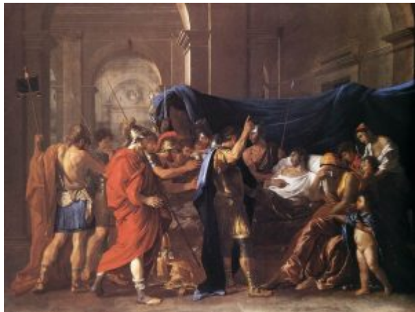
Смерть Германика, 1626-1628, Миннеаполис

«Смерть Германика» (Миннеаполис, Институт искусств) строится подобно античному барельефу. Очень четко организовано движение группы воинов, слева направо подступающих к ложу умирающего полководца, строгому ритму подчинена их сдержанная жестикация. Характерно профильное изображение большинства фигур. Слово вычерчены вертикали высокого интерьера. Античный Рим воскресает в композиции Пуссена.