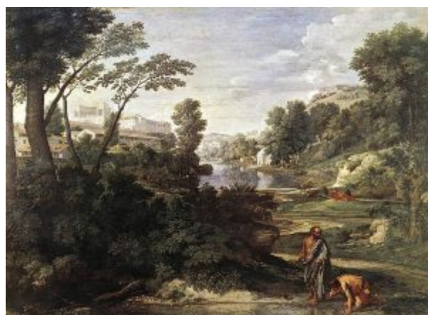
«Пейзаж с Диогеном», 1648, Лувр

таинств», в которой раскрыл глубокое философское значение христианских догм: «Пейзаж с апостолом Матфеем», «Пейзаж с апостолом Иоанном на острове Патмосе» (Чикаго, Институт искусств). В 1643 году он рисует для Шантлу « Экстаз св. Павла » (1643, Le Ravissement de saint Paul ), сильно напоминающий картину Рафаэля «Видение пророка Иезекииля».