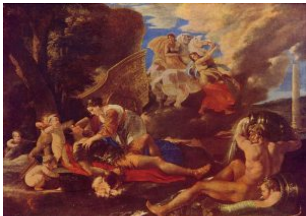
Ринальдо и Арמידа, 1625-1627, ГМИИ

закономерной для художника XVII века — столетия расцвета театра. Картина раскрывает важную для мастера мысль: герои, страдавшие и безвременно погибшие на земле, обрели покой и радость в волшебном саду Флоры, то есть из смерти возрождается новая жизнь, круговорот природы. Вскоре был написан еще один вариант этой картины — «Триумф Флоры» (1631, Париж, Лувр).