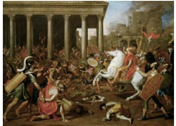
Разрушение Иерусалима, 1636-1638, Вена

зачинателем барочной поэзии в Италии, который прибыл в Париж по приглашению Маргариты де Валуа и был милостиво принят при дворе Марии Медичи. Проведя в Париже восемь лет, Марино стал, по выражению И. Н. Голенищева-Кутузова, «как бы звеном, связывающим итальянскую культуру с французской»; его влияния не избежал даже столп классицизма Малерб. И напрасно некоторые исследователи третируют поэта как якобы манерного и неглубокого в своем творчестве: достаточно даже беглого знакомства с поэзией Марино, чтобы оценить блеск его дарования. В действительном влиянии поэта на молодого Пуссена, по крайней мере, сомневаться не приходится. Отличавшийся широчайшей эрудицией, Марино развернул перед живописцем прекрасные страницы древней и новой литературы, укрепил его страстное влечение к искусству античности и помог реализовать мечту об Италии. Барочная ориентация поэта, его идеи взаимосвязанности искусств (прежде всего живописи, поэзии и музыки), его сенсуализм и пантеизм не могли не сказаться на формировании эстетических взглядов Пуссена, что, возможно, и повлекло за собой тот интерес к искусству барокко, который сопутствует развитию Пуссена в