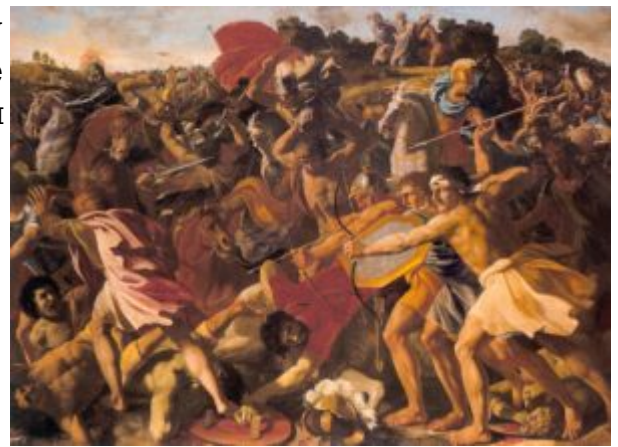
Битва израильтян с амалекитянами. Ок. 1624-1625 гг.

находится в ГМИИ. Моисей приказывает Иисусу Навину сражаться, а сам становится на вершине холма и молится за его победу: «И когда Моисей поднимал руки свои, одолевал Израиль, а когда опускал руки свои, одолевал Амалик; но руки Моисеевы отяжелели, и тогда взяли камень и подложили под него, и он сел на нем, Аарон же и Ор поддерживали руки его?». Это и решило исход битвы в пользу израильтян. В обеих картинах ощущается влияние фресок Лоджий Рафаэля в Ватикане, познакомиться с которыми Пуссен мог еще в Париже по уже существовавшим тогда гравюрам и эстампам. В основу композиции легли зарисовки, сделанные Пуссеном с рельефов римских саркофагов. Художника захватила возможность показать на полотне бурное движение воинов, столкнувшихся в жестоком и долгом поединке, передать стихию битвы, ее динамику.