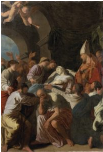
Смерть Девы Марии, 1623

склонность к уединению. Буквально все в биографии Пуссена свидетельствует о том, что так хорошо выразил Декарт в своем известном признании: «Я всегда буду считать себя благодетельствованным более теми, по милости которых я беспрепятственно смогу пользоваться своим досугом, нежели теми, кто предложил бы мне самые почетные должности на земле».