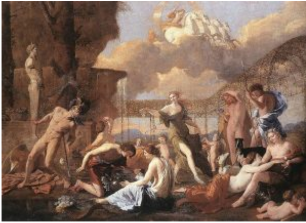
Царство Флоры, 1631

В картине аллегорически соединены герои «Метаморфоз» Овидия, которые после своей смерти были превращены в цветы. Над ними властвуют три божества, связанные с весной – Флора, Приап и Аполлон, правящий квадригой Солнца.