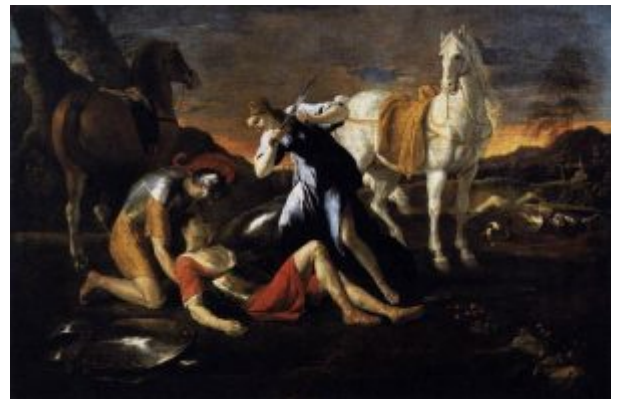
«Танкред и Эрминия» (Эрмитаж)

произведениями он воспитывал совершенную личность, показывая и воспевая примеры высокой морали, гражданской доблести. Ясность, постоянство и упорядоченность изобразительных приемов Пуссена, идейная и моральная направленность его искусства позже сделало его творчество эталоном для Академии живописи и скульптуры Франции, которая занялась выработкой эстетических норм, формальных канонов и общеобязательных правил художественного творчества (так называемый «академизм»).