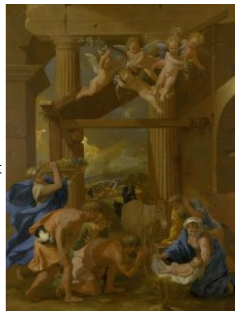
Поклонение пастухов, 1633

разве это свидетельствует о том, что я создавал ее с большей любовью, нежели ваши? Разве вы не видите ясно, что причиной этого впечатления являются самый характер сюжета, и ваше расположение, и то, что сюжеты, которые я пишу для вас, должны быть представлены в другой манере? В этом заключается все мастерство живописи. Простите мою смелость, если я скажу, что вы показали себя слишком поспешным в своих суждениях о моих работах. Правильно судить очень трудно, если не обладаешь большим знанием теории и практики этого искусства в их сочетании. Не только вкус наш должен быть судьей, но и разум.