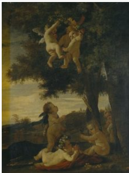
Амуры и гении. 1630-1633гг. Холст, масло

Основой решения сцены является мотив встречи Марии и Елизаветы и их младенцев. По сравнению с полотном «Святое семейство со св. Иоанном Крестителем» (Музей Джона и Мейбл Ринглинг, Сарасота), выполненным чуть ранее, картина поражает бóльшей уравновешенностью и величием. Крупные тяжеловесные фигуры заполняют здесь всю поверхность холста, почти не оставляя места пространству и фону.