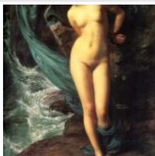
Пойнтер, Эдвард Джон. Андромеда 1869