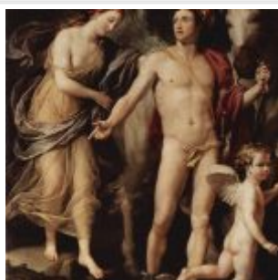
Менгс, Антон Рафаэль. Персей и Андромеда 1770-1776