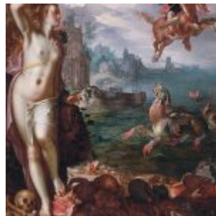
Юттеваль, Иоахим. Персей и Андромеда