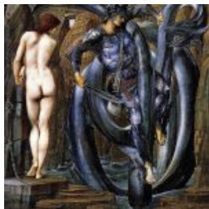
Бёрн-Джонс, Эдвард. Персей и Андромеда