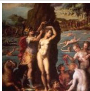
Джорджо Вазари, Персей и Андромеда, 1570, Флоренция