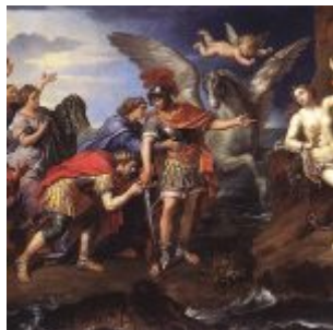
Пьер Миньяр. Отец Андромеды благодарит Персея за спасение дочери