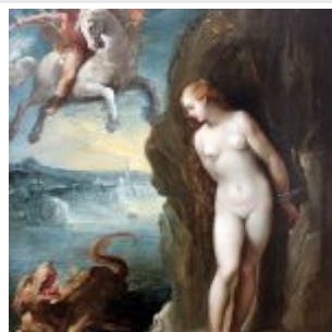
Чезари, Джузеппе. Персей спасает Андромеду