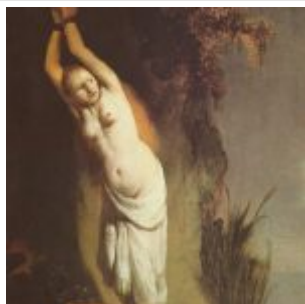
Рембрандт, Харменс ван Рейн. Андромеда, прикованная к скале, ок 1630