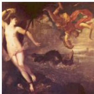
Тициан. Персей и Андромеда 1553-1559