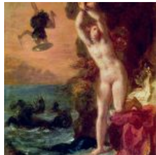
Эжен Делакруа. Андромеда