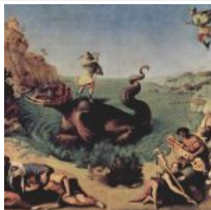
Пьеро ди Козимо. Персей, освобождающий Андромеду, ок 1513