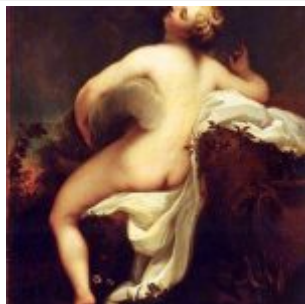
Корреджо. Ио и Юпитер. Чтобы овладеть прекрасной девушкой, Зевс превращается в облако.