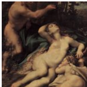
Корреджо. Юпитер и Антиопа. Зевс соблазнил её в облике сатира. Забеременев от Зевса, бежала из Фив в Сикион, где стала женой Эпопея.