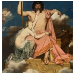
«Юпитер и Фетида» («Jupiter et Thétis»), художник Жан Энгр, 1811 год, масло, 330×257 см. Бывшая возлюбленная умоляет небожителя пощадить её сына Ахилла. Она обнимает колени владыки, сидящего на троне. Сюжет описан у Гомера.