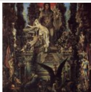
Моро, Гюстав. Юпитер и Семела 1894-1895. Семела — четвёртая дочь мифического основателя Фив Кадма и Гармонии, мать Диониса, которого она зачала от самого Зевса. Гера, божественная супруга Зевса, в гневе на соперницу решила погубить Семелу. Приняв на себя облик Берио, кормилицы Семелы, она внушила ей желание убедиться воочию, что её возлюбленный — действительно то божество, за какое выдаёт себя, а для этого просит Зевса явиться ей во всем блеске своего величия, с громом и молниями. Вынужденный клятвой исполнить просьбу Семелы, Зевс предстал