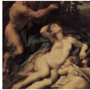
Корреджо. Юпитер и Антиопа. Зевс соблазнил её в облике сатира. Забеременев от Зевса, бежала из Фив в Сикион, где стала женой Эпопея.