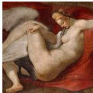
Микеланджело. Леда и лебедь. Чтобы овладеть недоступной красавицей, Зевс обратился в прекрасного лебедя, которому она дала приблизиться к себе и стала с ним играть. Она родила от него Полидевка и Елену