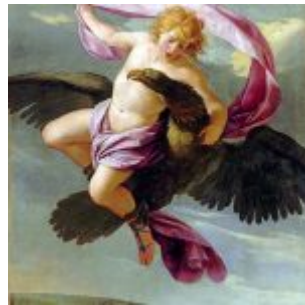
Лесюёр Эсташ. Юпитер и Ганимед. 1644. Из-за своей необыкновенной красоты Ганимед был похищен Зевсом — перенесён орлом Зевса на Олимп (либо Зевс сам превратился в орла)