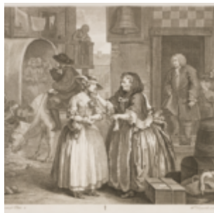
Гравюра 1: В ловушке сводницы