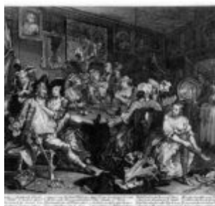
Гравюра 3: в таверне