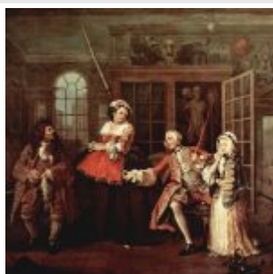
Визит к шарлатану. 1743—45