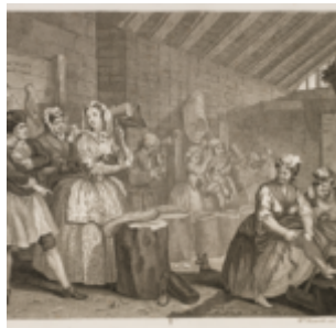
Гравюра 4: В тюрьме Брайдвелл