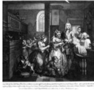
Гравюра 5: женитьба на старой деве