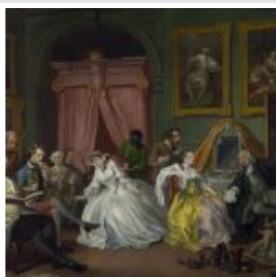
Будуар графини. 1743—45