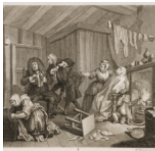
Гравюра 5: Смерть от сифилиса