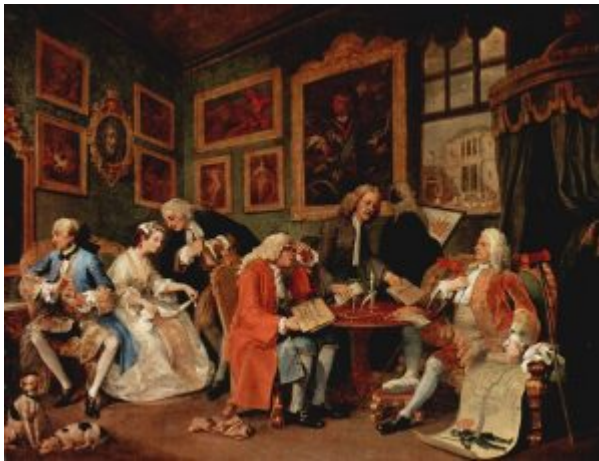
Брачный контракт. 1743—45

«Модный брак» повествует о браке по расчету между сыном разорившегося аристократа и дочерью богатого торговца, ставшем причиной несчастий обоих. Сюжетом послужили как примеры из жизни высшего общества, так и комедия Драйдена под таким же названием, в которой играл знаменитый актер Гаррик.