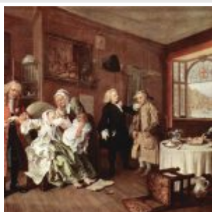
Смерть графини. 1743—45