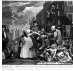
Гравюра 4: арест за долги