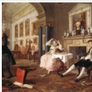
Вскоре после свадьбы. 1743—45