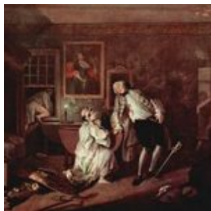
Дуэль и смерть графа. 1743—45