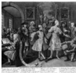
Гравюра 2: В окружении художников и преподавателей