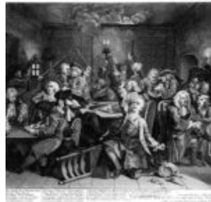
Гравюра 6: азартные игры