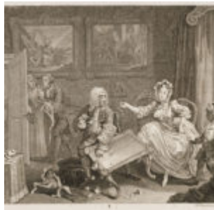
Гравюра 2: Любовница богатого купца