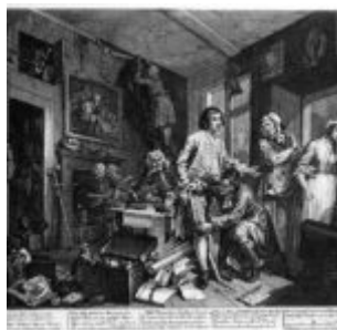
Гравюра 1: молодой наследник вступает во владение наследством