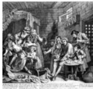
Гравюра 7: в тюрьме