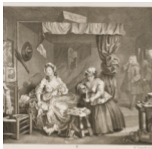
Гравюра 3: Уход в обычные проститутки