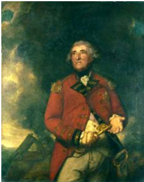
Генерал Джордж Эллиот, Лорд Хетфилд Гибралтарский. 1787. Лондонская национальная галерея.

Рейнольдс получил классическое образование, предполагавшее хорошее знание латыни и античной литературы. Это привило ему любовь и интерес к искусству слова, который он сохранил на всю жизнь. Впоследствии среди его друзей много современных ему писателей. С 1740 по 1744 гг. он обучается живописи в Лондоне у портретиста Томаса Хадсона. В это же время Рейнольдс изучает живописный стиль Антониса Ван Дейка, фламандского живописца и портретиста, придворного художника, и это оказывает решающее влияние на формирование его собственной живописной манеры. В конце 40-х годов на два года уезжает в Рим, где продолжается совершенствование его мастерства, за счет знакомства с итальянской живописью и зарисовок античных статуй. Кроме Рима посещает Флоренцию, Болонью и Венецию. Венецианская школа и полотна Тициана, Тинторетто, Веронезе сыграли заметную роль в обогащении его колорита.