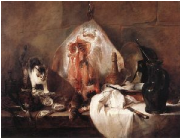
Скат (фр. La raie), 1728, Лувр

Жан-Батист-Симеон Шарден (1679-1779), один из величайших художников XVIII века, родился в Париже в семье ремесленника. О раннем периоде его творчества почти не сохранилось сведений. Известно, что в 1724 г. он вступает в Академию св. Луки. В 1728 г. он был принят в Королевскую Академию живописи и скульптуры весьма необычным путем -