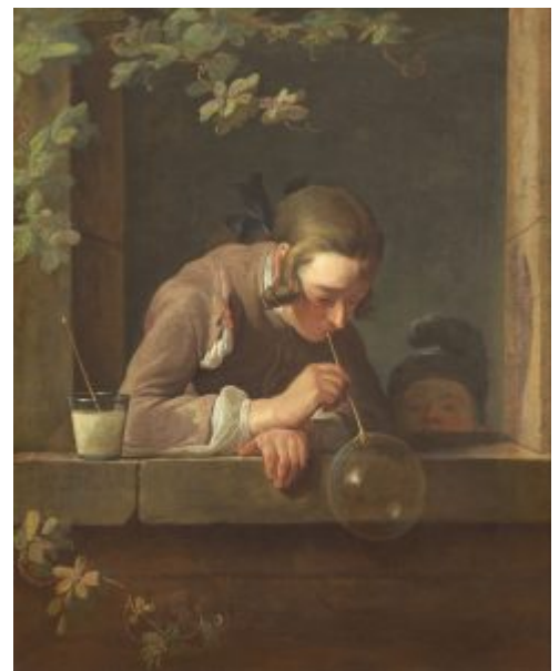
«Мыльные пузыри» (1733-1734, Национальная галерея искусства)

Строгости построения композиции, в которой нет ничего лишнего, соответствует и лишенный внешних эффектов, почти монохромный колорит. Но, оставаясь почти исключительно в пределах коричнево-охристой цветовой гаммы, художник насыщает холст неожиданным живописным богатством разнообразных