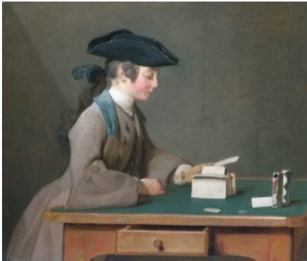
Карточный домик. Около 1736—1737. Национальная галерея, Лондон