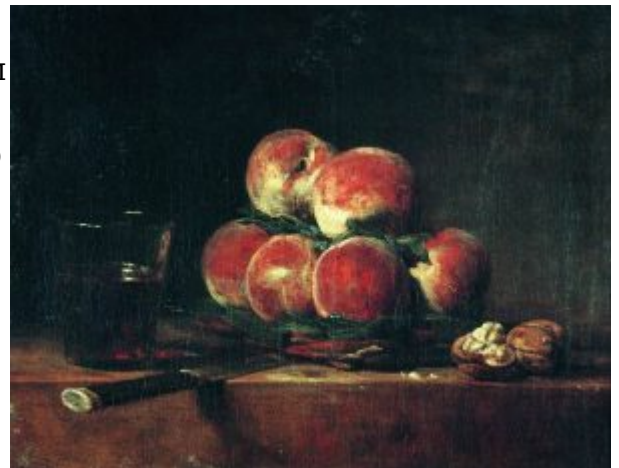
Корзина с персиками, 1768, Лувр

что он был лучшим мастером натюрморта и не только для своего времени, а его жанровые сцены полны поэзии, лиризма и жизненной правды. Вместе с тем, открывается и совершенное качество его живописной техники, которого он добивался в процессе медленной, мучительной, тщательной работы и переделок. Тайну своего великого мастерства художник открыл сам, сказав однажды: «Мы используем краски, но пишем чувствами».