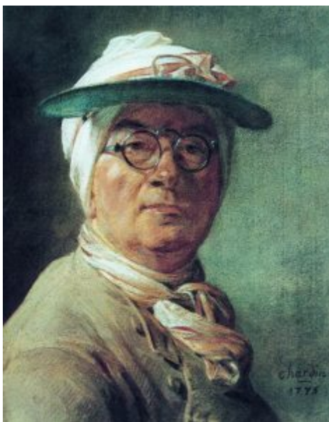
Автопортрет с зеленым козырьком, 1775, Лувр