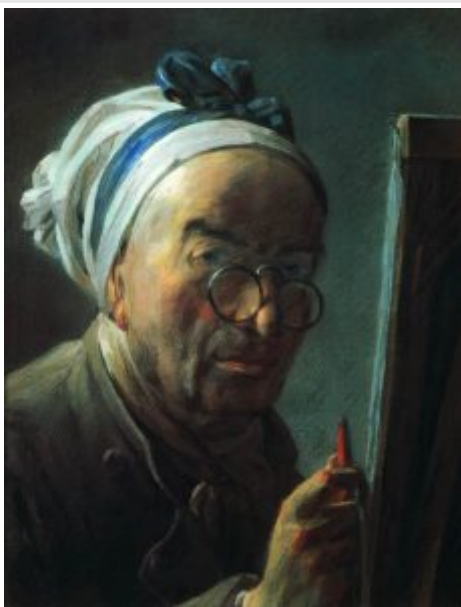
Автопортрет с мольбертом, 1779, Лувр