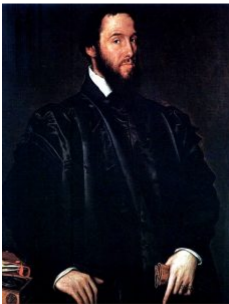
Антонис Мор. Портрет кардинала Гранвеллы. 1549. Масло, дерево. 107 x 82 см.

Другим воспитанником Я. ван Скорела был прославленный портретист XVI в. Антонис Мор ван Дасхорт (1516/20-1576), уроженец Утрехта. В 1547-1549 гг. он посетил Италию; в 1550-1553 он был послан Карлом V к