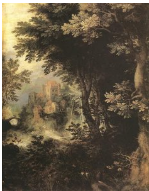
Конинксло. Пейзаж. Масло, медь. 24 x 19 см. Прадо. Мадрид

В заключение следует отметить ту благотворную роль, которую сыграли в художественном развитии нидерландского Севера конца XVI в. живописцы-южане, устремившиеся туда в поисках безопасности от военных невзгод, иногда - и от религиозных гонений. Так, пейзажная живопись Северных Нидерландов на рубеже XVI-XVII вв.: с центрами в Амстердаме, Утрехте и Харлеме - развивалась при активном влиянии Юга. Здесь особую роль сыграл Гиллис ван Конинксло (1544-1607). Будучи кальвинистом, в 1585 г. он покинул Антверпен, сдавшийся на милость испанскому наместнику принцу Алессандро Фарнезе, и возглавлял своеобразный кружок южнонидерландских пейзажистов, подобно ему, эмигрантов - в 1587-1594 гг. в пфальцском городе Франкенталь, а с 1595 г. - в Амстердаме. Ван Конинксло отдавал особое предпочтение лесным видам. Он пережил