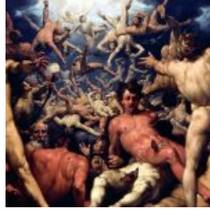
Корнелиссен. Падение титанов. 1588. Масло, холст. 239 х 307 см. Государственный музей искусств. Копенгаген

На протяжении двух столетий Нидерланды, где, по словам Й. Хёйзинги, «Из всех стран Запада... жизнь была ключом наиболее щедро», были всеевропейским художественным центром. Уже к началу XVI в. влияние нидерландской школы распространилось от Португалии до Прибалтики. Энциклопедическая широта мировидения, глубокая человечность и высокий технический уровень - те родовые черты живописи Старых Нидерландов, которые и сегодня обеспечивают ей благодарное внимание во всём мире.