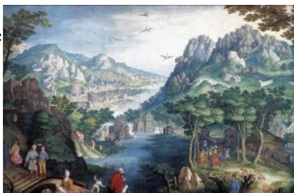
Конинксло. Пейзаж с пророком Осией. Акварель, пергамент. 19,5 x 28,7 см. Музей Майер ван ден Берг. Антверпен

определённую эволюцию, начав с традиционной схемы «мирового ландшафта» ( «Пейзаж с пророком Осией» , Антверпен, Музей Майер ван ден Берг), позднее художник сосредотачивает внимание на фрагментарных пейзажных видах,