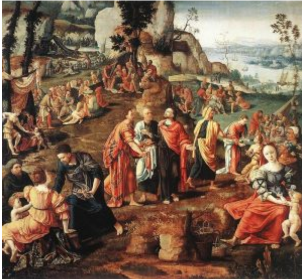
Ламберт Ломбард. «Чудо умножения хлебов» (Антверпен, Дом Рококса)

В сравнении с итальянизмом начала XVI в., когда Ян Госсарт скорее переводил античные образы на язык северной живописи с присущими ей почвенным реализмом и интересом к индивидуальным частностям – сейчас ценится буквальное подражание антично-ренессансным образцам. Эта тенденция заметна уже в творчестве последователя Госсарта льежского художника Ламберта Ломбарда (1505-1566), в 1537-1539 гг. побывавшего в Риме. В картине «Чудо умножения хлебов» (Антверпен, Дом Рококса) Ламберт выступает как добросовестный последователь чисто римского пластицизма: все линии тщательно выверены, сдержанно-величавые фигуры образуют правильные диагональные ряды (подобно ленточным рельефам на древнеримских триумфальных колоннах) – среди столь же ясного чередования пейзажных планов. Путём освоения античного наследия для нидерландских художников середины/второй половины XVI в. был международный маньеризм – стилевое направление, охватившее в эти годы, помимо Нидерландов и Италии, Францию (школа Фонтенбло), Испанию и центральную Европу (двор императора Рудольфа II в Праге).