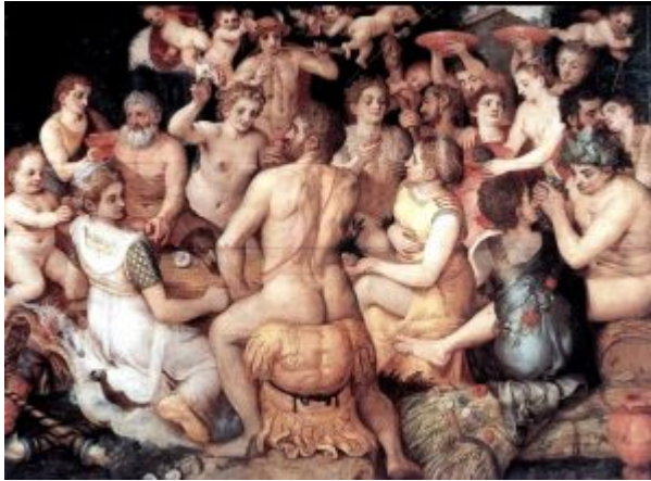
«Пир богов», 1550, Антверпен, Королевский музей изобразительных искусств

Вернувшись в Антверпен, Флорис становится преуспевающим мастером (во многих чертах предвосхищая судьбу Рубенса): в 1549 г. он руководит украшением города по случаю приезда императора Карла V; совместно с братом-архитектором Корнелисом Флорисом он строит себе дом-дворец в итальянском стиле и украшает его собственными фресками. В числе его многочисленных почитателей - финансист Николас Йонгелинк, делавший заказы и Питеру Брейгелю Старшему. Современники величают Франса Флориса «фламандским Рафаэлем». Художник пользовался покровительством лидеров нидерландского оппозиционного дворянства графов Л. Эгмонта и Ф. Горна и, по преданию, скончался от потрясения при известии об их трагичной казни.