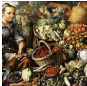
И. Бейкелар. «Торговка с фруктами, овощами и птицей» (1564, Кассель, Художественный музей)