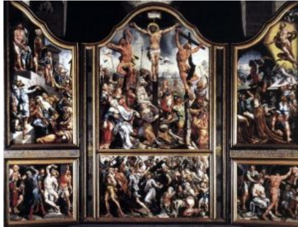
Мартен ван Хемскерк. Алтарь Страстей Господних. Масло, дерево. Линчепинг