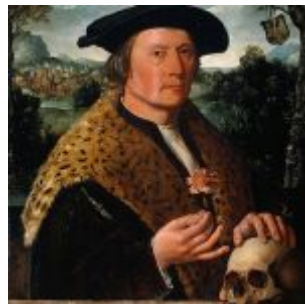
Дирк Якобс. Портрет Помпея Окко. Нидерланды, около 1531 г

Портрет оставался важной составляющей творчества всех нидерландских живописцев, особенно на Севере, где на живопись в большей степени смотрели как на прикладную часть бюргерского быта. Получает дальнейшее развитие и старонидерландская традиция семейного портрета: М. ван Хеемскерк, Портреты Питера Биккера и Анны Кодде (1520, Амстердам, Государственный музей) - и гуманистическая форма «триумфального» портрета на фоне пейзажа: Я. ван Скорел, «Портрет 32-летнего мужчины» (1521, Париж, Лувр); Дирк Якобс, «Портрет Помпея Окко» (1531 г., Амстердам, Государственный музей); М. ван Хеемскерк, «Автопортрет на фоне Колизея» (1553, Кембридж, Музей Фицвильям); порой обе названные концепции портрета соседствуют в одном произведении: М. ван Хеемскерк, «Семейный портрет» (1530, Кассель, Государственный музей).