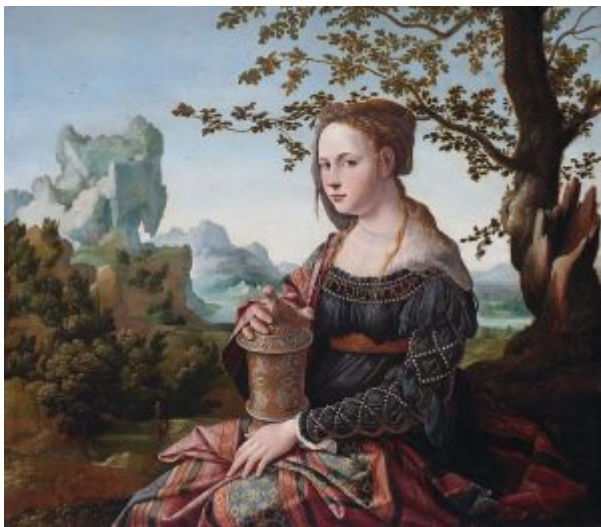
Мария Магдалина, ок. 1528, Амстердам, Государственный музей

Влияние искусства Италии приобретает значение и для Северных Нидерландов. Здесь пионером