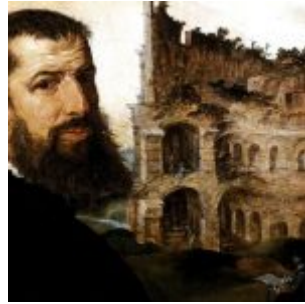
Хемскерк. Автопортрет на фоне Колизея. 1553. Масло, дерево. 42 х 54 см. Музей Фицуильям. Кембридж