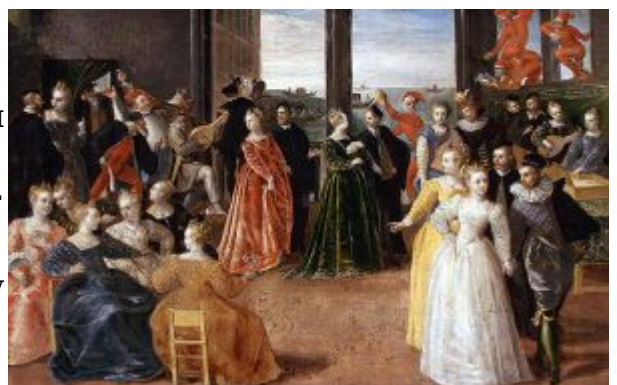
Иероним Франкен, «Венецианский карнавал» , 1565, Ахен, Музей

пейзажно й средой. Основным типом ландшафт а по-прежнему остаётся «мировой пейзаж», у истоков которого творчество о И.