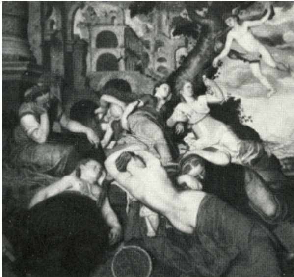
Лукас де Хеере (1534-1584) «Свободные искусства во время войны» (ок. 1567, Турин, Картинная галерея)

«Эпоха Брейгеля», 1560-е гг., была временем высочайшего расцвета нидерландской культуры и пиком экономического могущества Старых Нидерландов. Помимо гениального автора «Месяцев», эта эпоха оставила память о таких выдающихся мыслителях-гуманистах, как виднейший из последователей Эразма Дирк Фолькертсзон Корнхерт (1522-1590), который спорил с Кальвином, отстаивая изначальную свободу человеческого существа; об учёных-энциклопедистах – таких как друг Брейгеля Абрахам Ортелиус (1527-1598) или Герард Меркатор (1512-1594), основоположник современной картографии; о замечательных практиках просвещения – как антверпенский типограф Кристоф Плантен (ок. 1520-1589), впервые сделавший книгопечатание массовым производством.