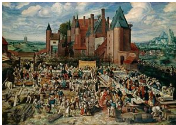
«Насыщение пяти тысяч» (Брауншвейг, Музей Антона Ульриха). 120,6 x 171,8 см, Inv. GG 165

Рука об руку с обмирщением этики и мировоззрения шло обмирщение изобразительного искусства, в котором символизм вытесняется натурализмом: позднесредневековое выражение Божественного присутствия в вещах оборачивается новым культом этих вещей в качестве самодовлеющей ценности. Симптомом этого кризиса выглядит некое «перераспределение ролей» в традиционной исторической живописи. Персонажи-статисты, архитектурно-пейзажные кулисы и случайные вещи вдруг оказываются в центре внимания художника.