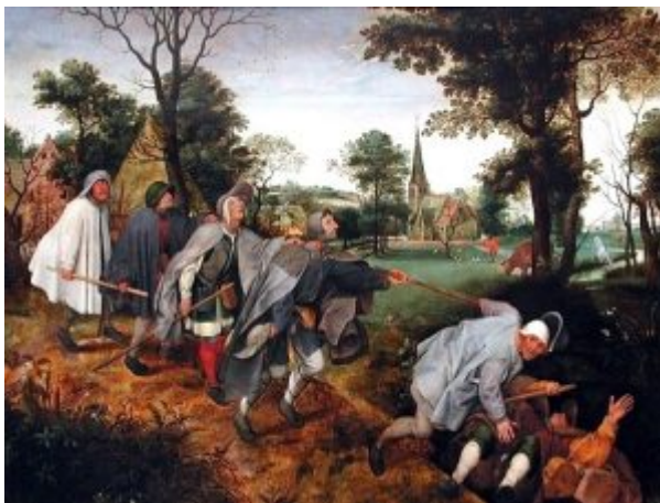
«Притча о слепцах» (ок. 1630, Париж, Лувр)

В течение 20 лет Флорис возглавлял колоссальную мастерскую - по свидетельству К. ван Мандера, у него обучалось в общей сложности 120 юношей. Будучи занят многочисленными заказами, мастер активно привлекал к своей работе учеников, вписывавших в его композиции фигуры по этюдам-образцам, разработанным им для этой цели. Творчество многочисленных учеников Флориса, всецело усвоивших его манеру, определяло дальнейшее развитие южннидерландской живописи вплоть до появления Рубенса. Среди школы Ф. Флориса особенно выделяются Мартен де Вос ван Монфорт (1532-1603), Антонис Блокладт (1532-1583), Франс Паурбюс (1545-1581); братья Иероним (1540-1610), Франс (1542-1616) и Амвросиус (1544-1618) Франкены.