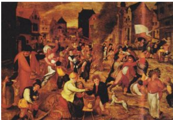
Мартен ван Клеве, «Праздник св. Мартина» , 1579, С.-Петербург, Эрмитаж

С наследием Брейгеля Мужицкого связан популярный в Нидерландах рубежа XVI-XVII вв. жанр кермес - картин с изображением народных гуляний - развлекательных, занимавших зрителя ( Мартен ван Клеве, «Праздник св. Мартина» , 1579, С.-Петербург, Эрмитаж ). То, что мы называем бытовой, жанровой живописью, становится массовым явлением нидерландского искусства именно в это время. Параллельно с