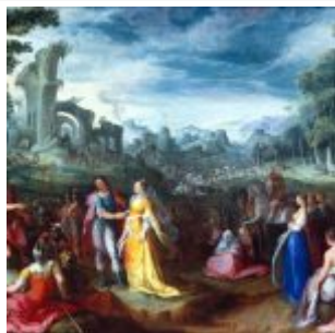
Ван Мандер. Умеренность Сципиона. 1600. 44 x 79 см. Масло, медь. Риксмусеум. Амстердам

В 1583 г. в Харлеме местный уроженец Корнелис Корнелиссен (1562-1638) вместе с приезжими Хендриком Гольтциусом (1558-1617) и Карелом ван Мандером (1548-1606) основали художественную академию. Харлемская академия, созданная по примеру современных ей итальянских, была не столько школой, сколько коллективной мастерской, где художники собирались для совместного штудирования антиков и обнажённой натуры; что, конечно же, было новым словом в художественной практике Нидерландов. Творчество «академиков» представляло международный маньеризм на довольно высоком уровне: К. Корнелиссен, « Падение титанов » (1588, Копенгаген, Государственный музей); Х. Гольтциус, « Венера и Адонис » (1614, Мюнхен, Пинакотека); К. ван Мандер, « Умеренность Сципиона » (1600, Амстердам, Государственный музей). В стенах Харлемской академии получил свои первые уроки ученик ван Мандера, будущий гений голландской школы Франс Халс.