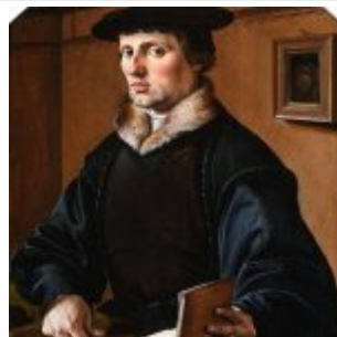
Хемскерк. Портрет Питера Герритса Бикера (1529)