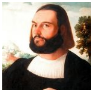
Скорел. Портрет 32-летнего мужчины. 1521. Масло, дерево. 43 x 51 см. Лувр. Париж