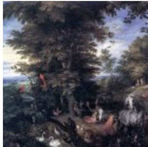
Я. Брейгель. Адам и Ева в Эдемском саду. 1610-е. Масло, медь. 48,6 x 65,6 см. Королевская коллекция. Виндзор

приметы наступаю щей эпохи «чистого пейзажа», картина природы из обрамлен ия или вместили ща историчес ких сцен превраща ется в самостоят ельный художеств енный образ.