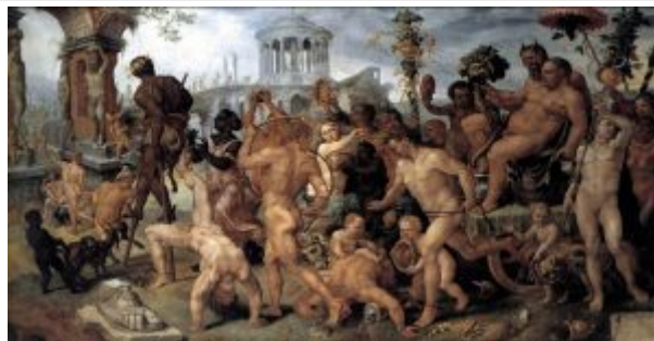
Мартен ван Хемскерк. Триумф Вакха. 1537-1538. Масло, дерево. 56 x 107 см. Художественно-исторический музей. Вена

Другим воспитанником Я. ван Скорела был прославленный портретист XVI в. Антонис Мор ван Дасхорт (1516/20-1576), уроженец Утрехта. В 1547-1549 гг. он посетил Италию; в 1550-1553 он был послан Карлом V к