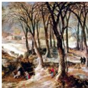
Йосс де Момпер. Зимний пейзаж. Около 1615-1625. Масло, дерево. 49 x 66 см. Картинная галерея. Дрезден