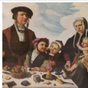
Хемскерк. Семейный портрет

Своеобразным выражением культуры нидерландского Севера стал, с её развитым коллективистским