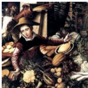
П. Артсен. Торговка в овощной лавке. 1567. Масло, дерево. 11 x 110 см. Государственные музеи. Берлин