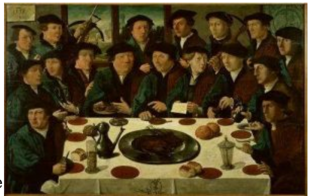
Корнелис Антонисц. Портрет амстердамской гильдии стрелков (1533, Амстердам, Государственный музей)

стрелков (1533, Амстердам, Государственный музей) передаёт уже лицо коллектива: при яркой индивидуальности каждого из портретируемых здесь появляется общее настроение тесной сплочённости боевых товарищей.