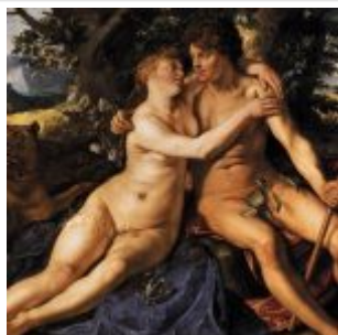
Гольтциус. Венера и Адонис. 1614. Масло, холст. 141 x 191 см. Старая Пинакотека. Мюнхен