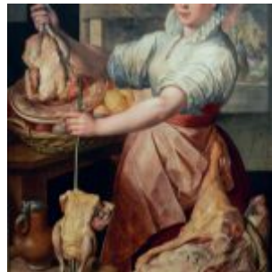
И. Бейкелар. «Кухарка» (1574, Вена, Художественно-исторический музей)

Мариу. 1552. Масло, дерево. 60 х 101,5 см. Художественно-исторический музей. Вена