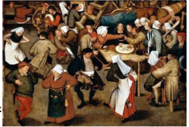
«Свадебный танец в амбаре» (ок. 1616, Частное собрание)

Старшего - в этом случае характерен его отход от монументальности поздних работ отца; расширение картинного пространства за счёт измельчания фигур - «Свадебный танец в амбаре» (ок. 1616, Частное собрание).