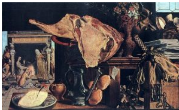
П. Артсен. Христос в доме Марфы и

« Христос в доме Марфы и Марии » (1552, Вена, Художественно-исторический музей) первый план неожиданно занимает кухонный буфет - снедь и утварь на нём по масштабам многократно превышают фигуры евангельских героев, изображённых в глубине картины. Сочные цвета и фактурное богатство предметов первого плана так же контрастируют с блёклостью красок и хрупкостью форм в сюжетной сцене. Позднее единственной темой