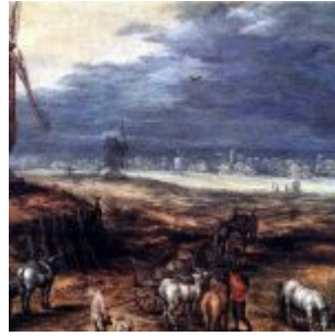
Я. Брейгель. Пейзаж с ветряными мельницами. Около 1607. Масло, дерево. 34 x 50 см. Прадо. Мадрид

Влияние искусства Италии приобретает значение и для Северных Нидерландов. Здесь пионером