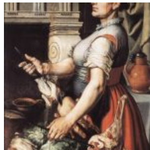
П. Артсен. Кухарка перед очагом. 1559. Масло, дерево. 172,5 х 82 см. Королевский музей изящных искусств. Брюссель