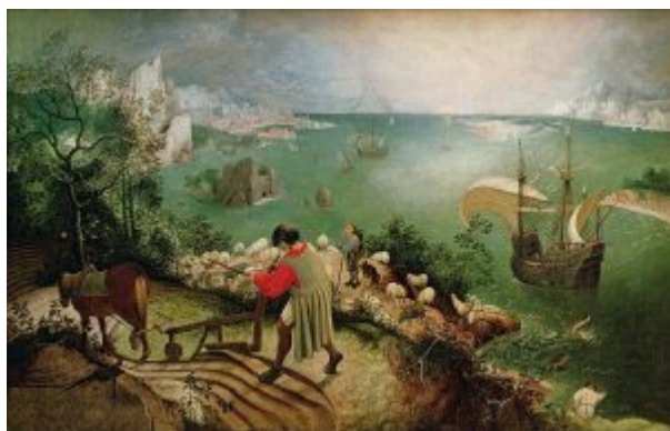
«Падение Икара» (Брюссель, Королевский музей изобразительных искусств)

«Падения...» - несомненное детище великого нидерландца - заслуживает особого рассмотрения.