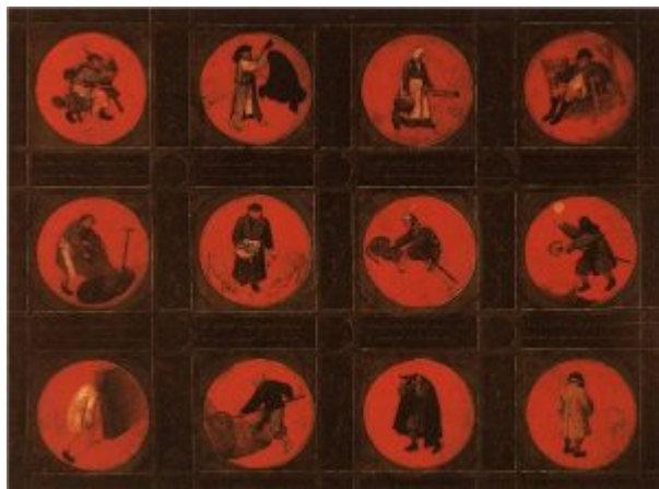
«Двенадцать пословиц» (Антверпен, Музей Майер ван дер Берг)

Нравоучительные композиции на темы нидерландского фольклора стали в XVI в. почвой для зарождения бытового жанра. Эта образность была популярна в печатной графике; Брейгель стал одним из её первопроходцев в живописном искусстве. В 1558 г. он написал декоративную композицию « Двенадцать пословиц » (Антверпен, Музей Майер ван дер Берг); в 1559 – знаменитую картину « Нидерландские пословицы » (Берлин, Государственные музеи).