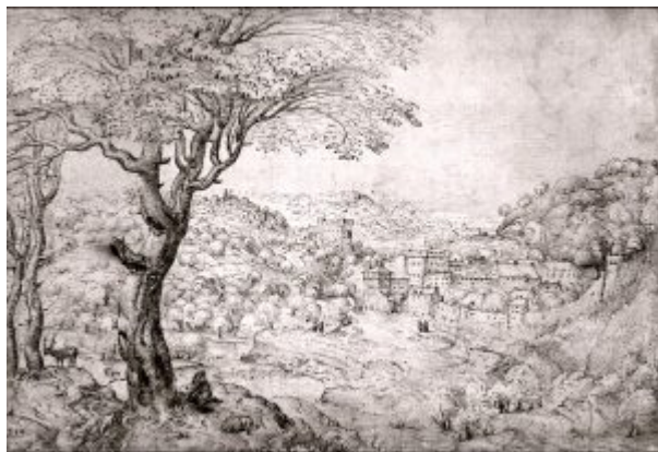
Пейзаж со святым Иеронимом. 1553. Перо, коричневая тушь. 23,5 x 33,8 см. Национальная галерея. Вашингтон.

Искусство старых Нидерландов (XIV — XVI вв.). 6. Питер Брейгель Старший. Навстречу Природе | 4 Иеронимом» (1553, Вашингтон, Национальная галерея)).