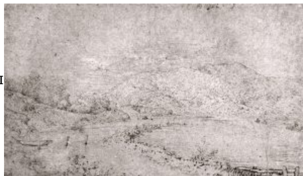
Речной пейзаж. 1552. Перо, коричневая тушь, голубая бумага. 17,6 x 26,4 см. Лувр, Кабинет рисунков. Париж.

морское плавание из Марселя в Неаполь; на обратном пути - горные дороги Швейцарии и Тироля. Особенно поразили уроженца брабантских (или лимбургских) просторов Альпы с их головокружительными перепадами высот и глубин - большую часть дорожных зарисовок Брейгель посвятил горам. Иные рисунки исполнены им по памяти, другие - с натуры, «Альпийский пейзаж с рисующим художником» (1553/54, Лондон, Собрание Сайлерн). Брейгель работает пером и тушью. Иногда он строго прорабатывает линию - явно думая о переводе экзотичного вида в гравюру ( «Альпийский пейзаж» , 1553, Париж, Лувр). Но намного чаще, пунктирными, «дышащими» штрихами (какими его учили наносить на грунт будущей картины подготовительный рисунок), Брейгель схватывал очертания дальних хребтов; извивы рек и дорог; плоскости склонов, уже одетых мягким ковром растительности: живой и трепетный лик Земли ( «Речной пейзаж» (1552, Париж, Лувр); «Пейзаж со св.