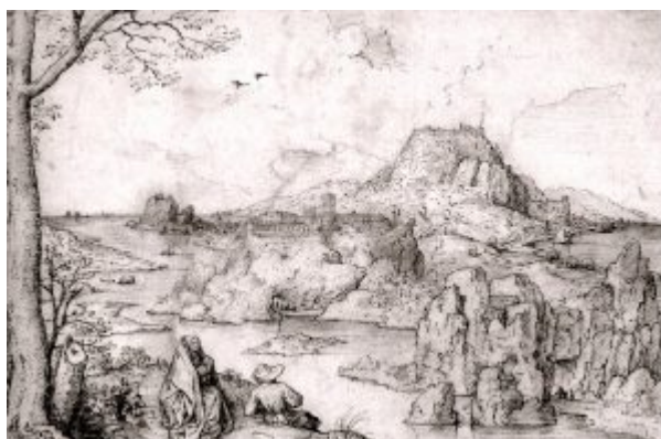
Речной итальянский пейзаж со Святым семейством. 1553-1554. Перо, коричневая тушь. 20,3 x 28,2 см. Гравюрный кабинет. Берлин.

стала для молодого художника периодом особой интеллектуальной активности; в Антверпене Брейгель постоянно общается с местными гуманистами: картографом А. Ортелиусом, религиозным мыслителем Д.Ф. Корнхертом, археологом и нумизматом Х. Гольциусом. В их среде излюбленными темами были смысл жизни, пути достижения подлинного счастья, свобода человека и её границы. Эти размышления, как и живые воспоминания итальянского путешествия, лежат в основе картины « Падение Икара » (Брюссель, Королевский музей изобразительных искусств). Хотя она, как и близкая ей по стилю картина « Вид Неаполя » (Рим, Галерея Дориа-Памфили), в последние годы считается старой копией с П. Брейгеля Старшего, сам живописный замысел