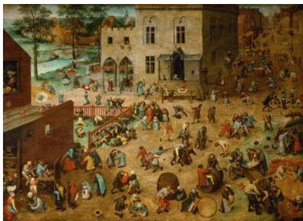
«Игры детей» (1560, Вена, Музей истории искусства)

Искусство старых Нидерландов (XIV — XVI вв.). 6. Питер Брейгель Старший. Навстречу Природе | 11 своих зрителей. Комедиантов не сразу отличишь от буднично спешащих по делам пешеходов. Повсюду – привычная жизнь: здесь моют окна, там движется крестный ход; кто-то торгует, кто-то гуляет, кто-то просит милостыню... В турнире Поста и Масленицы не видно перемен – всюду побеждает цельная стихия жизни, в которой веселье и нужда ходят рука об руку.