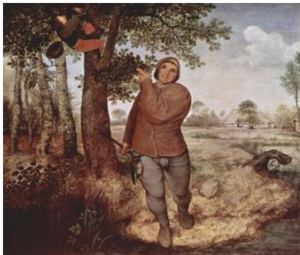
«Разоритель птичьих гнёзд» (Вена, Художественно-исторический музей)

Брейгель Старший. Навстречу Природе | 27 Пейзажный фон играет особую роль и в картине