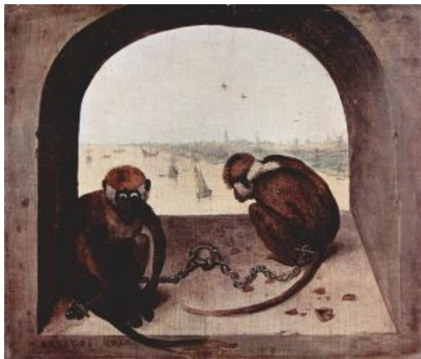
«Две обезьяны» (Берлин, Музей Далем

Искусство старых Нидерландов (XIV — XVI вв.). 6. Питер