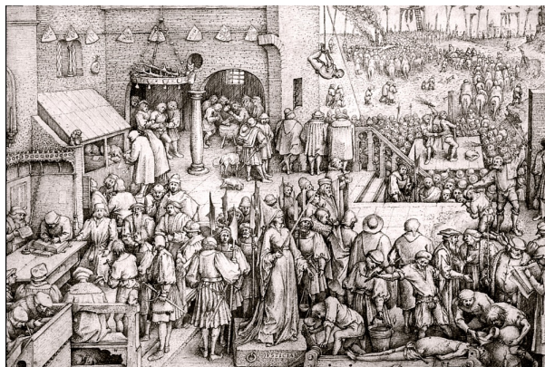
Justitia (Справедливость). Из серии «Семь добродетелей». 1559. Перо, коричневая тушь. 23,3 x 29,5 см. Королевская библиотека Альберта Первого. Брюссель.

сопутствуют сцены, привычные современникам Брейгеля. Добродетель Веры иллюстрируют изображения церковной проповеди, Крещения, венчания. Фон «Надежды» – всевозможные ситуации, в которых человеку служит опорой только надежда: шторм, пожар, темница. Фигуру Благоразумия окружают эпизоды сбора хвороста, засолки мяса; сцена у постели больного – и т.д. Итак, добродетель в представлении Брейгеля обыденна – так же, как для Босха, создателя «Семи смертных грехов» из музея Прадо, был обыден грех. Брейгель – явно более оптимистичный или, вернее, более приверженный земному миру художник.