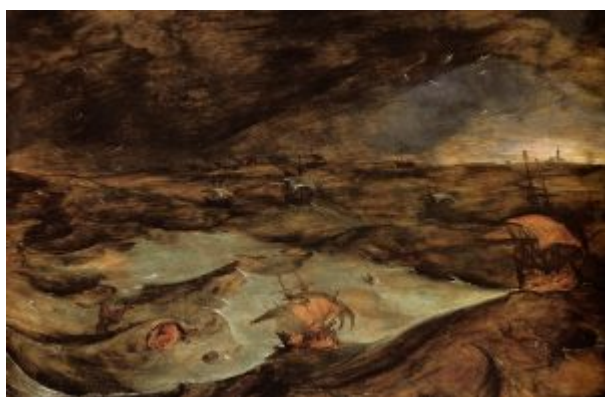
«Буря» (1568-70, Вена, Художественно-исторический музей)

Одна из последних картин Брейгеля - « Буря » (1568/70, Вена, Художественно-исторический музей). Сюжет её по-прежнему нравоучительный; его источник - басня о том, как моряки спасаются от кита: бросают ему