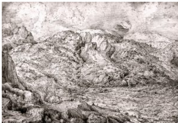
Альпийский пейзаж. 1553. Перо, коричневая тушь. 23,6 x 34,3 см. Лувр, Кабинет рисунков. Париж.

Согласно семейному преданию, Питер Брейгель обучался живописи в Антверпене у именитого живописца Питера Кукке ван Альста (1502-1550), ученика Б. ван Орлея; художника с широкими гуманистическими интересами. Ван Альст бывал в Риме и Константинополе (в 1553 г. напечатан альбом гравюр с его турецких зарисовок); издавал в Нидерландах труды классиков архитектуры Витрувия и С. Серлио; за год до смерти был назначен придворным живописцем в Брюсселе. Трудно подобрать что-то более далёкое от безыскусной глубины будущих творений Брейгеля, чем изысканно-поверхностные италянизированные картины ван Альста «Христос на пути в Эммаус» (Частное собрание), «Тайная вечеря» (1531, Брюссель, Королевский музей изобразительных искусств). Общая черта обоих художников, пожалуй, лишь высокий уровень технического исполнения, но это же родовая основа старонидерландской живописи. Стоит, однако, помнить, что в Нидерландах художник-педагог вообще должен был не столько навязывать ученику собственные вкусы, сколько обучать его чисто ремесленным основам рисунка и живописи, овладение которыми и давало право на активное творческое самовыражение.