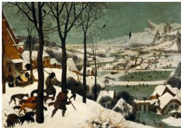
Охотники на снегу. 1565. Дерево, масло. 117 x 162. Музей истории искусств, Вена

Искусство старых Нидерландов (XIV — XVI вв.). 6. Питер