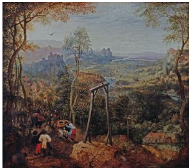
«Сорока на виселице» (Дармштадт, Музей земли Гессен)

В картине « Сорока на виселице » (Дармштадт, Музей земли Гессен) воплощены сразу две нидерландские пословицы: «Сорока никогда не перестанет прыгать» и «Танцевать (испражняться) под виселицей» (картина изображает оба названных действия); общий смысл этих выражений – равнодушие к угрозам. Виселица была обычной