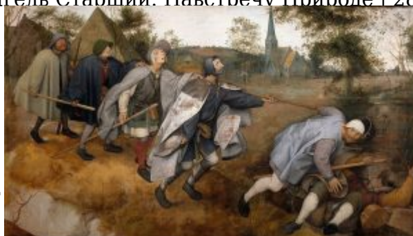
«Притча о слепцах» (Неаполь, Национальный музей Кападимонте)

следующего, что повернулся к зрителю – глазницы пусты: этот, наверное, потерял зрение в рукопашной или подвергся варварскому наказанию. Слепой поводырь слепых оступился и падает в ручей – за ним неминуемо должны последовать остальные. Вряд ли их ожидает здесь гибель: ручей неглубок. Брейгель избегает дешёвого драматизма; для него намного более важно донести до зрителя мысль о том, что это неторопливое, след в след, согласное движение к краю общей ямы – страшнее смерти.