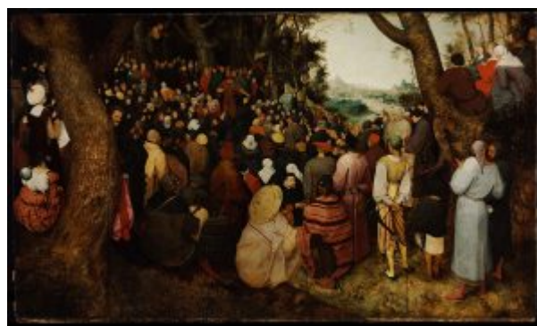
«Проповедь Иоанна Крестителя» (1566, Будапешт, Музей изобразительных искусств)

большую актуальность. Вот вид с возвышенности: опушка леса, заполненная массой народа. На первом плане - коренастые фигуры людей в широких одеждах, обращенные спиной к зрителю. Их напряжённое внимание интригует нас; мы вглядываемся в картину и видим, как десятки невзрачных, но вдохновенных лиц устремлены к бородатому оратору - а тот указывает толпе на светлоликого Незнакомца в голубовато-серой одежде, который только что поднялся сюда, в сумеречный лес, из ярко залитой солнцем речной долины. Это