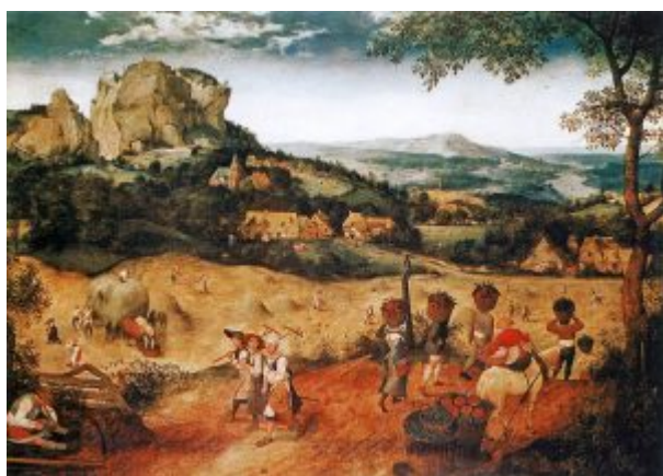
Сенокос. Из серии «Двенадцать месяцев». 1565. Холст, масло. 114 x 158 см. Национальный музей. Прага.

Полукруг шествия в картине Брейгеля (возможно, что и замкнутый круг, часть которого скрыта от нас горизонтом) – мотив, затрагивающий тему нескончаемого круговорота времени. Сходные взгляды высказывал современник художника, немецкий мыслитель Себастиан Франк: «Подобно Солнцу, ничто не кончается, ничто не вечно на земле... то, что было, того уже нет, но всё возвращается. Именно поэтому вся Библия должна вновь повториться... Страсти Христа повторяются каждодневно, каждый раз по-новому, мир есть всегда мир и земной шар должен обращаться». Обычный для искусства XVI в. приём перенесения евангельских событий в современную обстановку имел особый смысл: зрители воспринимали голгофскую трагедию как личный опыт. Брейгель также демонстрирует своё равнодушие к сюжету: бородатый мужчина в светлом кафтане и розовой шапке, изображённый у правого края его картины – по-видимому, автопортретная фигура.