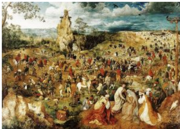
«Шествие на Голгофу» (1564, Вена, Художественно-исторический музей)

предлагает и в картине «Шествие на Голгофу» (1564, Вена, Художественно-исторический музей). При первом взгляде на неё мы не видим ни Голгофы, ни ведомого на казнь Христа – хотя легко находим группу оплакивающих Его близких на первом плане: монументальные, очерченные резким контуром фигуры Богоматери, апостола Иоанна и двух женщин по сторонам напоминают стиль Р. ван дер Вейдена (не в связи ли с новыми брюссельскими впечатлениями Брейгеля?).