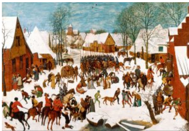
«Избиение младенцев в Вифлееме» (1566-67, Вена, Художественно-исторический музей)

И вот - « Избиение младенцев ». Место действия донельзя похоже на сцену «Переписи в Вифлееме», видимо, противоположная сторона той же самой площади. Но и сама суть изображаемого - «оборотная