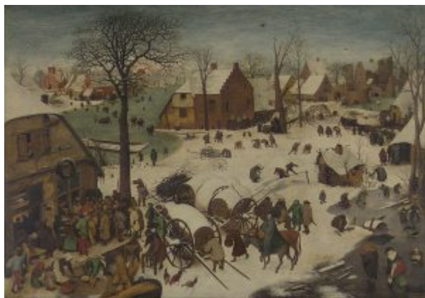
«Перепись в Вифлееме» (1566, Брюссель, Королевский музей изобразительных искусств)

Чуда не произошло. Прибыв в Брюссель, Альба предъявил всему нидерландскому народу официальное обвинение в ереси. Затем началась одна из самых чудовищных боен Новой истории. Разорение, массовые казни, бесчинства чужеземной солдатни стали уделом каждого нидерландского города, каждой деревни. Как отголосок этих бедствий воспринимается картина Брейгеля «Избиение младенцев в Вифлееме» (1566/67, Вена, Художественно-исторический музей: завершение своеобразной «рождественской трилогии» картин - живописной хроники нидерландского селения.