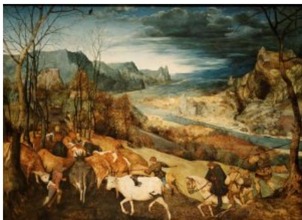
Возвращение стада. Из серии «Двенадцать месяцев». 1565. Холст, масло. 117 x 159 см. Художественно-исторический музей. Вена.

Сцены сезонных работ, в средневековом искусстве - основные эмблемы месяцев (фигурка садовника - апрель, жнеца - август) - у Брейгеля занимают важное, но не первостепенное место. В основе его языка - яркость первоначального впечатления. Каждая пора года представляема им как неповторимый облик земли и неба. В наиболее архаичной из картин цикла «Месяцы» - в «Сенокосе» - господствует стандартная «трёхцветка»; чередование общего тона от коричневого вблизи к голубому в глубине композиции. В других случаях Брейгель придал цвету особое - собственное - значение: не композиционной конструкции, а средства эмоционального воздействия на зрителя.