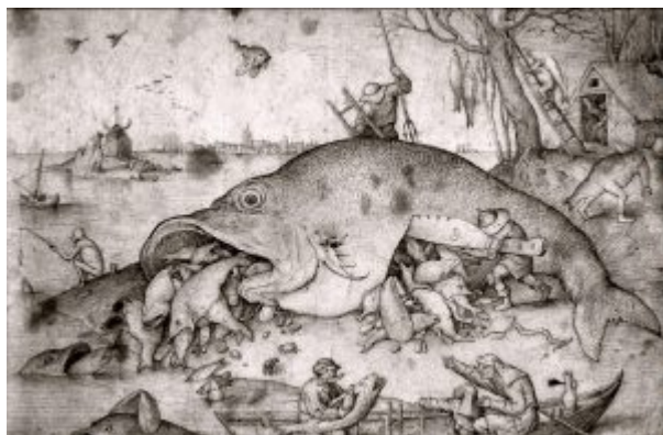
Большие рыбы пожирают маленьких рыб. 1556. Перо, серо-черная тушь. 21,6 x 30,2 см. Альбертина. Вена.

Среди клиентуры Иеронима Кока популярно творчество Иеронима Босха - правда, понимаемое на обывательском уровне как калейдоскоп жутковато-комических вымыслов, имеющих подтекстом несложное нравоучение. С этим спросом связана судьба рисунка « Большие рыбы пожирают маленьких рыбок » (Вена, Альбертина), который Брейгель исполнил для Кока