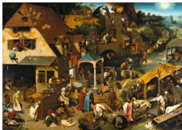
«Нидерландские пословицы» (Берлин, Государственные музеи)

В связи с этим замечательны две фигуры на первом плане картины. Молодой человек в розово-красном плаще беспечно вращает на