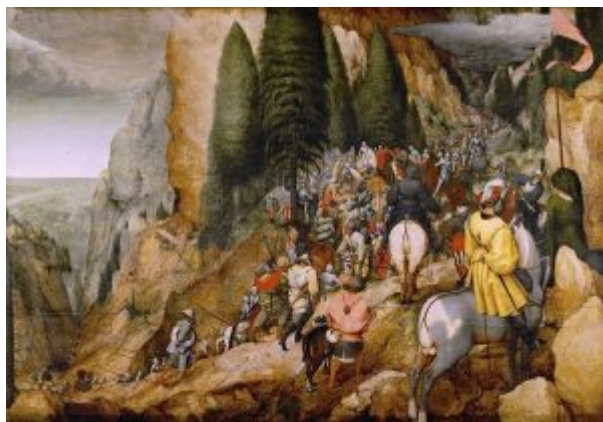
«Обращение Савла» (Вена, Художественно-исторический музей)

Однако работа Брейгеля для Н. Йонгелинка показывает, что художник и в Брюсселе поддерживал связи с антверпенскими заказчиками. Притом по их заказам он создавал картины, представлявшие (как «Большая Вавилонская башня» и «Шествие на Голгофу») индивидуальную и весьма вольную трактовку библейских сюжетов. Между тем, действовавший в то время так называемый «кровавый эдикт» императора Карла V (1550 г.) угрожал всякому, кто – подобно Брейгелю – не имея университетской степени по богословию, осмелится самостоятельно изучать и толковать Библию – конфискацией всего имущества и плахой либо костром.