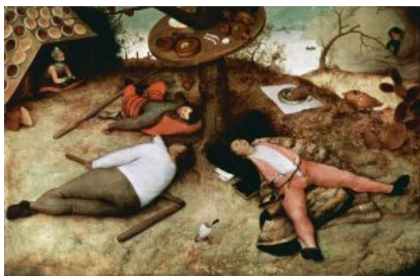
«Страна лентяев» (1567, Мюнхен, Пинакотека)

свободы – недаром действие здесь выносится из интерьера на простор и на свежий воздух. Бесшабашное веселье, которым охвачена вся деревня, в ладу с пьянящей атмосферой майского вечера. Тяжеловесный ритм кругового танца по-своему величав; он сравним с механикой небесных орбит. Все примитивные, но естественные позывы: к пляске, питью, поцелую и тому подобное – здесь удовлетворяются без раздумья и без меры. «Резонатором» всей сцены выглядит волынщик, словно бы сросшийся со своим инструментом в единый организм: пульсирующий, клопочущий, поющий.