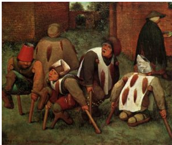
«Калеки» (Париж, Лувр)

человеческого - это опустившиеся существа во всех смыслах слова. Их обрубленные тела выглядят насмешкой над Homo erectus - человеком прямоходящим; в прыгающей ритмике костылей словно слышится отзвук дразнилок, к которым они притерпелись; лица калек выражают лишь идиотское ликование. По переулку вправо чинно уходит женщина в чёрном - которая, возможно, приносила убогим еду (будто животным в зверинце). Головные уборы инвалидов карикатурно представляют все сословия тогдашнего общества: красное ведёрко - дворянский шлем; бумажная архиерейская митра; меховая шапка бюргера; войлочные шляпы крестьян. Накидки калек украшают лисьи хвосты: отличительная эмблема оппозиционеров-«гёзов» в Нидерландах середине 1560-х гг. В удаляющейся женщине усматривают намёк на правительницу Маргариту Пармскую, которая вела переговоры с нидерландскими депутатами, но по прибытии Альбы подала в отставку. Таким образом, «Калеки» Брейгеля - возможно, живописная сатира на беспомощную политику нидерландской фронды.