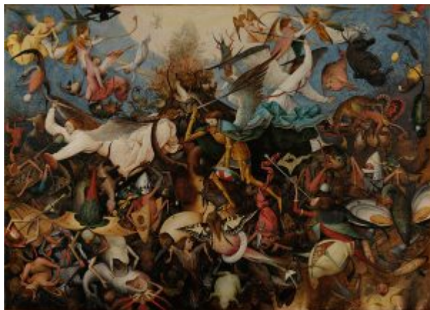
«Падение мятежных ангелов» (1562, Брюссель, Королевский музей изобразительных искусств)

Брейгель Старший. Навстречу Природе | 12 частному заказу, для некоего поклонника творчества Босха - своего рода повторение триптихов Босха в новой социально-художественной ситуации.