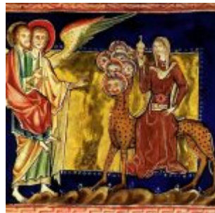
Миниатюра Ламбетского Апокалипсиса, 1260 г