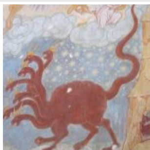
Фреска Крестовоздвиженского собора в Тутаеве