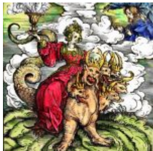
Вавилонская блудница (раскрашенная гравюра Ганса Бургкмайра, 1523 год. Иллюстрация к изданию перевода Библии Мартина Лютера)