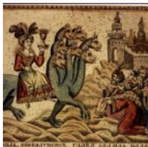
Вавилонская блудница (русский лубок, 1800-е годы)