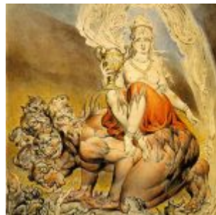
Уильям Блейк, Вавилонская блудница. 1809