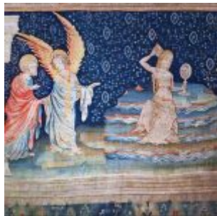
Блудница, сидящая на водах «Анжерский апокалипсис» (конец XV века)