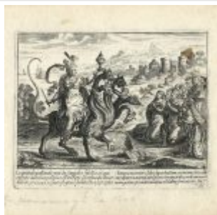
Гравюра. Из книги Томаса Брайтмана. Йодокус Хондиус (1563-1612) — фламандский