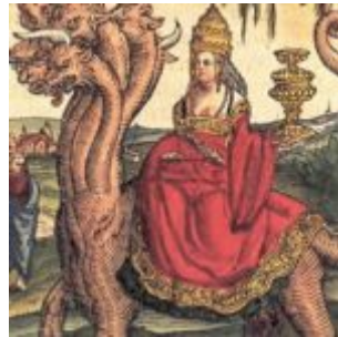
Лукас Кранах Старший — папесса Иоанна, изображена в виде вавилонской блудницы