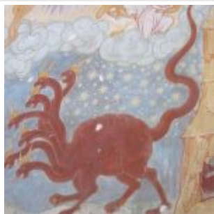
Фреска Крестовоздвиженского собора в Тутаеве