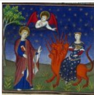
Ангел показывает Иоанну Богослову вавилонскую блудницу (французская миниатюра, XIV век)

В иконописи примером изображения блудницы может служить икона «Апокалипсис» Успенского собора Московского Кремля, созданная в конце XV века. На ней образ блудницы лишён отталкивающих свойств и больше соответствует античной традиции, напоминая изображения Европы на быке.