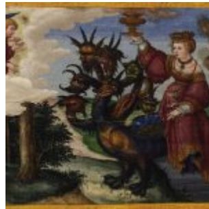
Иллюстрация из Библии Оттенриха, 1530-1532