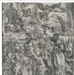
Вавилонская блудница едет верхом на семиглавом звере (гравюра Альбрехта Дюрера)