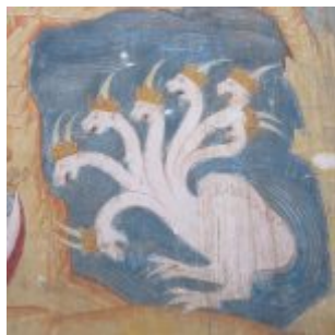
Фреска Крестовоздвиженского собора в Тутаеве