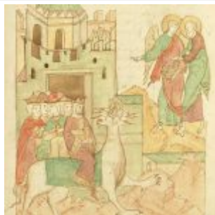
Вавилонская блудница (миниатюра лицевого Апокалипсиса, XVI век)