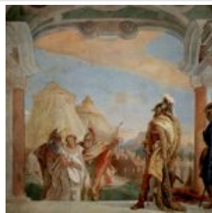
Фрески из виллы Вальмарана в Виченце