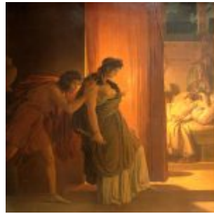
Пьер-Нарсис Герен, Клитемнестра колеблется перед убийством спящего Агамемнона, 1817