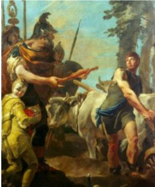
Дж.-Б. Тьеполо. Призвание Цинцинната к власти диктатора. 1725. Ленинград, Эрмитаж

росписи для церквей, писал картины жанрового характера («Гадалка», Венеция, Академия). Поздние произведения Пьяцетты выдают веяния новых вкусов, отличаются грацией, воздушностью, светлой красочной гаммой («Непорочное зачатие», Парма, Национальная галерея).