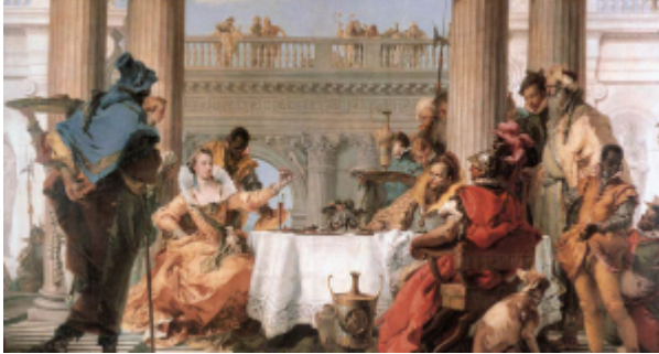
Дж.-Б. Тьеполо. Пир Клеопатры. 1744. Мельбурн, Национальная галерея Виктории

профиль лица, сильная рука и каскад красных складок. Зато живое, подлинно южное солнце заливает сиянием всю картину, его лучи играют на металле, шелке, складках белой скатерти. И вся сцена, исполненная вызывающей причудливости, оживает, приобретает благодаря освещению неповторимость, дыхание жизни.