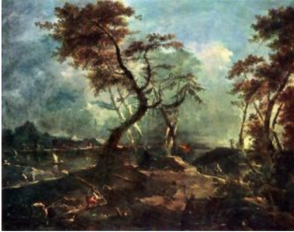
Ф. Гварди. Пейзаж. Ок. 1790. Ленинград, Эрмитаж

Не одна лишь монументальная живопись составляет славу венецианского искусства. Неповторимо своеобразие и не ослабеваает значение венецианской «ведуты» — видовой живописи, архитектурного пейзажа Венеции XVIII века. В отличие от римских мастеров архитектурного пейзажа венецианцы изображали всегда современный вид города, с современным стаффажем, и не любили отступать от его реального облика. Поэтическая выразительность венецианской ведуты зависит главным образом от наблюдательности мастера, передающего оттенки освещения, и от живописного почерка, который запечатлевает динамику движения толпы, блеск воды, краски неба.