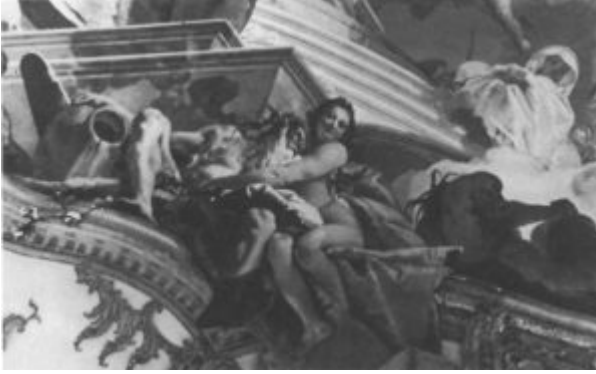
Дж.-Б. Тьеполо. Деталь плафона Императорского зала епископской резиденции в Вюрцбурге. Бог реки Майн и нимфа

На сомкнутом своде Императорского зала помещены две сюжетные сцены: «Император Фридрих Барбаросса облакает властью первого вюрцбургского епископа» и «Фридрих Барбаросса сочетается браком с Беатрисой Бургундской». Сцены эти разыгрываются словно в театре, на фоне декораций; скульптурные фигурки путти поддерживают складки узорного занавеса над этими представлениями. Плафон Императорского зала украшает роспись, сюжет которой уже полтора столетия обыгрывался итальянскими барочными живописцами: видимые снизу кони, мчащие по облакам колесницу божества. На этот раз Аполлон везет к жениху Беатрису Бургундскую. В ожидании прибытия невесты у трона