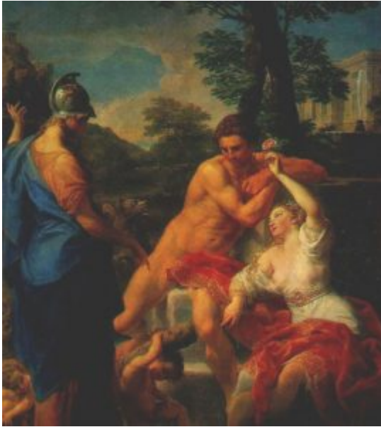
П. Батони. Геракл на распутье. 1765. Ленинград, Эрмитаж

предшественником можно назвать Помпео Батони (1708-1787), художника, который стремился преодолеть в себе склонность к барочной композиции, что редко ему удавалось. Картину «Геракл на распутье» (1765, Ленинград, Эрмитаж) с классицизмом роднит морализующий смысл сюжета: отказ от радостей жизни во имя долга и доблести.