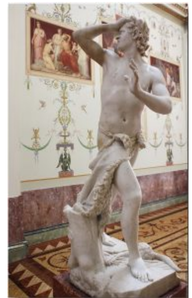
А. Канова. Орфей. 1776. Ленинград, Эрмитаж

греков и ему отдавалось предпочтение перед римским; был показан процесс развития искусства, а расцвет греческого искусства был объяснен политической свободой афинского народа. Эта работа была вехой в развитии общественной мысли в Европе и отправным пунктом для формирования классицизма.