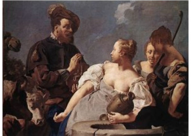
Дж.-Б. Пьяцетта. Ревекка у колодца. Милан, галерея Брера

декоративной эффектностью он забывает о чувствах героев; лаконично, но точно передает он терпение и стойкость Муция Сцевола, страдание Агамемнона, скрывшего лицо плащом, как в античной фреске (вилла Вальмарана близ Виченцы, 1757), или плач ребенка на груди мертвой матери («Святая Текла избавляет город Эсте от чумы», 1757, Эсте, церковь Санта Мария делле Грацие). Искусство Тьеполо органически соединяет пафос и гротеск, ощущение бесконечных воздушных далей неба и любование деталью. И все — солнечный свет, объем тел, блеск доспехов и тканей — все претворено у Тьеполо в цвет, воспринятый во всем его богатстве в условиях конкретного освещения.