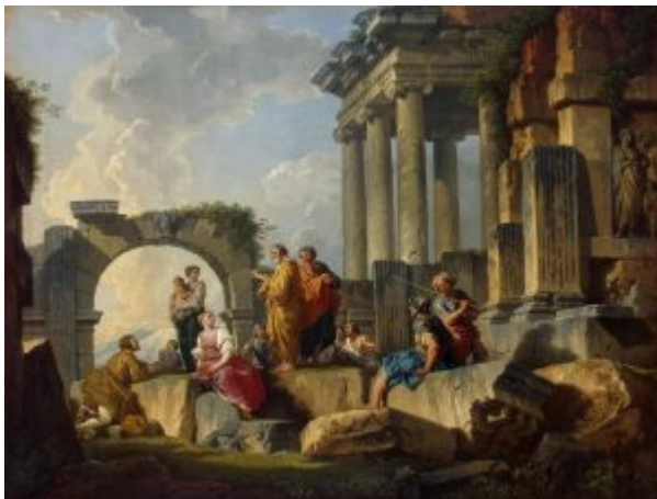
Дж. Паннини. Пейзаж («Развалины со сценой проповеди апостола Павла»). 1750-1760-е гг. Ленинград, Эрмитаж

которого сформировалось в Милане и получило развитие во Флоренции. Этот художник не довольствуется условными рамками бродячих сюжетов и готовых формул, он находит темы своей живописи в окружающей жизни. Маньяско изображает бурное море, сцены народного быта, монахов, светское общество, солдат, бродячих комедиантов, бандитов, суд трибунала, пытки в застенке инквизиции, раненых перед лазаретом, разграбление города. Все это — летопись подлинной жизни, и все это (независимо от того, смешон или страшен сюжет) 152 италия кажется увиденным в кошмарном сне и вместе с тем рассказанным с оттенком болезненной иронии, сарказма, гротеска. Путь к душе зрителя у Маньяско — гиперболы, вытянутые пропорции, бесплотность человеческого тела, карикатурный жест, мрачная, холодная красочная гамма и прежде всего нервный, быстрый, пляшущий, бесконечно гибкий мазок. Трагическое ощущение мира окрашивает и бурные грозные пейзажи. Этот специфический, совершенно новый строй живописи роднит самые различные произведения Маньяско, как «Свадебная процессия» (Берлин, Национальная галерея), «Горный пейзаж» и «Привал бандитов» (Ленинград, Эрмитаж).