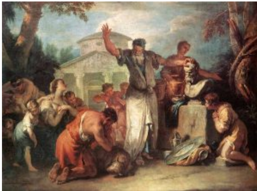
С. Риччи. Жертвоприношение Силену. Дрезден Картинная галерея

которая в XVIII веке приобретает в Италии распространение как своеобразная дань уважения величию Италии в прошлом. Панини пишет реальные развалины римских построек, а также фантазии на эту тему, где произвольно комбинирует различные сооружения и украшает первый план картины разбросанными капителями колонн или обломками карнизов.