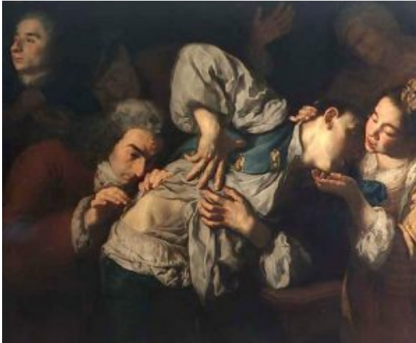
Г. Траверси. Раненый. Венеция, собрание И. Брасс