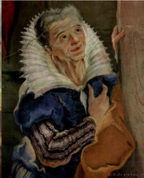
Дж.-Б. Тьеполо. Явление ангела Сарре. Фреска архиепископского дворца в Удине. Деталь. 1726

Джованни Батиста Тьеполо (1696— 1770) — величайший итальянский живописец XVIII века. Это наиболее блистательный представитель итальянского барокко в живописи и последний барочный мастер в европейском искусстве, венецианец до мозга костей. Его талант органически впитал в себя все сделанное предшественниками, начиная с Возрождения, и особенно любовно принял наследство от Паоло Веронезе.