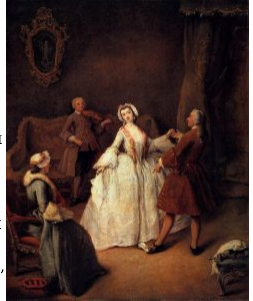
П. Лонги. Урок танца. Венеция, Академия Италия

В других жанрах живописцы Венеции XVIII века достигли если не высот, то оригинальности. Бытописатель Пьетро Лонги (1702-1785) запечатлевал шаг за шагом жизнь современной Венеции. Живопись его отличается мягкостью тона, но в центре его внимания сюжет, характерные бытовые черты.