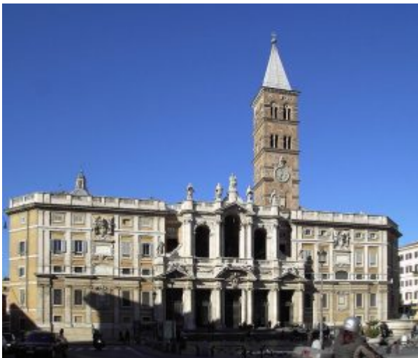
Ф. Фуга. Фасад базилики Санта Мария Маджоре в Риме. 1743

В XVIII столетии упадок дает себя знать и в области искусства, которое долго, как бы по инерции, сохраняло силу и самобытность в разоренной стране. Подлинного расцвета итальянское искусство в XVIII веке достигает только в Венеции — независимой республике, остававшейся свободной до самого наполеоновского нашествия в 1797 году. Со второй половины XVIII века в жизни Италии начинает обозначаться перелом.