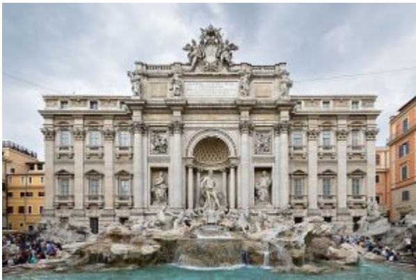
Н. Сальви. Фонтан Треви. 1732-1762. Рим

В искусстве Италии XVIII века до 70-х годов преобладает стиль барокко, так как культура страны в целом носит консервативный характер и господствовавшая в XVII веке стилистическая система сохраняется. Ее питают в первую очередь потребности католической церкви. Однако, в отличие от XVII столетия и от барокко XVIII века в Германии или Испании, развитие этого стиля в Италии данной эпохи лишь в незначительной степени связано с архитектурой. Главные произведения барокко в итальянском искусстве этого времени — декоративные росписи и декоративная скульптура, алтарные композиции, в основном живописные, наконец, станковая живопись.