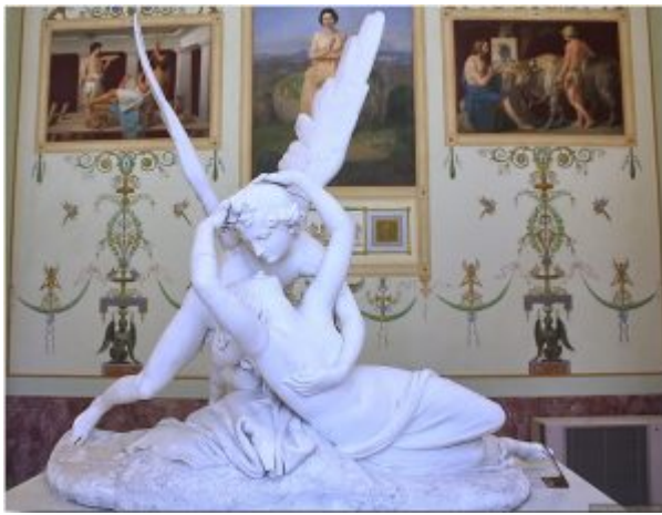
А. Канова. Поцелуй Амура. 1796. Ленинград, Эрмитаж

В 1763 году Иоганн Иоахим Винкельман (1717-1768), немецкий ученый, живший в Риме, издал свою «Историю искусства древности». В ней из общего понятия «античность» было выделено искусство древних