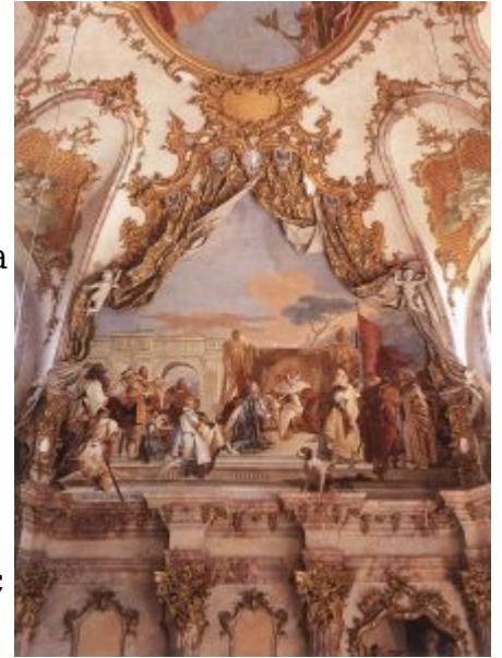
Дж.-Б. Тьеполо. Фреска свода Императорского зала епископской резиденции в Вюрцбурге. 1750-1753

На сомкнутом своде Императорского зала помещены две сюжетные сцены: «Император Фридрих Барбаросса облакает властью первого вюрцбургского епископа» и «Фридрих Барбаросса сочетается браком с Беатрисой Бургундской». Сцены эти разыгрываются словно в театре, на фоне декораций; скульптурные фигурки путти поддерживают складки узорного занавеса над этими представлениями. Плафон Императорского зала украшает роспись, сюжет которой уже полтора столетия обыгрывался итальянскими барочными живописцами: видимые снизу кони, мчащие по облакам колесницу божества. На этот раз Аполлон везет к жениху Беатрису Бургундскую. В ожидании прибытия невесты у трона