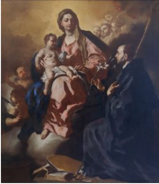
Ф. Солимена. Мадонна с младенцем и св. Франциском. Дрезден, Картинная галерея

период. Строятся театры в Мантуе, Вероне, «Ла Скала» в Милане (1778). Преобладает строгая композиция фасадов, близкая к классицизму. Скульптура в Италии XVIII столетия (до 80-90-х гг.) переживает упадок по сравнению с предшествующими веками. Здесь господствует барокко, то ярко выраженное, то приглушенное.