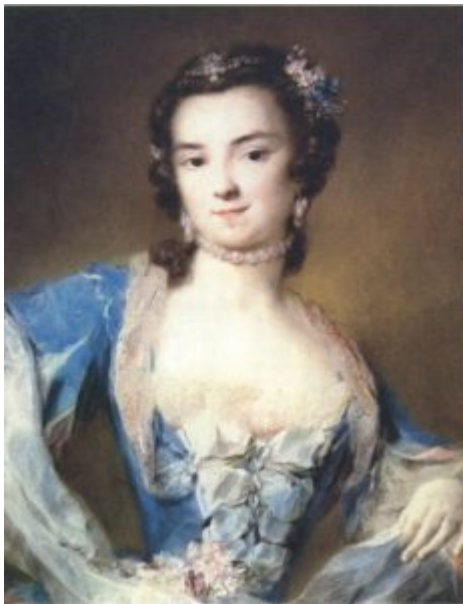
Р. Каррьера. Портрет Барбарини Кампани. До 1739. Дрезден, Картинная галерея

двадцати двух — двадцати трех лет Каналетто посетил Рим, и от этого времени дошло до нас несколько сделанных им изображений древнеримских памятников, а затем — фантастических архитектурных пейзажей. Со времени возвращения в Венецию он отдается тому, что и оказалось его призванием: вся Венеция, центр и окраины, площади, заполненные толпой, каналы с проплывающими лодками — все это становится благодарным, неисчерпаемым материалом его искусства. Изображения зданий у него точны, фигуры дифференцированы — это знатные люди, монахи, торговцы, гондольеры, нищие. Каналетто в какой-то мере бытописатель; по его картинам можно узнать, как совершались торжественные выезды дожа для венчания с морем, кто какие носил костюмы и маски, как торговали, сушили белье, ездили на гондолах. Но не только красота зданий, перспектива каналов, движение многоликой толпы занимают Каналетто; воздушная перспектива скрадывает контуры отдаленных построек, солнце заливает площади, сверкает вода каналов, живописная фактура делает осязаемой поверхность мрамора и дерева, бархат нарядов.