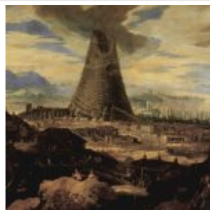
Тёпут, Людовик — Строительство Вавилонской башни