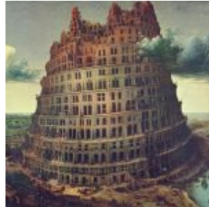
Брейгель Старший, Ян — Строительство Вавилонской башни