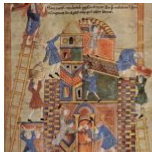
Мастер Пятикнижия — Строительство Вавилонской башни — Пятикнижие и книга Иисуса Навина