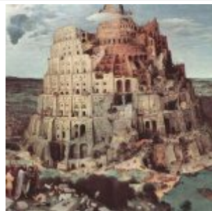
Брейгель Старший, Ян- Строительство Вавилонской башни