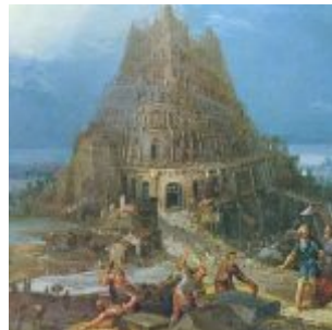
Брейгель Старший, Ян — Строительство Вавилонской башни