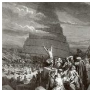
Доре, Гюстав — Вавилонская башня