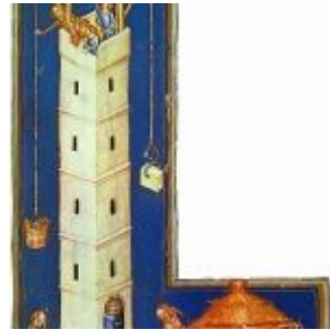
Мастер Мировых хроник — Строительство Вавилонской башни — Сцена из Мировых хроник в стихах