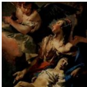
Тьеполо, Джованни Доменико Баттиста Агарь и Исмаил