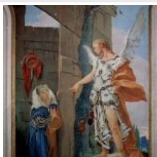
Тьеполо, Джованни Доменико Баттиста Явление ангела Сарре Фрески архиепископского дворца в Удине