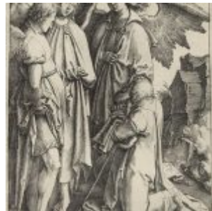
Лейден, Лукас ван Авраам и три ангела