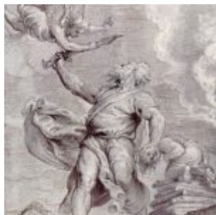
Рубенс, Питер Пауль Жертвоприношение Авраама