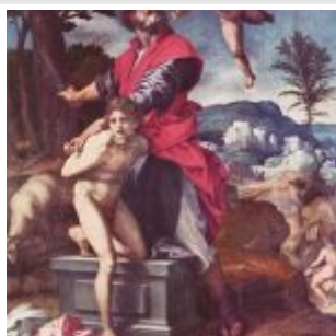
Сарто, Андреа дель Жертвоприношение Авраама