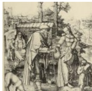
Лейден, Лукас ван Большая Агарь