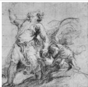
Тициан Жертвоприношение Исаака