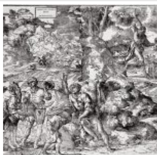
Тициан Жертвоприношение Авраама