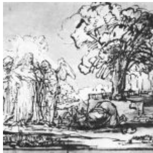
Рембрандт, Харменс ван Рейн Посещение тремя ангелами Авраама