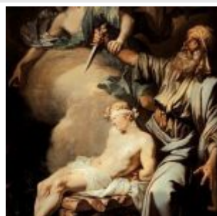
Лосенко, Антон Авраам приносит в жертву сына своего Исаака