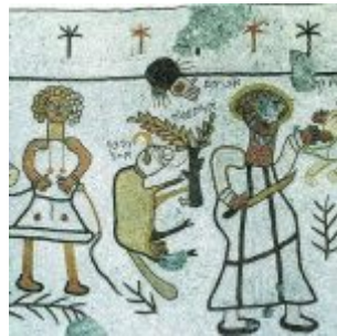
Неизвестный мастер Жертвоприношение Исаака фрагмент мозаичного пола синагоги в Бейт-Альфа