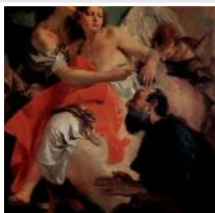
Тъеполо, Джованни Доменико Баттиста Авраам и ангел