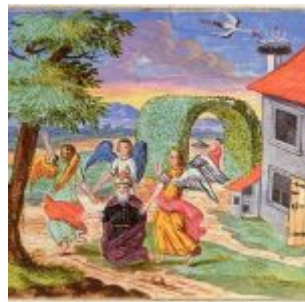
Неизвестный мастер Моравская Агада посещение Авраама тремя ангелами