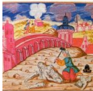
Неизвестный мастер Моравская Агада Авраам разбивает идолов