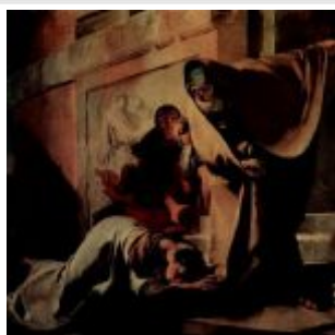
Тьеполо, Джованни Доменико Баттиста Неповиновение Агари