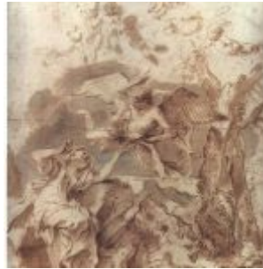
Кастильоне, Джованни Бенедетто Агарь в пустыне