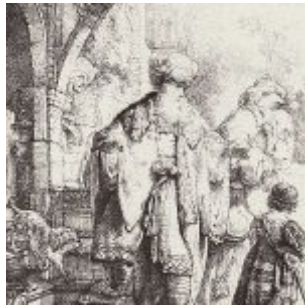
Рембрандт, Харменс ван Рейн Изгнание Агари