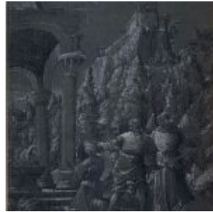
Альтдорфер, Альбрехт 2 Жертвоприношение Авраама