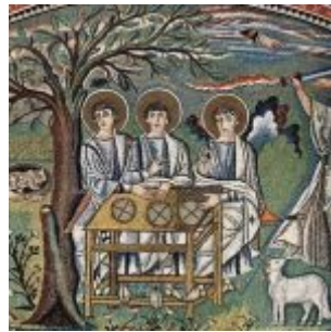
Мастер церкви Сан Витале в Равенне Жертвоприношение Авраама Мозаика хора церкви Сан Витале в Равенне