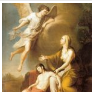
Угрюмов, Григорий Изгнанная Агарь с малолетним сыном Исмаилом в пустыне