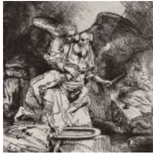
Рембрандт, Харменс ван Рейн Жертвоприношение Авраама