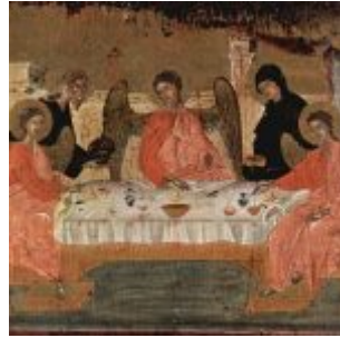
Мастер иконы Тринитат Авраам и три ангела