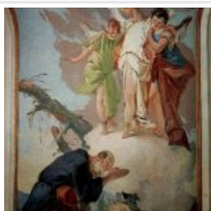
Тьеполо, Джованни Доменико Баттиста Явление ангела Аврааму Фрески архиепископского дворца в Удине