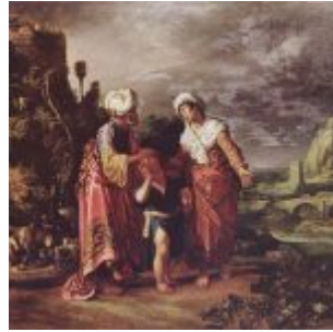
Ластман, Питер Питерс Прощание Агари