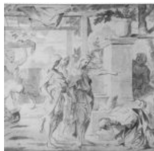
Бурдон, Себастьян Авраам и три ангела