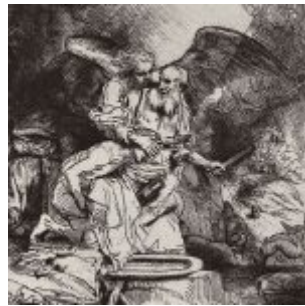
Рембрандт, Харменс ван Рейн Жертвоприношение Авраама