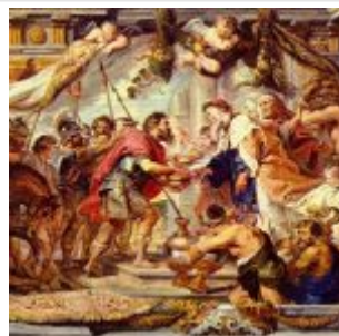
Рубенс, Питер Пауль Встреча Авраама и Мельхиседека