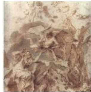
Кастильоне, Джованни Бенедетто Агарь в пустыне