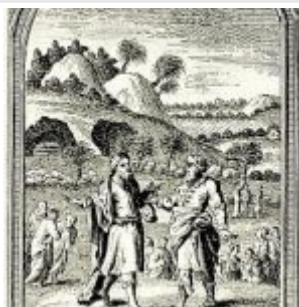
Хогарт, Уильям Авраам покупает поле у хеттеянина Ефрона