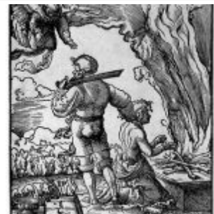
Альтдорфер, Альбрехт Жертвоприношение Авраама