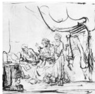
Рембрандт, Харменс ван Рейн Сарра посылает Агарь к Аврааму