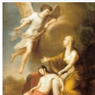
Угрюмов, Григорий Изгнанная Агарь с малолетним сыном Исмаилом в пустыне