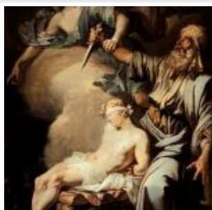
Лосенко, Антон Авраам приносит в жертву сына своего Исаака