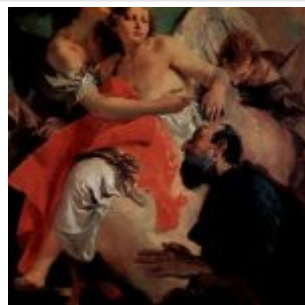
Тъеполо, Джованни Доменико Баттиста Авраам и ангел