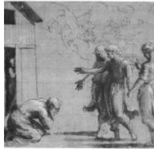
Пенни, Джованни Франческо Три ангела перед Авраамом