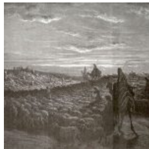
Доре, Гюстав Авраам переселяется в землю Ханаанскую