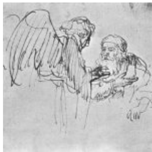
Рембрандт, Харменс ван Рейн Ангел разговаривает с Авраамом