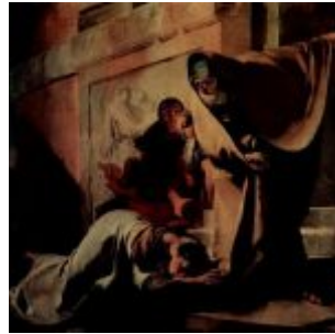
Тьеполо, Джованни Доменико Баттиста Неповиновение Агари