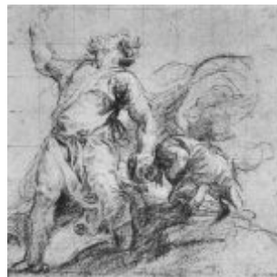
Тициан Жертвоприношение Исаака