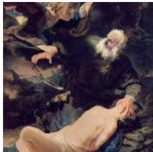
Рембрандт, Харменс ван Рейн Ангел предотвращает жертвоприношение Исаака