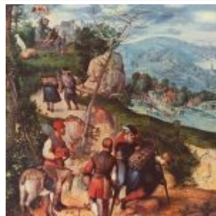
Брауншвейгский Монограммист Жертвоприношение Авраама