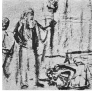
Рембрандт, Харменс ван Рейн Призвание Авраама