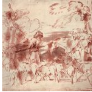
Кастильоне, Джованни Бенедетто Авраам на пути в землю обетованную