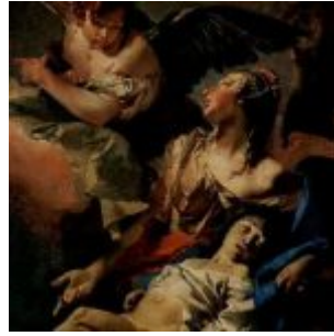
Тьеполо, Джованни Доменико Баттиста Агарь и Исмаил