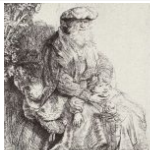
Рембрандт, Харменс ван Рейн Авраам, ласкающий Исаака