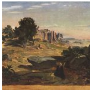
Коро, Жан-Батист-Камиль Агарь в пустыне