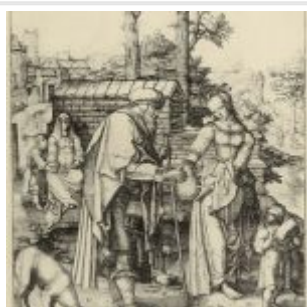
Лейден, Лукас ван Большая Агарь