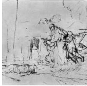
Рембрандт, Харменс ван Рейн Бог является Аврааму