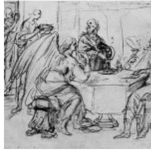
Ванни, Джованни Баттиста Авраам и три ангела