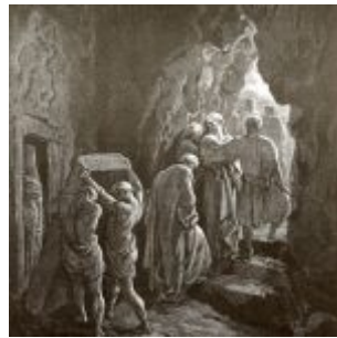
Доре, Гюстав Погребение Сарры