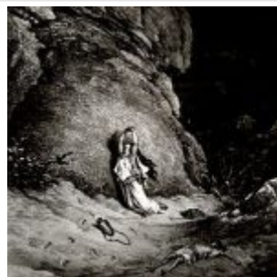
Доре, Гюстав Агарь и Измаил в пустыне