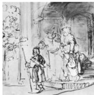
Рембрандт, Харменс ван Рейн Изгнание Агари