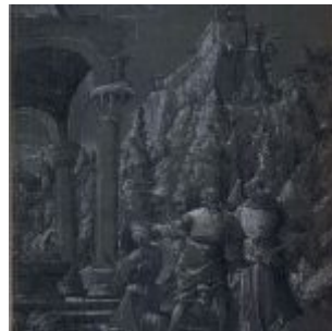
Альтдорфер, Альбрехт 2 Жертвоприношение Авраама