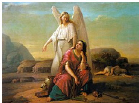
Агарь в пустыне (Георге Таттареску, 1870)

Ветхий Завет: Авраам, Сарра, Агарь. Жертвоприношение Авраама. Авраам и три ангела | 2 благословение Мелхиседека (Малки-Цедека, ивр.), царя Салима (Шалема) и «священника Бога Всевышнего». Когда царь Содомы предложил Авраму забрать всю военную добычу себе, Аврам отказался, чтобы никто не мог сказать, будто обогатил Аврама. Однако доли, принадлежащие его людям, отдал Анеру, Эшколу и Мамрию (Быт. 14).