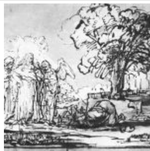
Рембрандт, Харменс ван Рейн Посещение тремя ангелами Авраама