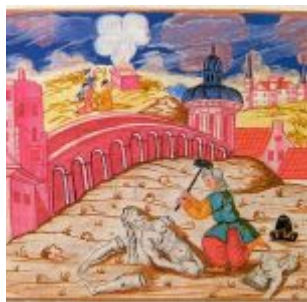
Неизвестный мастер Моравская Агада Авраам разбивает идолов