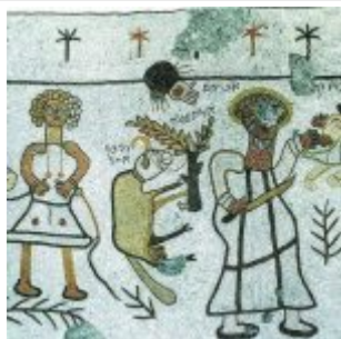
Неизвестный мастер Жертвоприношение Исаака фрагмент мозаичного пола синагоги в Бейт-Альфа