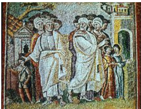
Отделение Лота (мозаика нефа базилики Санта-Мария-Маджоре, V век)

Приближаясь к этому государству, он велел своей жене Саре назваться сестрой, опасаясь, что из-за её красоты польстившиеся на Сару люди могут его убить. Египетские вельможи действительно сочли Сару весьма красивой и сообщили об этом фараону. Фараон взял её себе в жёны, а Авраму благодаря этому «было хорошо: он имел крупный и мелкий скот, ослов, рабов и рабынь, лошаков и верблюдов». Однако Бог поразил фараона и его дом из-за Сары. Фараон призвал к себе Аврама и спросил, почему же тот не сообщил, что Сара — его жена. После чего отпустил Аврама со всем имуществом, Сарой и Лотом, и фараоновы люди проводили их (Быт. 11-12).