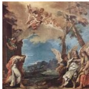
Риччи, Себастьяно Авраам и три ангела