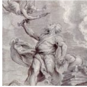
Рубенс, Питер Пауль Жертвоприношение Авраама