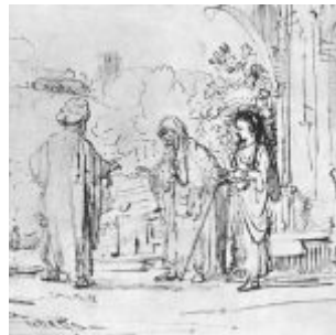
Рембрандт, Харменс ван Рейн Сарра жалуется на Агарь