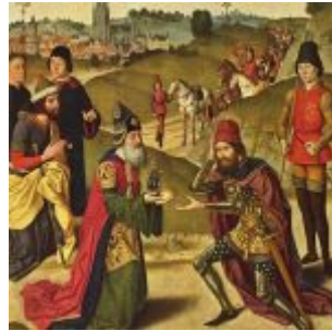
Боутс, Дирк Авраам и Мельхиседек Алтарь церкви Святого Петра в Лёвене