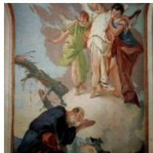
Тьеполо, Джованни Доменико Баттиста Явление ангела Аврааму Фрески архиепископского дворца в Удине