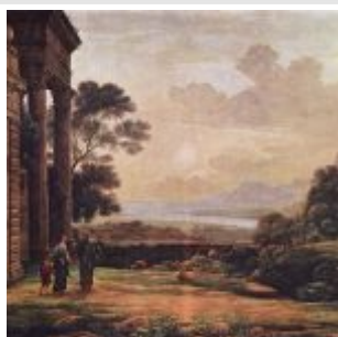
Лоррен, Клод Изгнание Агари