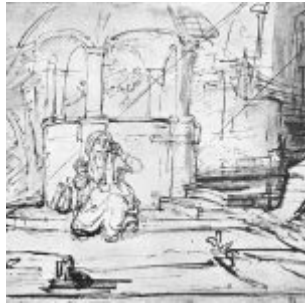
Рембрандт, Харменс ван Рейн Агарь у колодца на пути в Сур