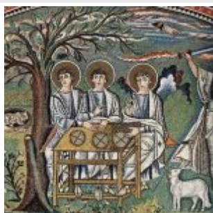
Мастер церкви Сан Витале в Равенне Жертвоприношение Авраама Мозаика хора церкви Сан Витале в Равенне