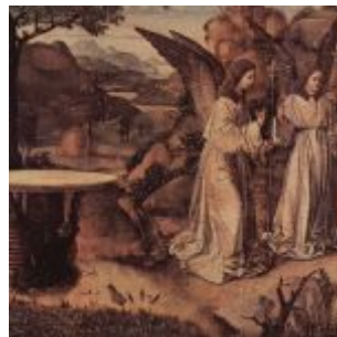
Антонелло да Мессина Явление трех ангелов Аврааму, фрагмент