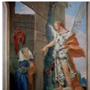
Тьеполо, Джованни Доменико Баттиста Явление ангела Сарре Фрески архиепископского дворца в Удине