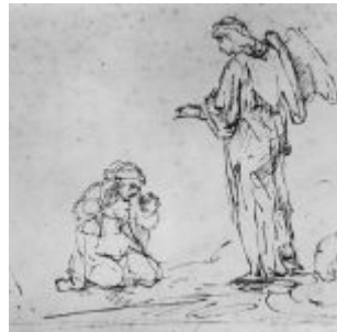
Рембрандт Харменс ван Рейн Агарь и ангел