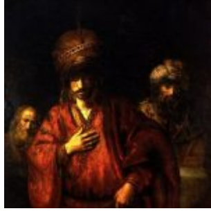
Рембрандт, Харменс ван Рейн Агарь в немилости