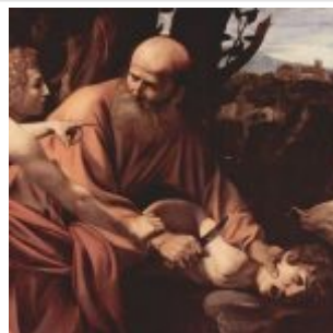
Караваджо, Микельанджело Меризи де Жертвоприношение Исаака