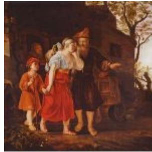
Викторс, Ян Изгнание Агари