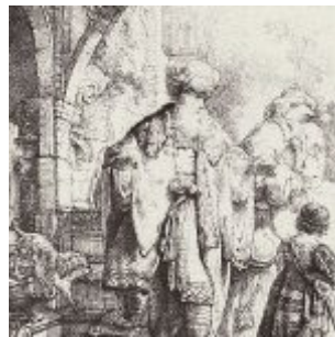
Рембрандт, Харменс ван Рейн Изгнание Агари