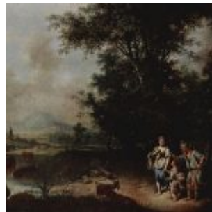
Зеекац, Иоганн Конрад Неповиновение Агари