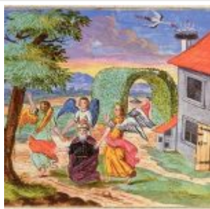
Неизвестный мастер Моравская Агада посещение Авраама тремя ангелами