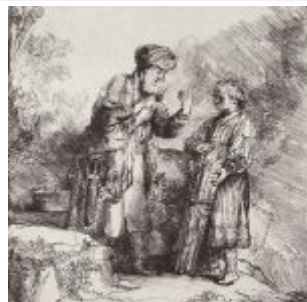
Рембрандт, Харменс ван Рейн Авраам, разговаривающий с Исааком