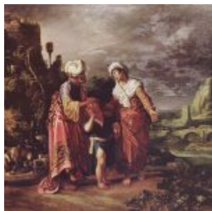
Ластман, Питер Питерс Прощание Агари