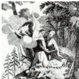
Херц, Йозеф Махзор из Шульбаха жертвоприношение Исаака