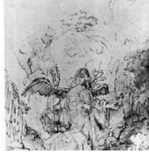
Бол, Фердинанд Агарь в пустыне

Ветхий Завет: Авраам, Сарра, Агарь. Жертвоприношение Авраама. Авраам и три ангела | 6