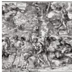
Тициан Жертвоприношение Авраама