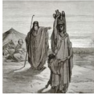
Доре, Гюстав Изгнание Агари и Измаила