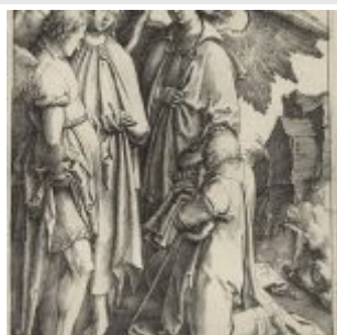
Лейден, Лукас ван Авраам и три ангела