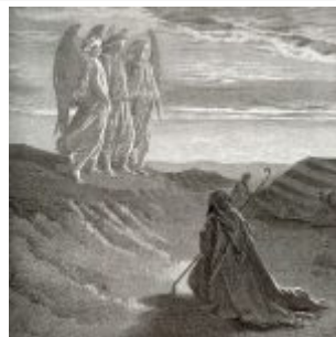
Доре, Гюстав Явление Господа Аврааму