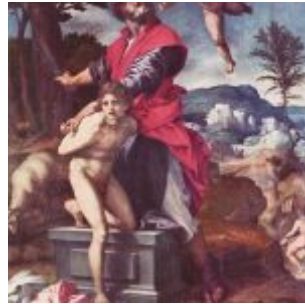
Сарто, Андреа дель Жертвоприношение Авраама