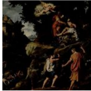
Аллори, Кристофано Жертвоприношение Авраама