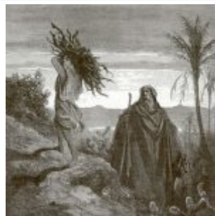
Доре, Гюстав Авраам и Исаак