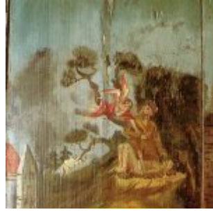
Неизвестный мастер Сукка из деревни Фишах жертвоприношение Исаака, панель 20