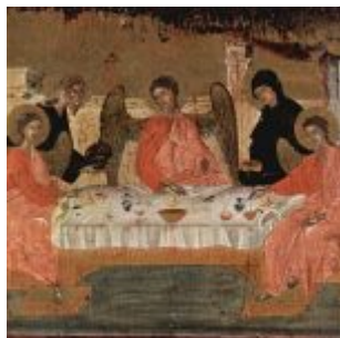
Мастер иконы Тринитат Авраам и три ангела