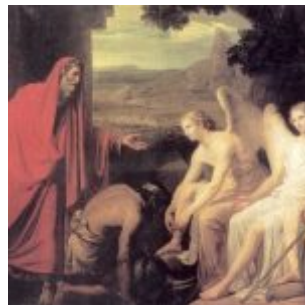
Брюллов, Карл Явление Аврааму трёх ангелов у дуба Мамврийского