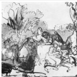
Рембрандт, Харменс ван Рейн Ангел указывает Агари спасительный источник