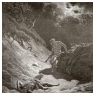
Убийство Авеля (Быт. 4:8-16) Художник: Доре, Гюстав Материал, техника: резцовая гравюра на дереве Стиль, эпоха: романтизм Страна: Франция