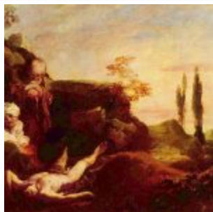
Оплакивание Авеля родителями (Быт. 4:8-16) Художник: Лисс, Иоганн Дата создания: первая треть 17 века Размер: 67 x 84 см Материал, техника: холст, масло Местонахождение: Венеция, Академия Стиль, эпоха: барокко Страна: Германия