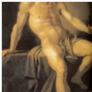
Каин (Быт. 4:1-17) Художник: Лосенко, Антон Дата создания: 1768 Размер: 158,5 x 109 см Материал, техника: холст, масло Местонахождение: Санкт-Петербург, Государственный Русский музей Стиль, эпоха: реализм Страна: Россия