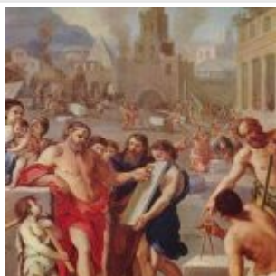
Каин строит город Енох (Быт. 4:17) Художник: Французский мастер (около 1675) Дата создания: около 1675 Размер: 158,5 x 109,5 см Материал, техника: холст Местонахождение: Будапешт, Музей изящных искусств Стиль, эпоха: барокко Страна: Нидерланды (Фландрия)