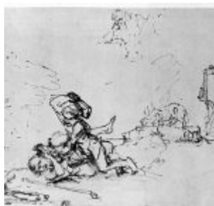
Каин убивает Авеля (Быт. 4:8) Художник: Рембрандт, Харменс ван Рейн Дата создания: около 1650 Размер: 175 x 230 мм Материал, техника: перо бистром, отмывка, бумага Местонахождение: Нью-Йорк, Собрание Хирш Стиль, эпоха: барокко Страна: Нидерланды (Голландия)