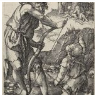
Ламех и Каин (Быт. 4:1-17) Художник: Лейден, Лукас ван Гравёр: Лейден, Лукас ван Дата создания: 1524 Материал, техника: резцовая гравюра на меди Местонахождение: Вена, Собрание графики Альбертина Стиль, эпоха: Возрождение Страна: Нидерланды