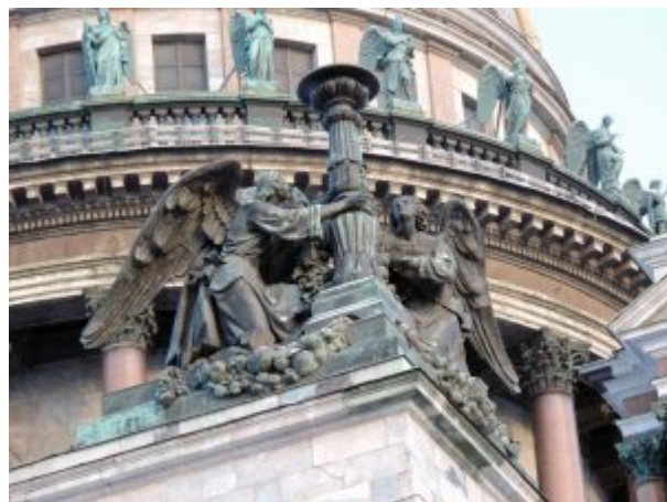
Фигуры ангелов у светильников на углах Исаакиевского собора

Интересно творчество скульптора И.П. Витали (1794–1855), исполнившего среди прочих работ скульптуру