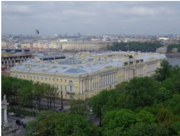
Сенат и Синод, Санкт-Петербург

перегруженности скульптурными элементами, жесткости, холодности и помпезности.