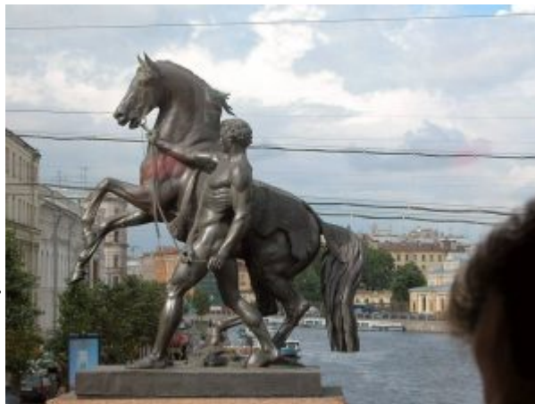
Один из коней Клодта

Ведущим направлением архитектуры и скульптуры первой трети XIX столетия был классицизм. В живописи его развивали прежде всего академические художники в историческом жанре (А.Е. Егоров – «Истязание Спасителя», 1814, ГРМ; В.К. Шебуев – «Подвиг купца Иголкина», 1839, ГРМ; Ф.А. Бруни – «Смерть Камиллы, сестры Горация», 1824, ГРМ; «Медный змий», 1826–1841, ГРМ). Но истинные успехи живописи лежали, однако, в другом русле – романтизма. Лучшие стремления человеческой души, взлеты и парения духа выразила