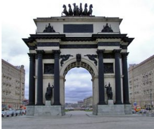
Триумфальные ворота, О.И. Бове

Почти всегда вместе плодотворно работали Доменико (Дементий Иванович) Жилярди (1788-1845) и Афанасий Григорьевич Григорьев (1782-1868). Жилярди перестроил сгоревший во время войны казаковский Московский университет (1817-1819). В результате перестроек более монументальными становятся купол и портик, из ионического превратившийся в дорический. Много и удачно Жилярди и Григорьев работали в усадебной архитектуре ( усадьба Усачевых на Яузе, 1829-1831, с ее тонкой лепкой декорации;