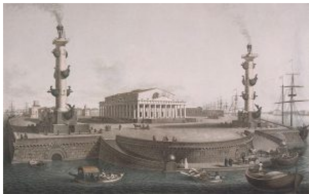
Вид биржи со стороны Большой Невы

Биржи , и он блестяще справился с заданием (1805–1810). Томон изменил весь облик стрелки Васильевского острова, оформив полукругом берега двух русел Невы, поставив по краям ростральные колонны-маяки , образовав тем самым около здания Биржи площадь. Сама Биржа имеет вид греческого храма – периптера на высоком цоколе, предназначенном для торговых складов. Декор почти отсутствует. Простота и ясность форм и пропорций придают зданию величественный, монументальный характер, делают его главным не только в ансамбле стрелки, но и влияющим на восприятие обеих набережных как Университетской, так и Дворцовой. Декоративная аллегорическая скульптура здания Биржи и ростральных колонн подчеркивает назначение сооружений. Центральный зал Биржи с лаконичным дорическим антаблементом перекрыт кессонированным полуциркульным сводом.