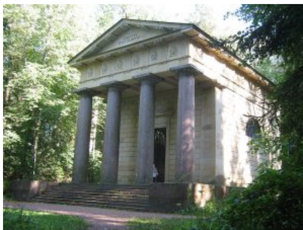
Мавзолей супругу-благодетелю в Павловске

Федоровной в память о Павле в парке Павловска (1805–1808, мемориальная скульптура исполнена Мартосом). Мавзолей напоминает архаический тип храма-простиля. Внутри зал также перекрыт кессонированным сводом. Гладкие стены облицованы искусственным мрамором.