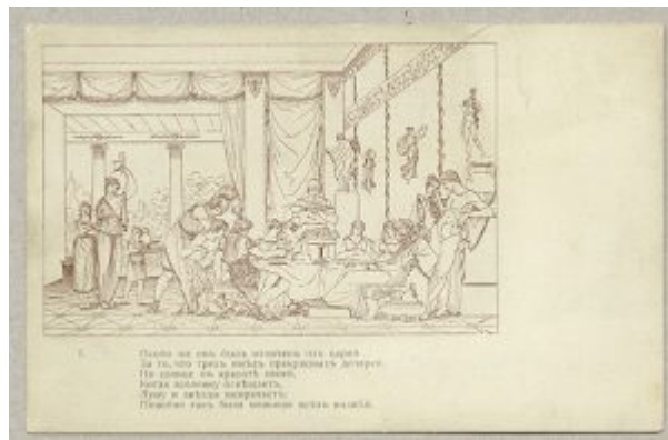
Толстой Ф. П. Иллюстрация к «Душеньке». 1820—1833

Богдановича, выполненные тушью и пером и награвированные резцом – прекрасный образец русской очерковой графики на сюжет овидиевских «Метаморфоз» о любви Амура и Психеи, где художник высказал свое понимание гармонии античного мира.