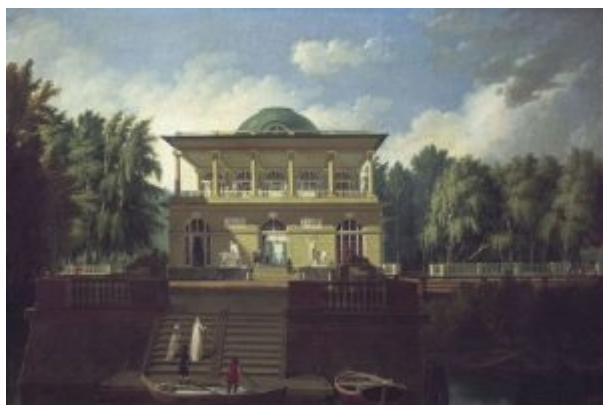
«Вид Строгановской дачи» (1797, Русский музей, Санкт-Петербург)

вдохновляет русских архитекторов. Используется дорический (или тосканский) ордер, который привлекает своей суровостью и лаконизмом. Некоторые элементы ордера укрупняются, особенно это касается колоннад и арок, подчеркивается мощь гладких стен. Архитектурный образ поражает величавостью и монументальностью. Огромную роль в общем облике здания играет скульптура, имеющая определенное смысловое значение. Много решает цвет, обычно архитектура высокого классицизма двухцветна: колонны и лепные статуи – белые, фон – желтый или серый. Среди зданий главное место занимают общественные сооружения: театры, ведомства, учебные заведения, значительно реже возводятся дворцы и храмы (за исключением полковых соборов при казармах).