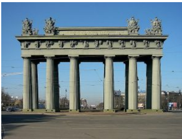
Московские Триумфальные ворота

«Самым строгим» из всех архитекторов позднего классицизма был Василий Петрович Стасов (1769–