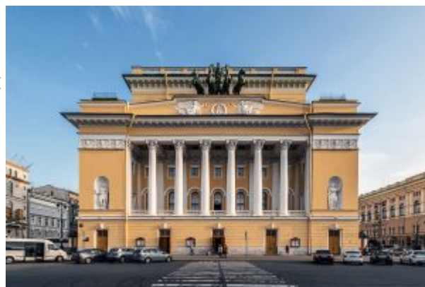
Фасад Александринского театра

улицу за фасадом театра, получившую в наши дни имя ее создателя, и завершающую его пятигранную Чернышеву площадь у набережной Фонтанки. Кроме того, в ансамбль вошло соколовское здание Публичной библиотеки, видоизменённое Росси, и павильоны Аничкова дворца, построенные Росси ещё в 1817–1818 гг.