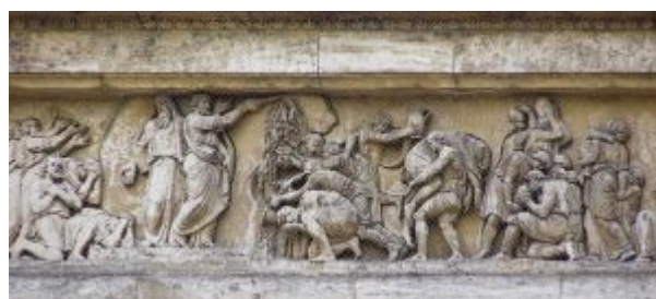
Моисей источает воду из камня

Вместе с Ф. Щедриным Мартос работает также над скульптурами для Казанского собора. Им исполнен рельеф «Истечение воды Моисеем» на аттике восточного крыла колоннады. Четкое членение фигур на гладком фоне стены, строго классицистический ритм и гармония характерны для этой работы (фриз аттика западного крыла «Медный змий», как говорилось выше, был исполнен Прокофьевым).