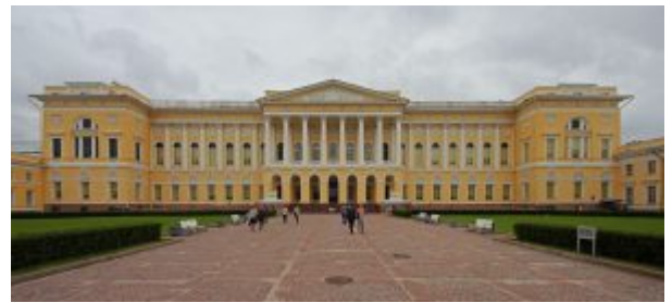
Михайловский дворец (главный корпус Русского музея)

совершил поездку в Италию, где изучал памятники античности. Самостоятельное его творчество начинается в Москве, продолжается в Твери. Одна из первых работ в Петербурге – постройка на Елагином острове (1818). Про Росси можно сказать, что он «мыслил ансамблями». Дворец или театр превращались у него в градостроительный узел из площадей и новых улиц. Так, создавая Михайловский дворец (1819–1825, теперь Русский музей), он организует площадь перед дворцом и прокладывает улицу на Невский проспект, соразмеряя при этом свой замысел с другими близлежащими постройками – Михайловским замком и пространством Марсова поля. Главный подъезд здания, помещенного в глубине парадного двора за чугунной решеткой, выглядит торжественно, монументально, чему способствует коринфский портик, к которому ведут широкая лестница и два пандуса.