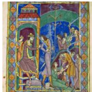
Massacre of the Innocents