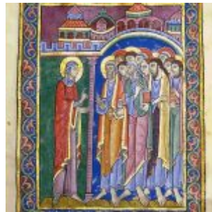
Mary Magdalene announces the Risen Christ