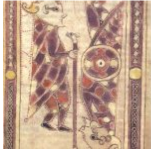
C.9, f.68v. Давид и Голиаф