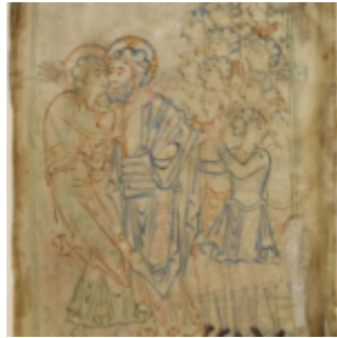
Ф. 12r, Арест Христа