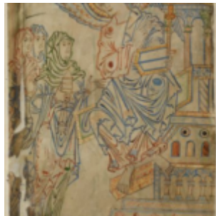
Ф. 13v, Женщины у могилы