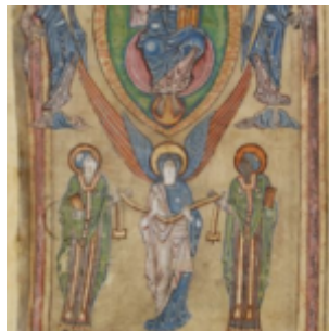
Ф. 18v, Христос во славе