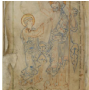
е. 14г. Неверие Фомы