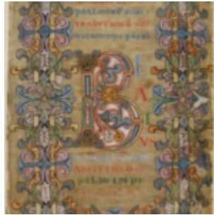
f31v инициал беатус