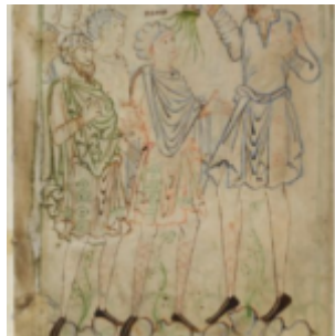
Ф. 9в, Савл и Давид