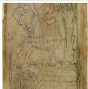
Ф. 8r, Давид во рву львином

Так, мы впервые видим здесь изображение врат ада в виде разверстой пасти описанного в Библии огнедышащего морского чудовища Левиафана, новым является и изображение уродливых зверообразных чертей, в изобилии встречающихся затем в произведениях романского искусства. В более ранних рукописях сатану изображали обычно в виде черного человека, как это было, например, в миниатюрах Апокалипсиса Беатуса из Хероны 975 года («Ад») или в рукописи 1047 года работы Факундуса («Жена, облаченная в солнце, и дракон»), В «Сошествии во ад» в Котонианской Псалтири сатана имеет звериную морду, когтистые лапы и всклокоченную щетину волос.