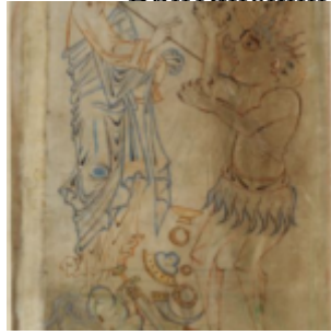
Ф. 10v, Искушение Христа