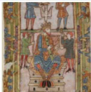
Ф. 30v, Давид на троне