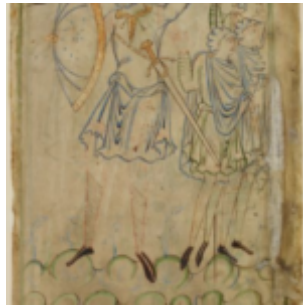
Ф. 9г, убитый Голиаф