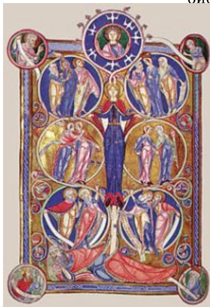
The Tree of Jesse

«Библия дворца Ламбет» / Ламбетская Библия (ок. 1150 — 1170, библиотека Ламбетского дворца, место изготовления спорно) | 1 Ламбетская Библия 12 века — иллюминированная рукопись (возможно, созданная около 1150-1170), одна из лучших сохранившихся гигантских Библий романской Англии. Она существует в двух томах; первый том находится в библиотеке Ламбетского Дворца и охватывает Книгу Бытия на 328 листах пергамента размером около 520 x 355 мм.; второй том в неполном объеме (охватывает псалмы до Откровения) в Мейдстоунском музее.