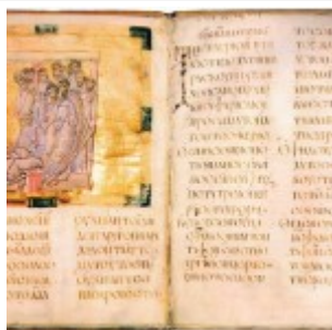
Разворот с миниатюрой «Омовение ног» и инициалом