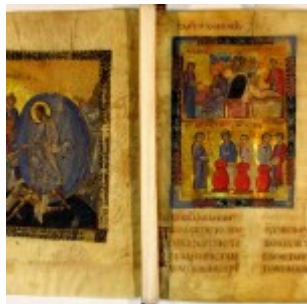
Миниатюра «Сошествие в ад» и двухъярусная миниатюра «Брак в Кане Галилейской» (верхняя часть) и «Чудо в Кане Галилейской» (РНБ. Греч. 21, л. 1 об.-2)