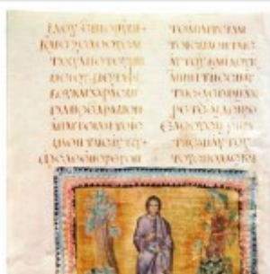
Явление Христа святым женам