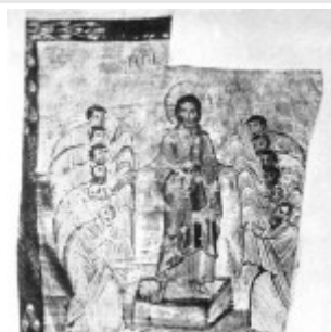
Отослание апостолов на проповедь