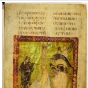
Миниатюра «Крещение» (РНБ. Греч. 21а, л. 1)