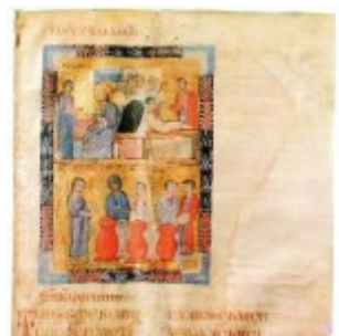
Чудо в Кане Галилейской л. 2