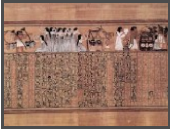
Погребальная процессия (окончание).