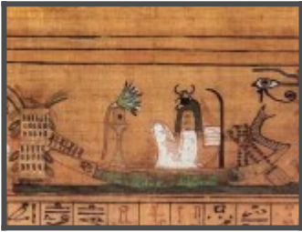
Фрагмент главы 17. Ани молится солнечной ладье, "плывущей" на знаке неба. В ней сидит Хепри - утреннее солнце (фигура со скарабеем вместо головы).