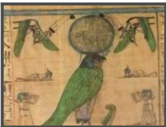
Виньетка к так называемой главе 16. Солнечное божество представлено в

Около 1100 года до н.э. Лондон, Британский музей