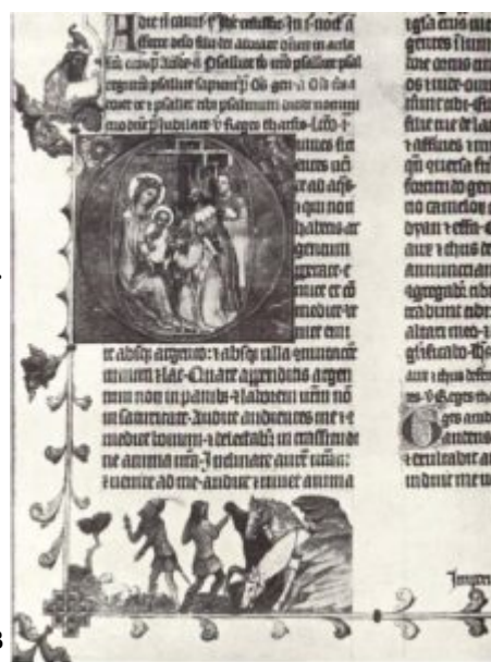
Бревиарий Яна из Стржеды. Фрагмент. До 1360 года

Только приход мастеров в 90-х годах, впитавших эстетику «прекрасного стиля», превращает придворную мастерскую в особую школу чешской книжной миниатюры. Ее специфика проявилась в иллюстрировании второго тома Библии Вацлава IV (Вена, Национальная библиотека), в миниатюрах мюнхенской астрологической рукописи (Мюнхен, Государственная библиотека), титульных листов «Квадрипарти Птолемея» (Вена, Национальная библиотека) и в «Золотой булле» — сборнике законов Карла IV (Вена, Национальная библиотека). Миниатюры этих рукописей отличаются прежде всего цветовой гармонией, мягкостью исполнения, ритмичностью орнаментального декора, подвижностью свободно моделированных фигур. Здесь несомненно влияние пластики «прекрасного стиля».