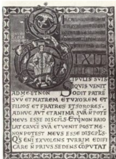
Вышеградский кодекс. Инициал. 1083

В его миниатюрах мы находим все сюжеты, которые были выработаны в романском искусстве Центральной Европы, но встречаются и