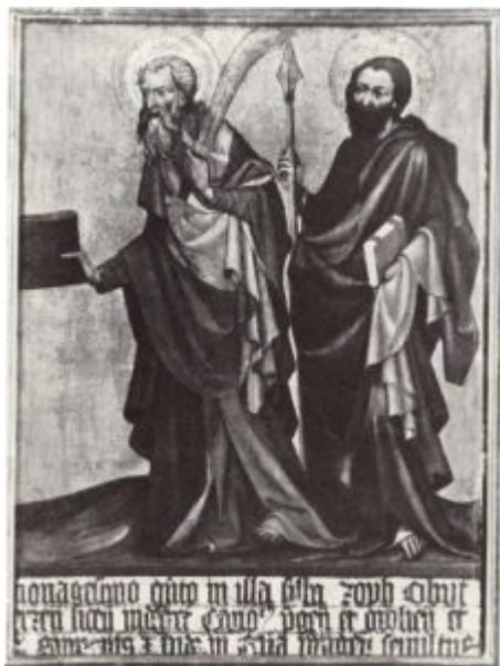
Эпитафий Яна из Ержене. Правая часть. 1395

Наряду с итальянскими чертами в миниатюрах breviария сохранились и другие характерные приметы, свидетельствующие о том, что исполнитель его знал и парижскую школу, а также произведения Мастера Вышебродского алтаря.