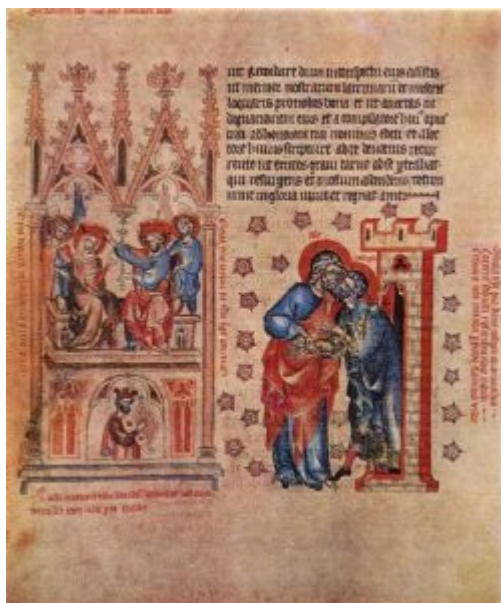
Пассионарий аббатисы Кунгуты. Фрагмент. 1313—1321

В чешской стенной живописи первой половины XIV века очень часто прослеживается непосредственная связь с книжной миниатюрой. Именно иллюстрированные книги были тем звеном, которое соединяло Чехию со странами развитой готической культуры. Они быстрее всего доносили достижения искусства Франции, Англии, Италии в Центральную Европу. Интересным примером являются рукописи королевы Елизаветы Рейчки, дарованные ею Старобрненскому монастырю, где она впоследствии провела последние годы жизни. Возникли рукописи в период с 1315 по 1330 год в неизвестном чешском скриптории. В них отразилось состояние искусства миниатюры в Чехии в первой половине XIV века. В рукописях встречаются мотивы французского происхождения, элементы английской книжной живописи, а также итальянское влияние.