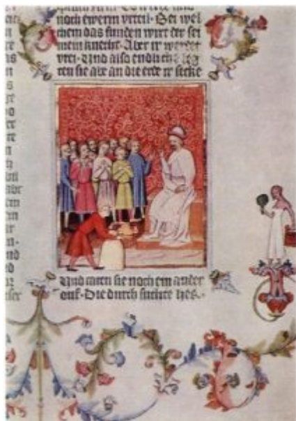
Библия Вацлава IV. Фрагмент. Конец XIV века

В эпоху Вацлава IV значительный размах приобретает библиофильство. Сам король был страстным коллекционером иллюстрированных рукописей, при его дворе работала большая группа переписчиков и иллюстраторов, в которую входили художники разных поколений и школ. Время и войны не пощадили придворной библиотеки, из всех ее памятников до наших дней сохранилось только восемь.