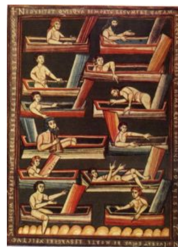
Вышеградский кодекс. Воскресение из мертвых. 1083

рамки. Если рамка не заполнена текстом, ее украшает растительный или геометрический орнамент. Собственно декоративная разбивка страницы особенно четко видна на страницах с родословной Христа. Они расчленены наподобие витражей или расписных потолков и образуют нечто вроде коврового узора. Открывается рукопись страницей с изображением четырех евангелистов. Уже в этой миниатюре разворачивается гармония стилизованной романской формы и необычного колорита, основанного на комбинации блеклых цветов и золотого фона. Контурный рисунок дополнен внутренним, расчленяющим и как бы лепящим отдельные формы параллельными штрихами.