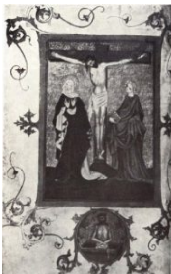
Миссал 1413 года. Фрагмент

Придворной школе конца XIV — начала XV века принадлежит и миссал пражского архиепископа Збинека Зайце (1409, Вена, Национальная библиотека). В миниатюрах этой рукописи внимание концентрируется на лирической трактовке пластически полнозвучных фигур, на мелодичности линий драпировки и мажорной палитре цветов. В миниатюрах царит культ молодости, свойственный «прекрасному стилю», множество фигур юношей и девушек введено здесь в какую-то возвышенную, праздничную атмосферу.