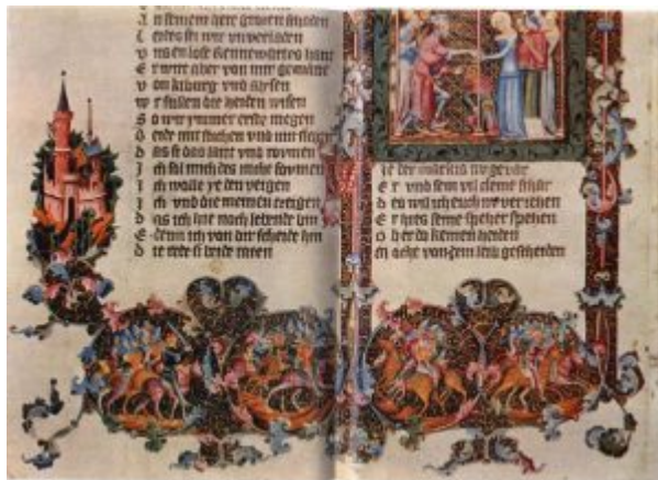
Рукопись Виллегальма. Фрагмент. 1392-1393

Новый тип орнаментированной придворной рукописи, созданный в процессе усвоения первоклассных образцов из Франции, Германии, Италии, формируется в Чехии в 50-е, 60-е годы XIV века, то есть в годы правления Карла IV, слывшего библиофилом. Другим инициатором иллюстрирования книг был его канцлер, епископ Ян из Стржеды, посещавший вместе с императором Италию и знакомый с ее гуманистическим искусством.