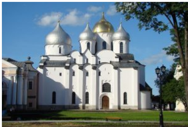
Вид на Софийский собор в Новгороде

которыми идут ряды плинфы. Сильные выносы лопаток-контрфорсов и как бы прорубленные окна членят широкие плоскости стен, преодолевая тяжесть и сопротивление каменной массы, оформляют ее. Барабаны глав поставлены на один уровень и не отделяются постаментом от основного объема, отчего делаются похожими на своеобразные колодцы, через которые свет «вливается» в пространство храма, надежно скрытое оболочкой стен, и наполняет его. Былое многообразие пространственных ритмов подчинено доминирующим вертикалям.