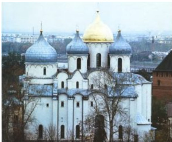
Собор Святой Софии в Новгороде. 1045-1052. Вид с юга

Новгородская София проще и лаконичнее по своим формам, как бы сродни новгородскому духу. Это 5-, а не 13-купольный, пятиглавый храм, с широкой галереей и лишь одной лестничной башней. Строже и монолитнее не только ее экстерьер, поражающий благородством своих мощных форм, но и интерьер, скромнее его убранство, в котором не было ни мозаик, ни мрамора, ни шифера. Иной и строительный материал: вместо тонкой изящной плитки используется местный грубый известняк. Кирпич использован лишь в сводах и арках.