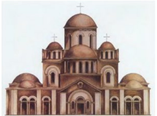
Церковь Богоматери (Десятинная) в Киеве. 989-996. Реконструкция

– первый известный нам каменный храм Киевской Руси. Десятинная церковь (князь выделил на ее содержание \frac{1}{10} часть своих доходов – отсюда и название) была разрушена во время нашествия монголо-татар, поэтому мы можем судить о ней лишь по остаткам фундамента, некоторым элементам декора и по письменным источникам. Это была большая 25-главая шестистолпная церковь, с двух сторон обнесенная пониженными галереями, что придавало пирамидальный облик всему храму (западная часть имела сложную, до сих пор до конца не выявленную планировку).