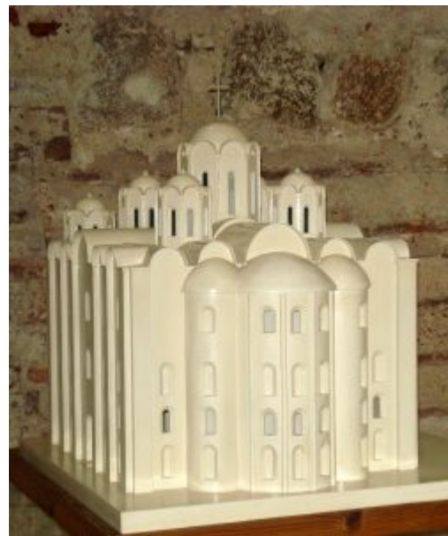
Макет первоначального облика Софийского собора в Полоцке

После многочисленных разрушений и перестроек от древнего собора 11 в. остались фундамент, нижние части стен и опорных столбов, и только восточная апсида поднимается на высоту около 12 м. При возведении собора в 11 в. в качестве строительного материала использовали плинфу – плоский кирпич, рецепт изготовления которого как и технологию кладки завезли сюда византийские мастера. Кладка собора велась в классической для архитектуры Византии технике с «утопленным рядом», когда каждый второй ряд плинфы был спрятан, утоплен вглубь стены и сверху затирался цемянкой. И таким полосатым, неоштукатуренным храм был с внешней стороны в 11