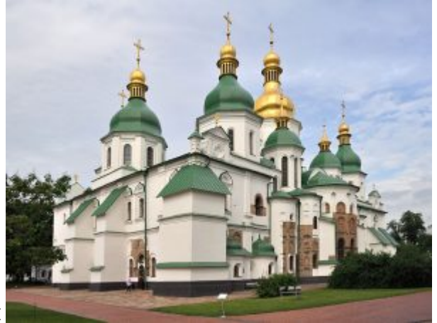
Вид на Софийский собор

(площадью около 600 кв. м) хоры. Софийский храм, как и Десятинная Церковь, был обнесен внутренней двухэтажной галереей – гульбищем. К сожалению, Киевская София была перестроена в XVII в., как многие русские храмы на Украине, в духе «украинского барокко», в результате чего исчезла характерная для нее пирамидальность, постепенное наращение масс от галерей к боковым куполам, а от них – к центральному, что определяло облик всего храма.